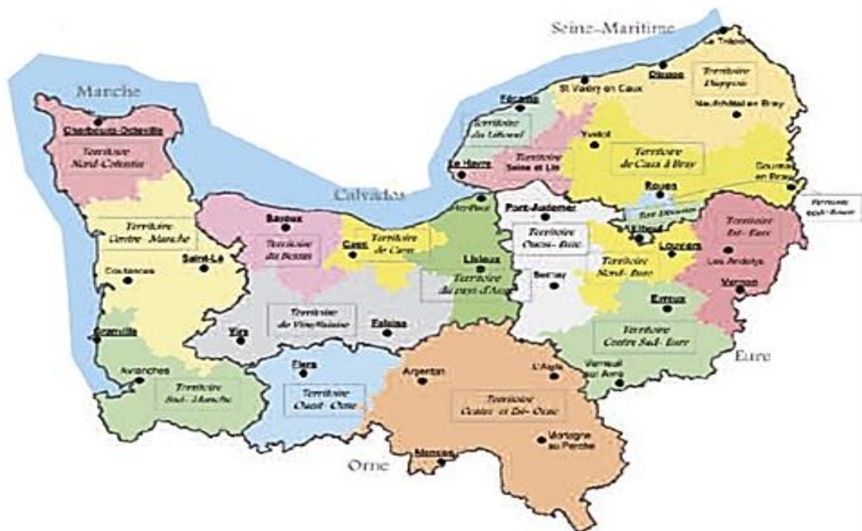
Figure 1 : Territoires sociaux de la CARSAT Normandie