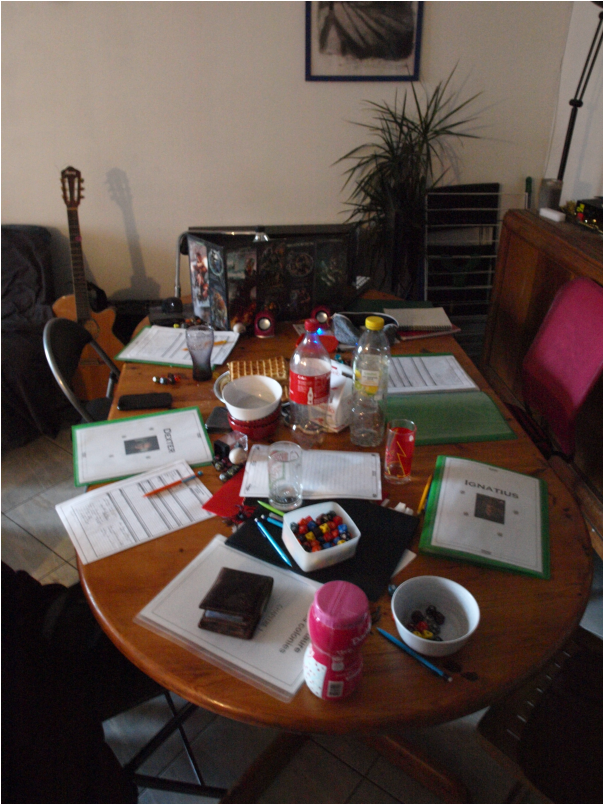
Photo n°01 : Table de jeu chez Barnabé au cours d'une campagne de Centaure, les Colonies. Point de vue des joueurs. Le 17 mars 2018.

Comme le souligne Ugo Roux, depuis la démocratisation des téléphones, ordinateurs et tablettes il est fréquent qu'un jeu soit accompagné d'une musique d'ambiance, qui peut faire l'objet d'une intense recherche pour correspondre à une situation particulière dans le scénario, visant à créer une sensation ou un état d'esprit spécifique autour de la table. Ces appareils servent aussi à montrer des plans et autres images. Depuis quelques années enfin, la table de jeu de rôle s'est aussi dématérialisée grâce à des plateformes comme Roll20 34 , permettant aux rôlistes de jouer malgré la distance [Roux, 2016].