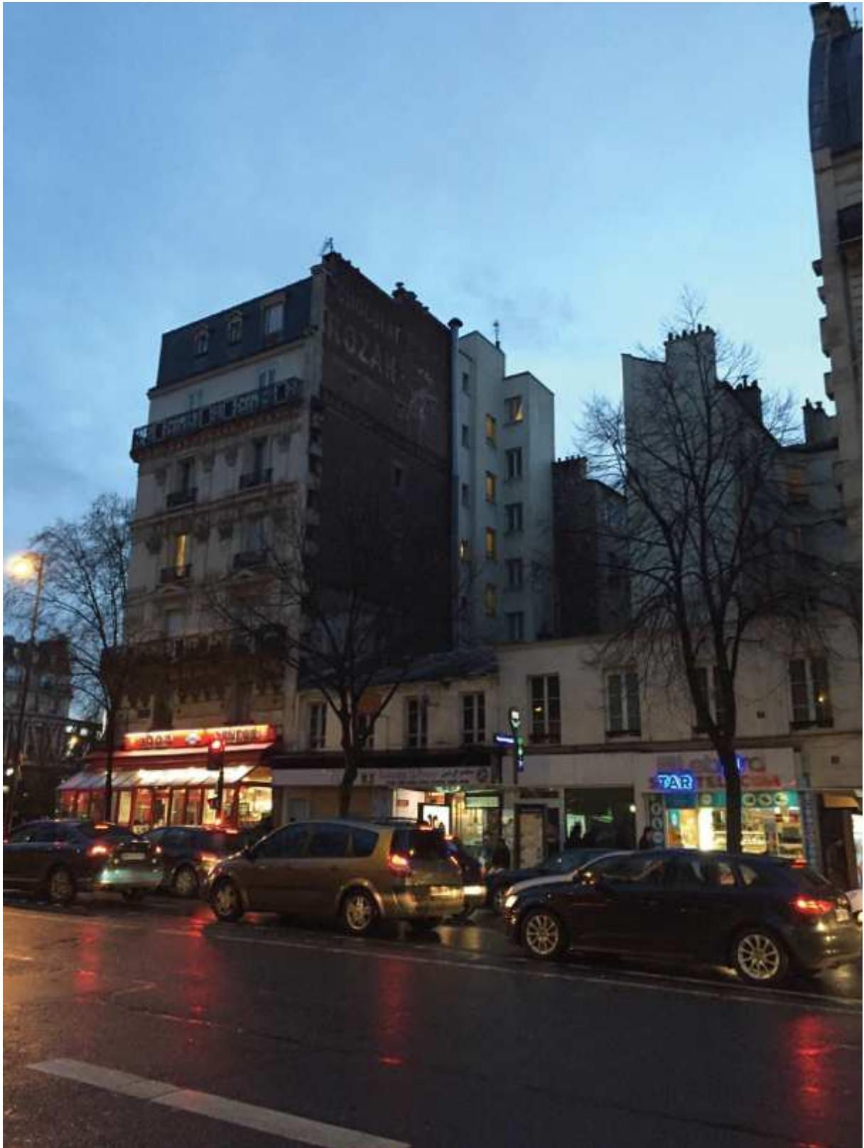
Chocolat Rozan - 1 rue Marx-Dormoy, 75018 Paris