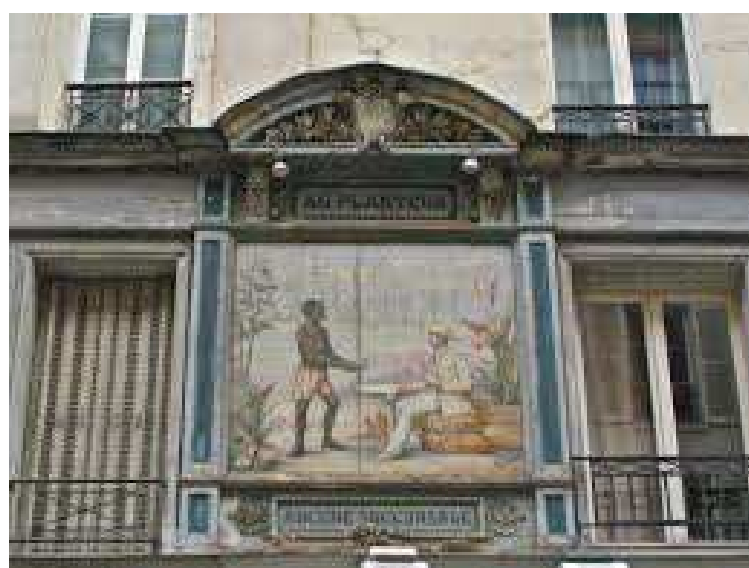
Au planteur – rue Montorgueil, 75002 Paris