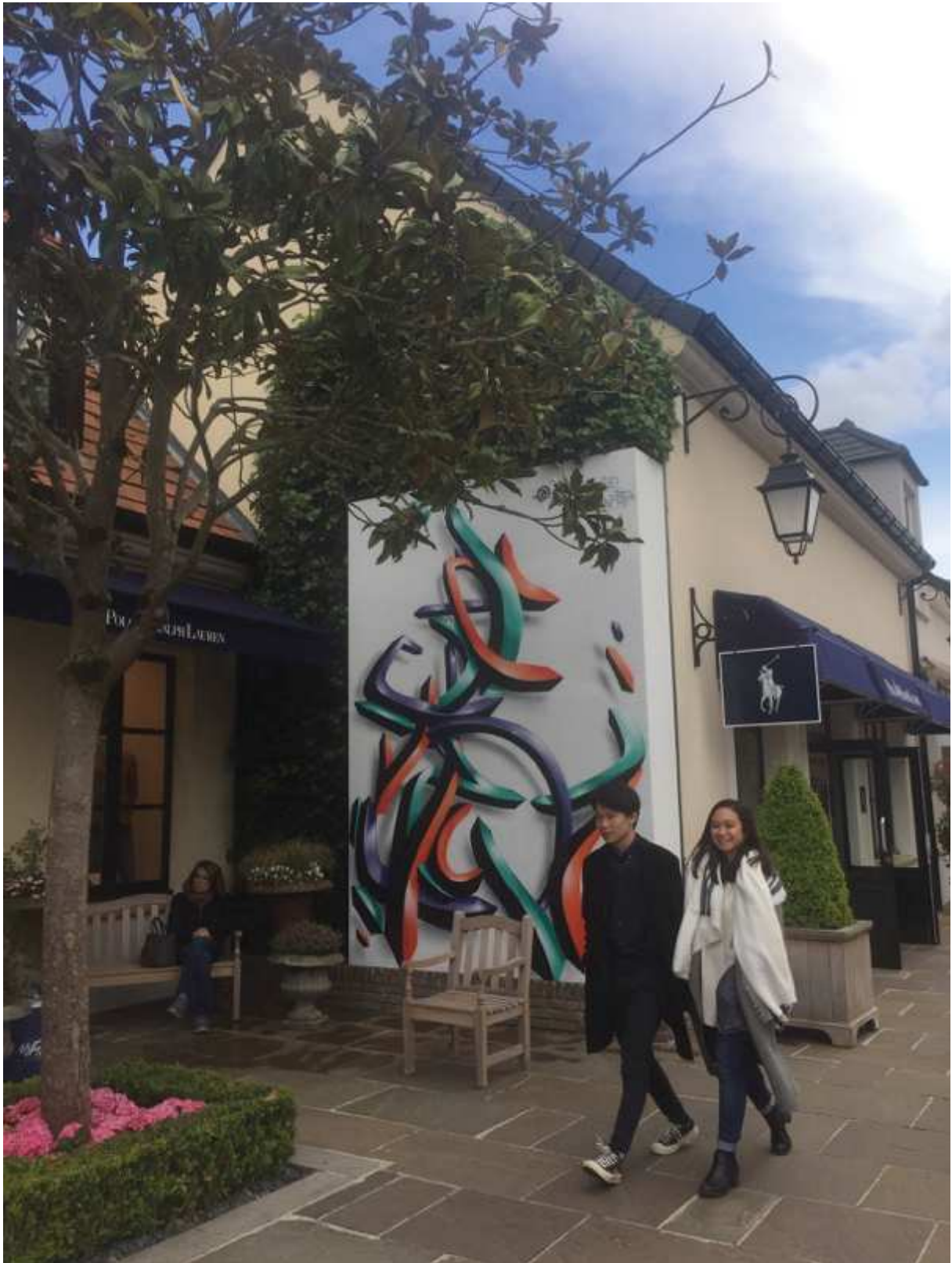
Mur peint de la vallée village