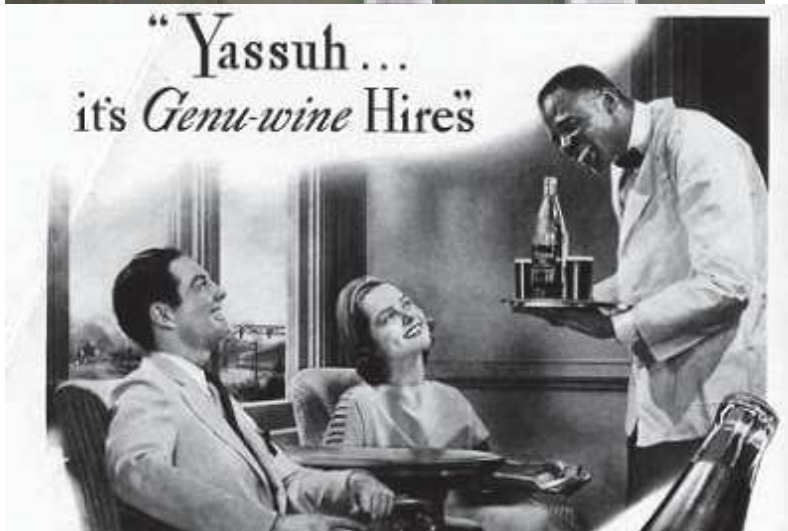
Publicité Hires Root Beer - 1937