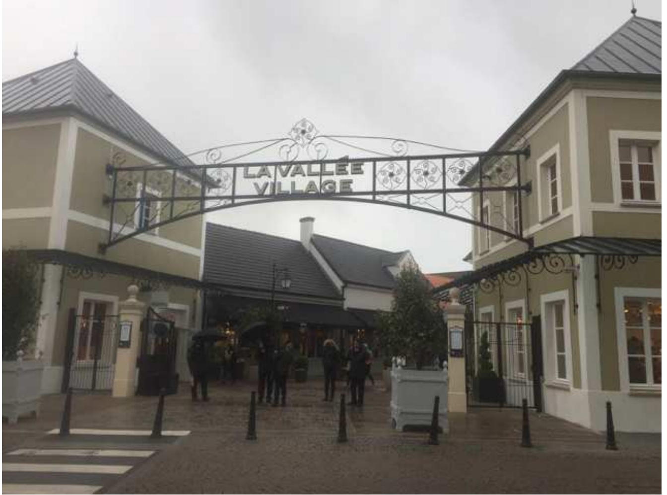
Entrée de la Vallée Village