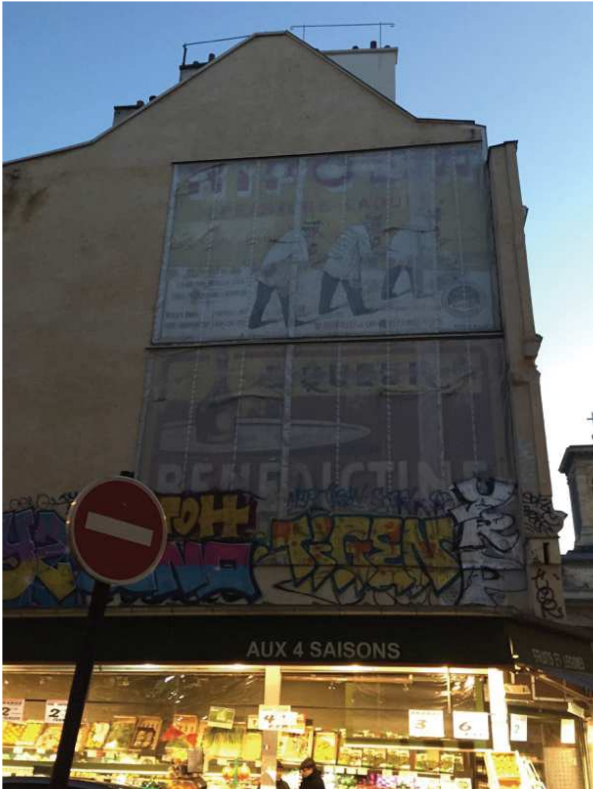
Ripolin – 1 rue des Martyrs, 75009 Paris