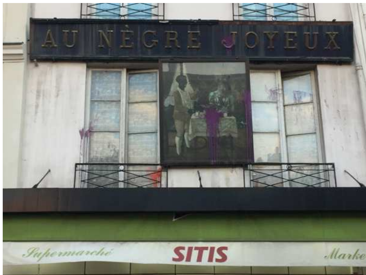
Le Nègre Joyeux - Place de la Contrescarpe, 75005 Paris