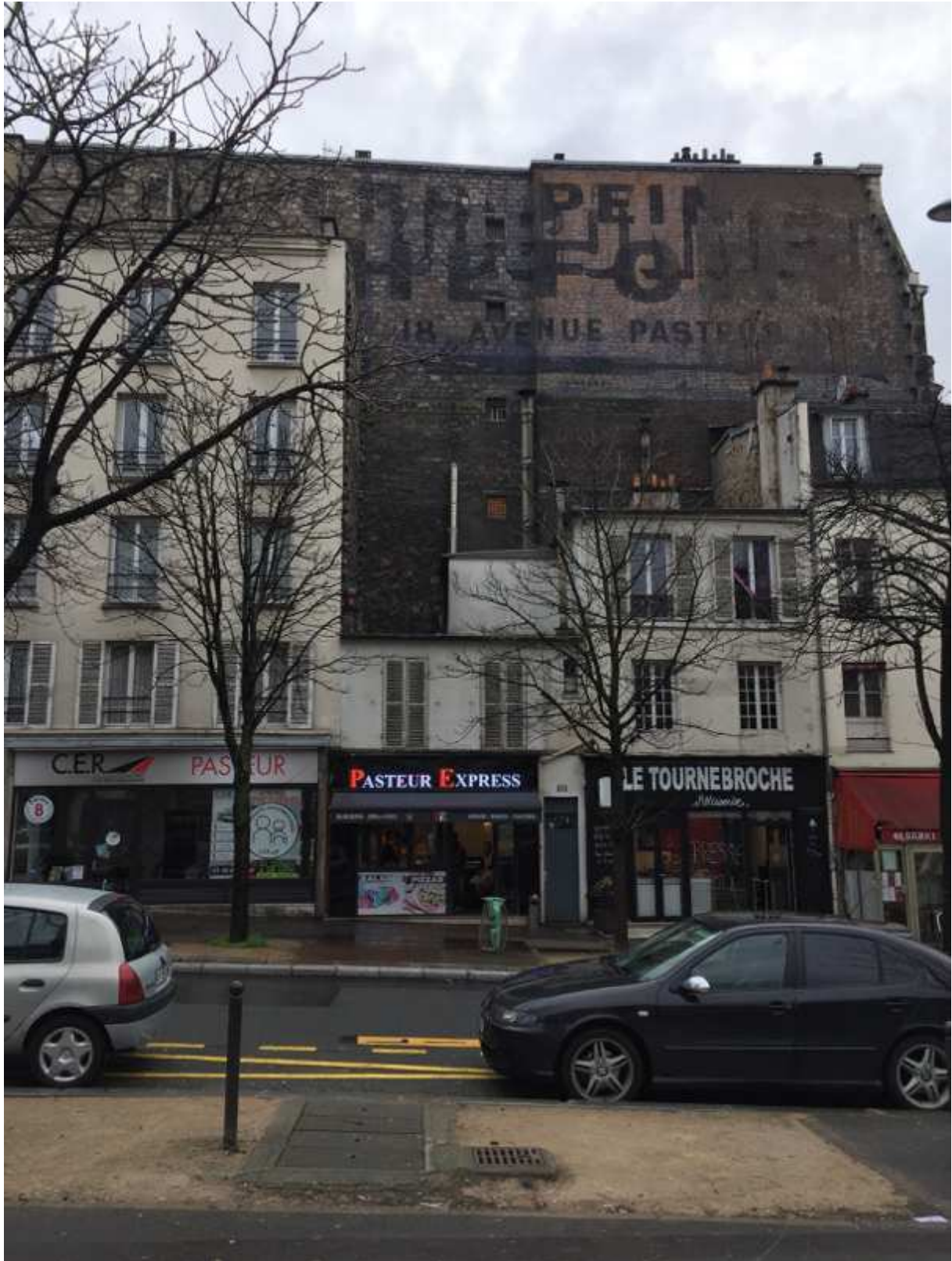
Magasin de papiers-peints - 20 bd Pasteur, 75015 Paris