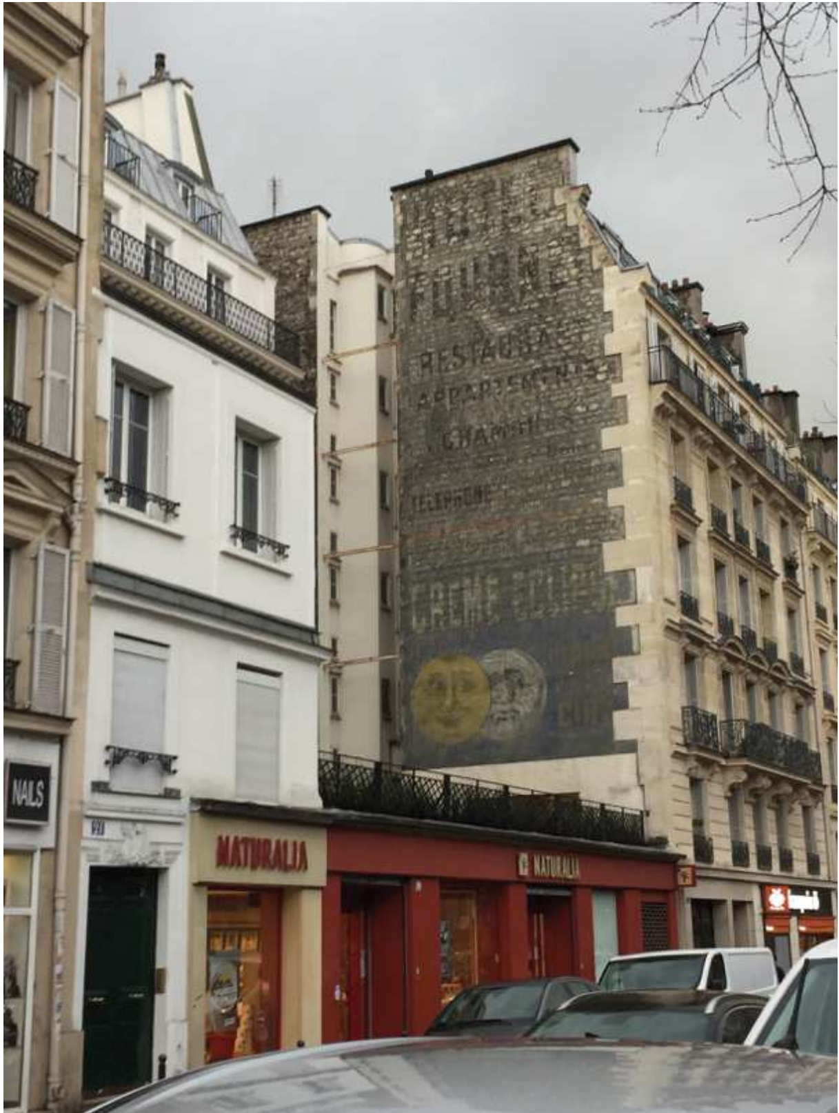
Crème Eclipse, cirage à la cire – 23 bd des Batignolles, 75008 Paris