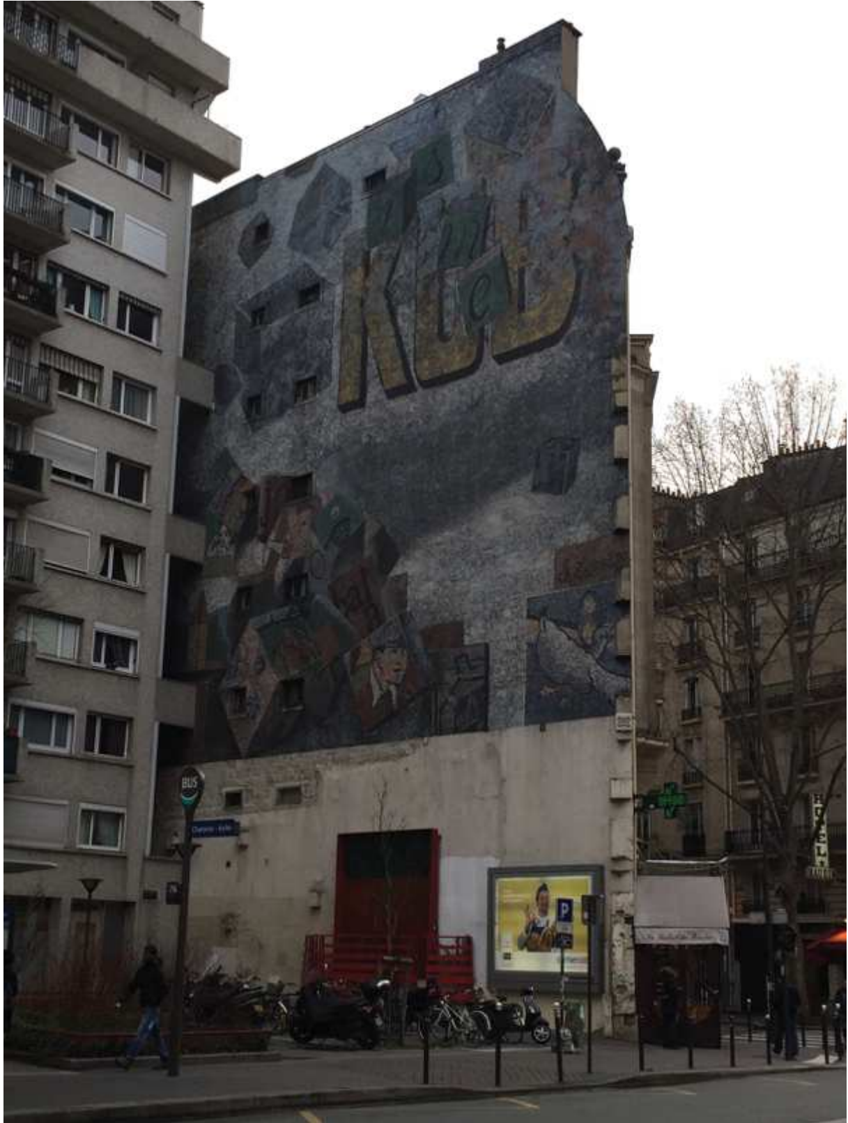
Kub - 50 rue de Charonne, 75011 Paris