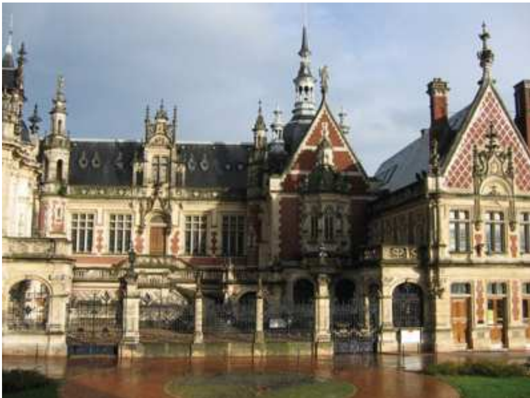
Palais Bénédictine - Photo Ouest France du 27 septembre 2013.

Lorsqu'on clique sur la fiche descriptive du palais-musée Bénédictine, on y trouve dès le début un historique du palais Bénédictine qui permet d'installer la légende autour de ce produit et de l'ancrer dans le territoire normand. Force est de constater que le mot marque n'y est jamais employé. On y parle d'élixir, de distillerie, d'Alexandre le Grand ou encore d'art ; l'aspect mercantile y est complètement gommé. On peut aussi y voir une vidéo de promotion du musée dans laquelle la responsable des relations extérieures présente le palais comme « une forme de mécénat culturel vers l'art moderne ou l'art culturel ». Ainsi le visiteur peut y voir se côtoyer une collection d'art anciens ferronnière, des plantes et des épices du monde entier...mais aussi une boutique dédiée à la liqueur. L'art présenté est au service de la marque puisque l'une des artistes exposée dans la galerie d'art contemporaine est également à l'origine de la création de bouteilles de collection que l'on peut retrouver probablement dans la boutique du musée. Il faut rappeler que la bénédictine et son flacon ont inspiré de nombreux artistes : Paul Gauguin, Le Douanier Rousseau ou Marcel Duchamp, et des affichistes comme Mucha, Paul Iribe et Leonetto Cappiello qui l'ont représenté dans certaines de leurs œuvres.