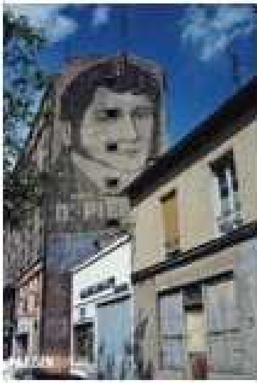
La pâte dentifrice Dr Pierre 92800 Puteaux