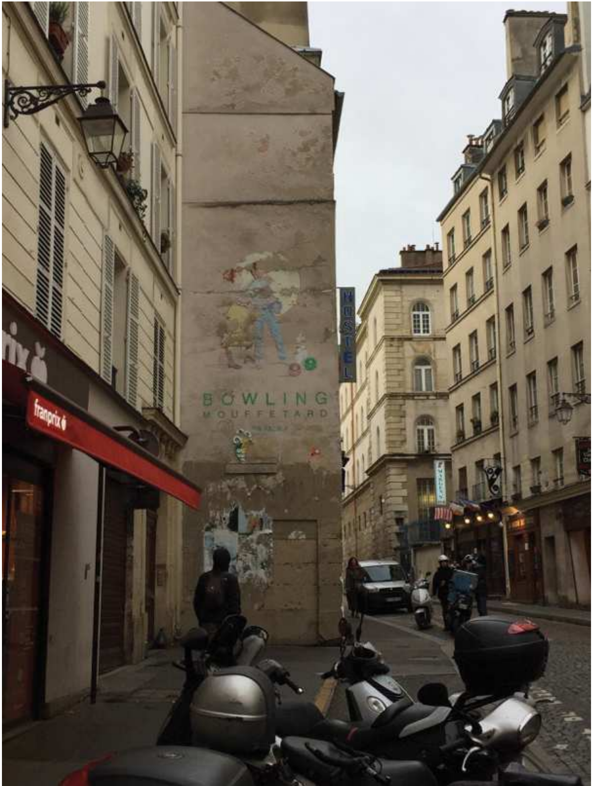
Bowling - 73 rue Mouffetard, 75005 Paris