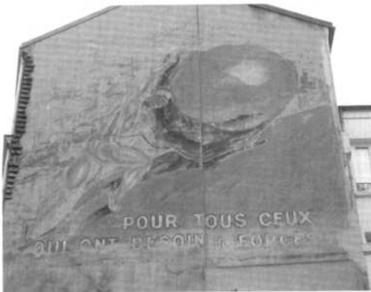
Ovomaltine Pharmacie 92150 Suresnes