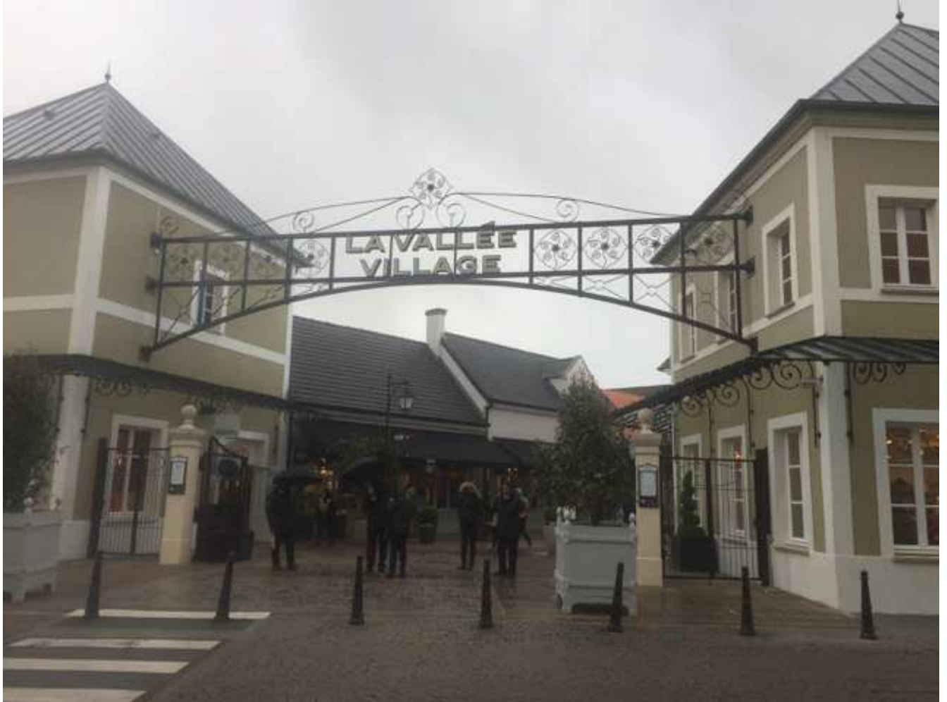
Entrée de la Vallée Village