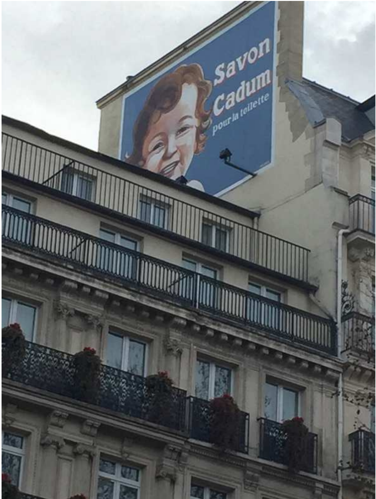
Savon Cadum - 3 bd Montmartre, 75002 Paris