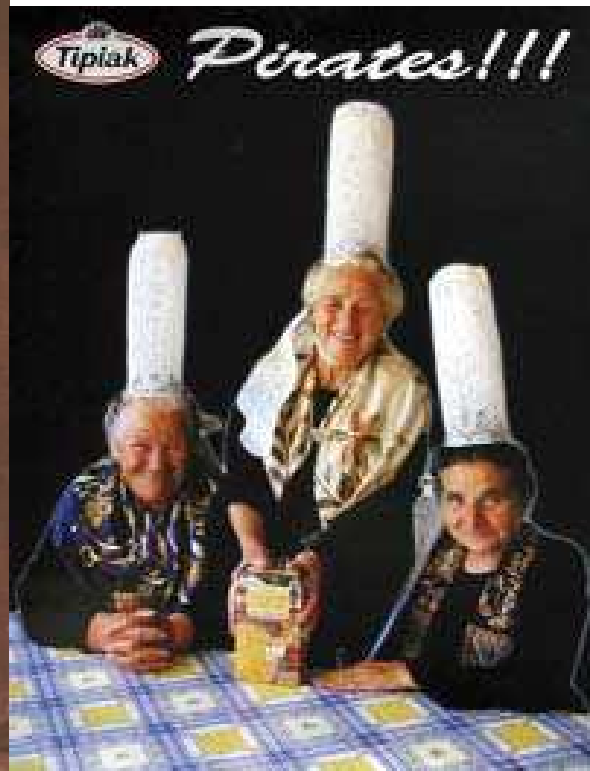
Publicité Tipiak - 1993