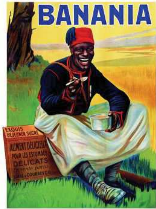
Publicité Banania - 1915