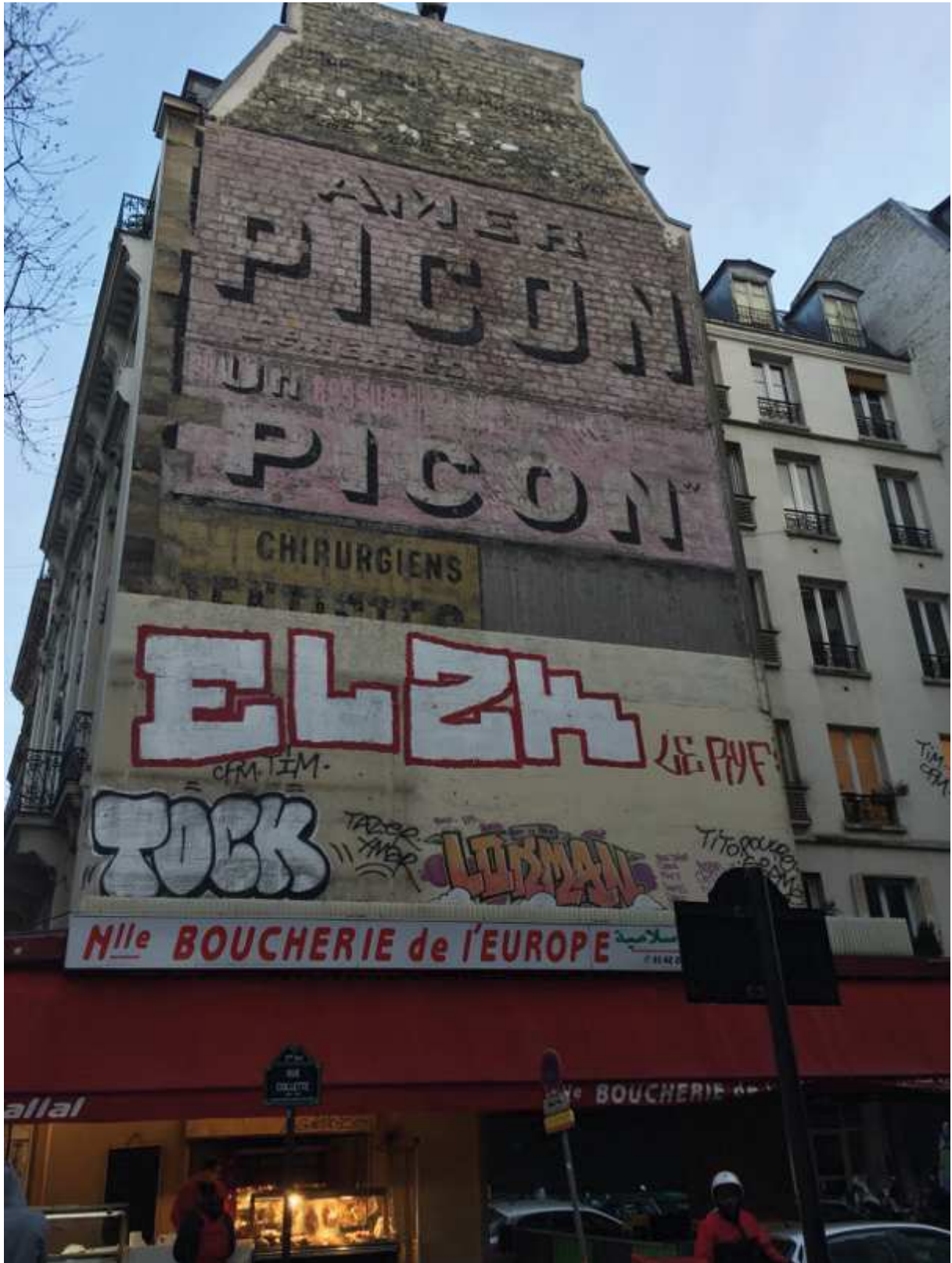
Amer Picon - 1 rue Collette, 75017 Paris