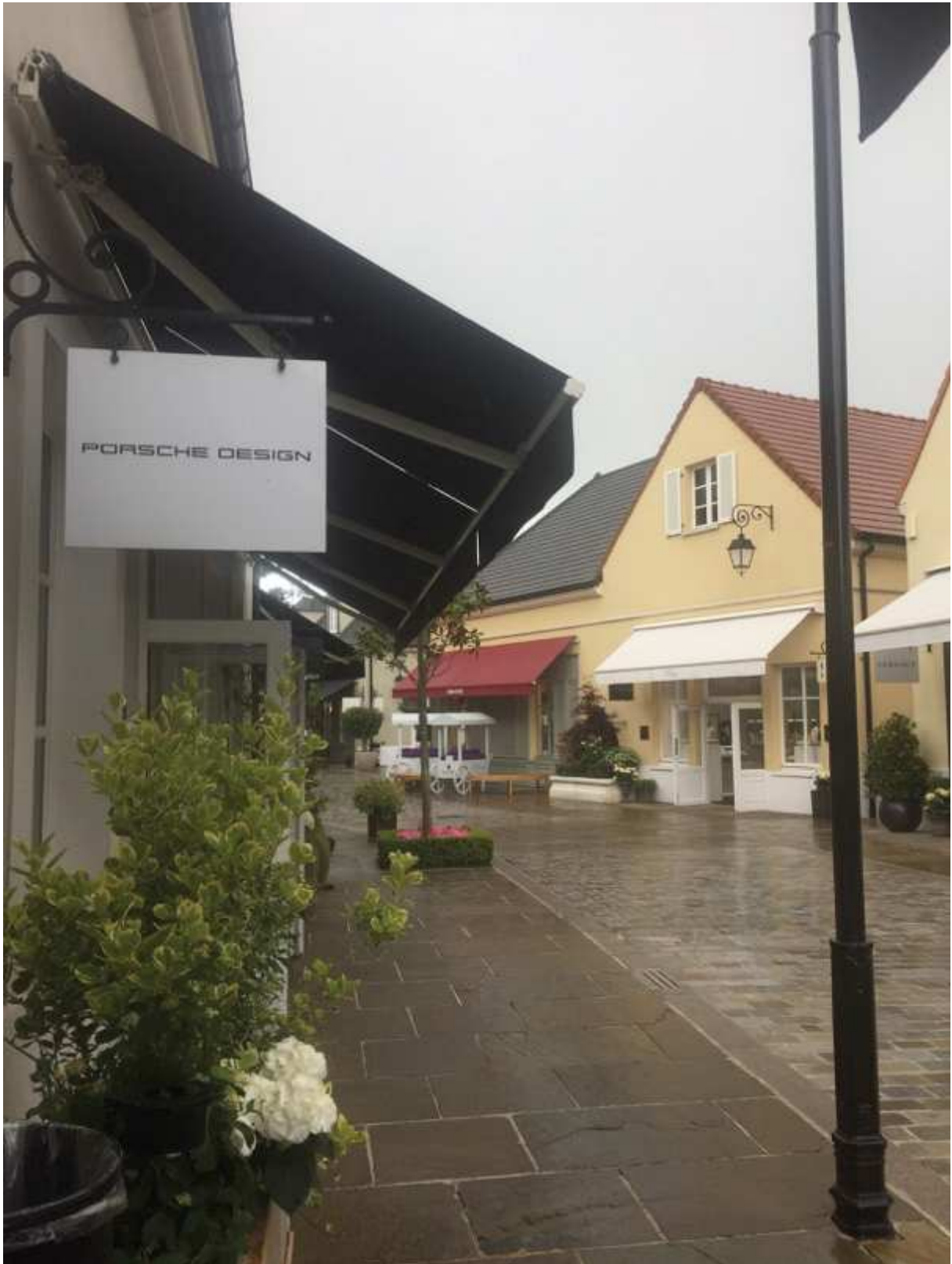
Une rue de la vallée village