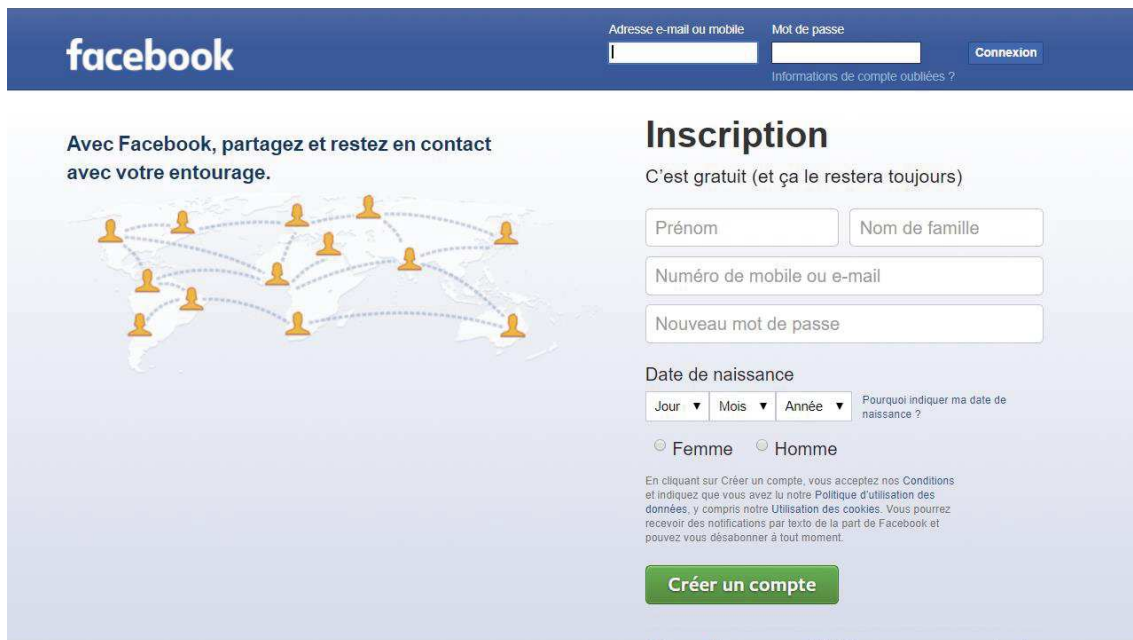
Annexe n°1 : Page d'accueil pré-connexion du réseau social Facebook, en français. Juillet 2017.