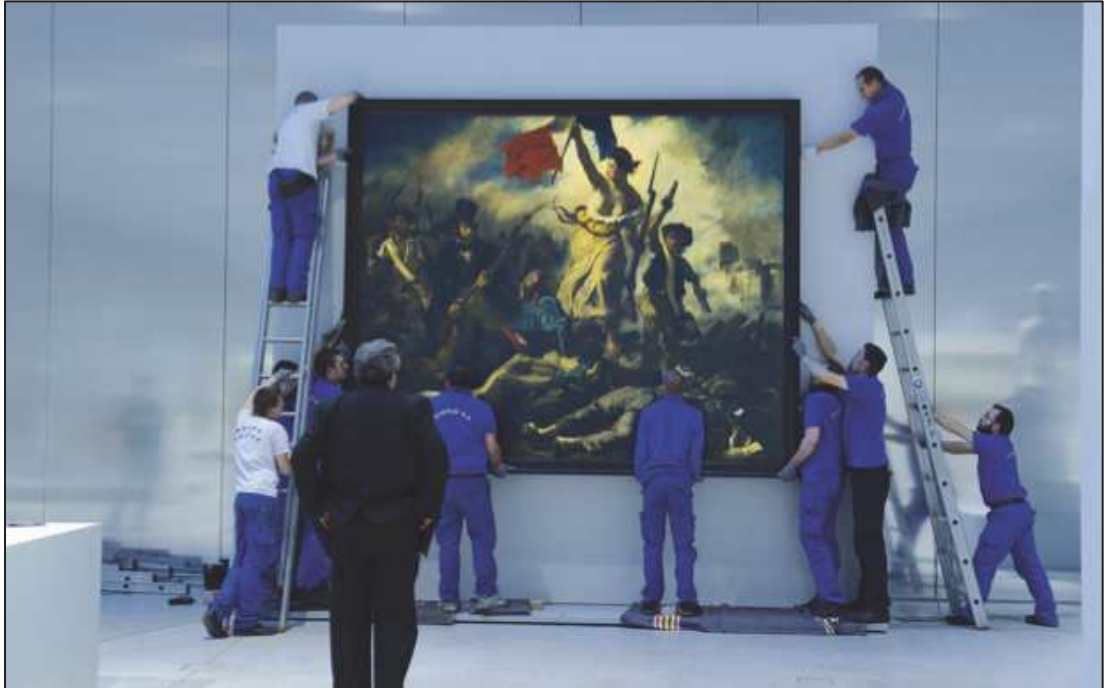
5. « La liberté guidant le peuple », Hubert Fanthomme. Source : Paris Match 08 février 2013.