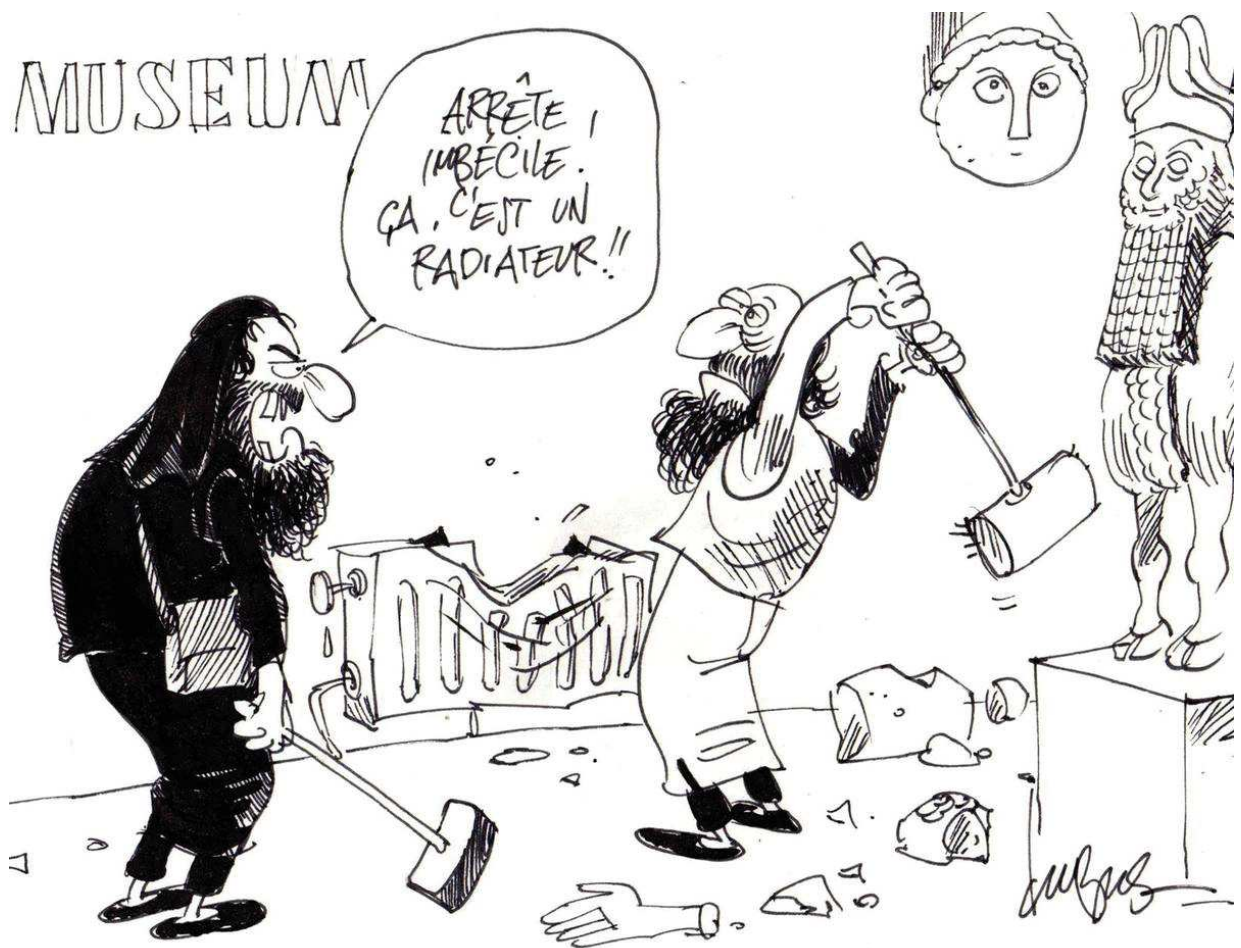
1. « Arrête imbécile ! Ça, c'est un radiateur ! », Charlie Hebdo, 5 mai 2015.