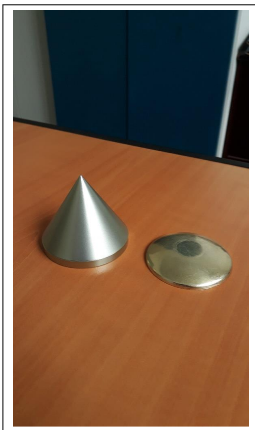
Figure 4 : Photographie de deux modèles de « CMO » apportés par André.