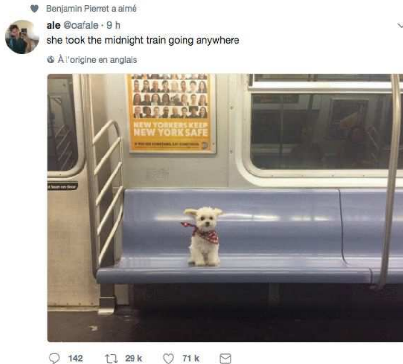
Exemple d'apparition de tweet sur un fil d'actualité Twitter

Le fait que la popularité des contenus se matérialise sous forme de coeur, et qu'il n'existe pas de façon de ratifier négativement donne donc la priorité aux contenus à valeur émotionnelle positive. En effet, il apparaît plus difficile d'apposer un coeur sur un tweet qui mentionne un article de presse sur les horreurs qui ont lieu dans le contexte de la guerre civile en Syrie que sur un tweet non seulement au caractère humoristique, mais qui montre aussi la situation cocasse impliquant un petit chiot.