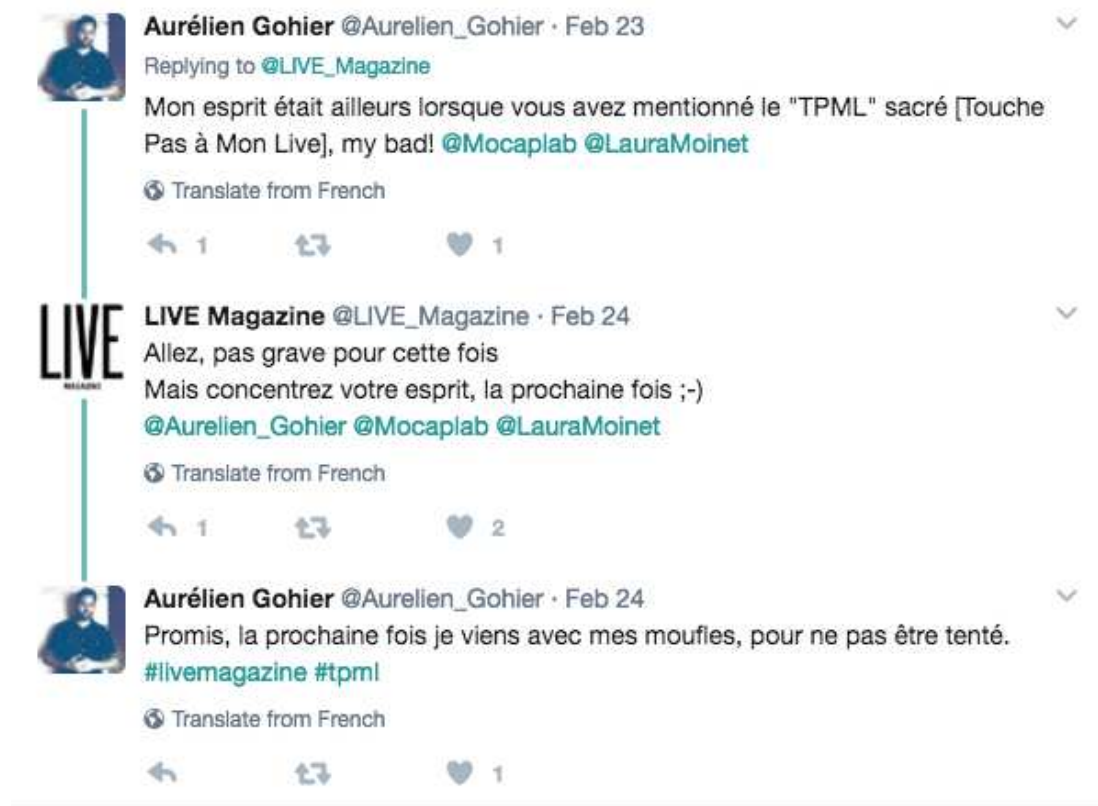
Capture d'écran d'une conversation sur Twitter entre un spectateur et le compte du Live Magazine