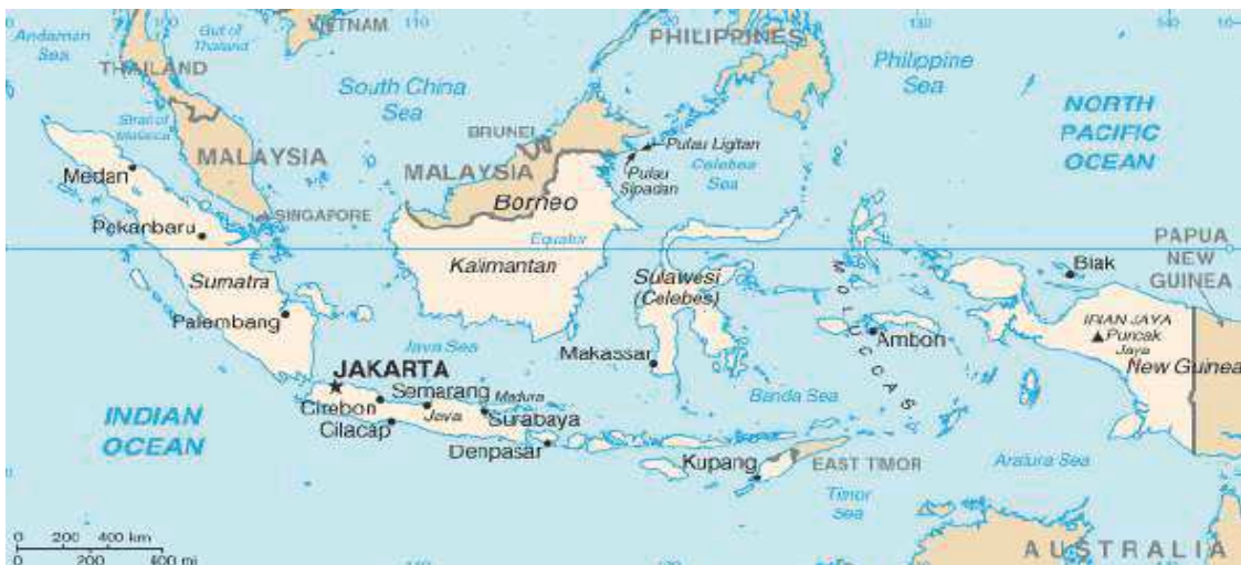
Figure 1: Les îles de l'Indonésie

Situé entre les océans indien et pacifique, le plus grand archipel du monde compte plus de 250 millions d'habitants. Les 34 provinces et les 17.504 îles de l'Indonésie ont 200-300 groupes ethniques qui coexistent en harmonie et donnent naissance à un melting-pot de cultures, de personnes fascinantes, et de magnifiques paysages qui varient d'une province à l'autre. Le vaste archipel indonésien s'étend autour de l'équateur, entre les continents asiatique et australien 1 . Les plus grands et les plus connues des îles indonésiennes, l'on trouve Sumatra, Java, Kalimantan (la partie indonésienne du Bornéo), Sulawesi (Célèbes), Maluku (les Moluques ou « îles aux épices » autrefois tant convoitées par les européens), Papua (la partie occidentale de la Papouasie), et Bali, la plus célèbre île de l'archipel. Le territoire de l'Indonésie consiste de l'archipel, encerclé par l'océan et la mer, ce qui fait l'Indonésie un pays maritime.