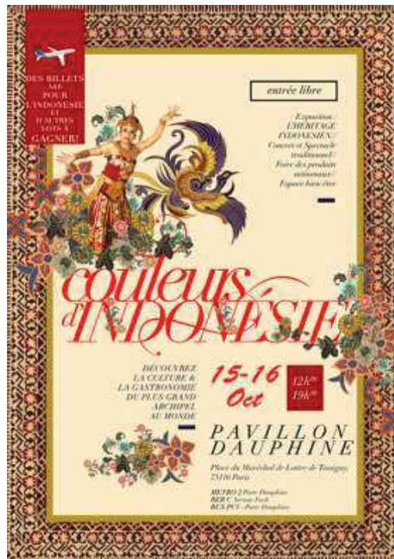
Figure 12 : Affiche sur les Couleurs d'Indonésie 2016

L'affiche du FCI 2016 se caractérise d'un design simple avec un fond clair, les écritures rouges et noires, et une image qui représente l'identité culturelle indonésienne. Cette affiche contient :