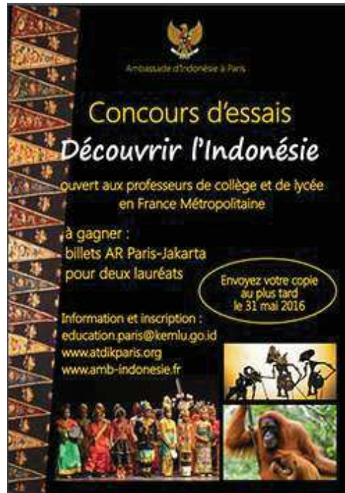
Figure 7: Affiche du Concours d'Essais 2016

L'affiche du Concours d'Essais 2016 a un design simple avec un fond noir, les écritures en or, et une image qui représente la culture indonésienne :