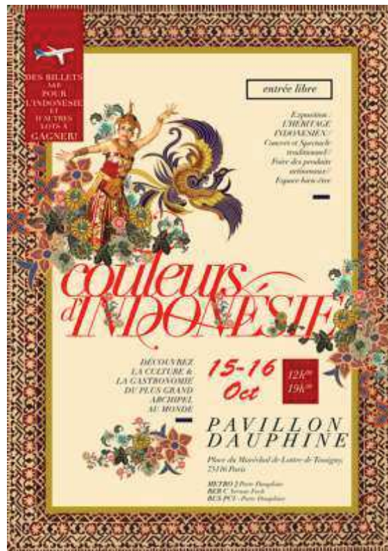
Figure 12 : Affiche sur les Couleurs d'Indonésie 2016

L'affiche du FCI 2016 se caractérise d'un design simple avec un fond clair, les écritures rouges et noires, et une image qui représente l'identité culturelle indonésienne. Cette affiche contient :