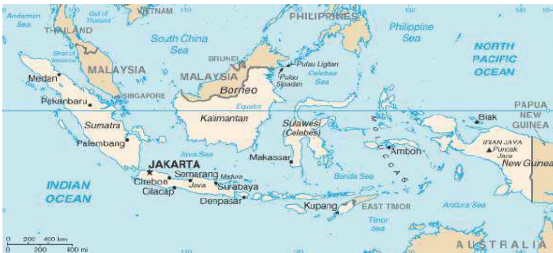
Figure 1: Les îles de l'Indonésie

Situé entre les océans indien et pacifique, le plus grand archipel du monde compte plus de 250 millions d'habitants. Les 34 provinces et les 17.504 îles de l'Indonésie ont 200-300 groupes ethniques qui coexistent en harmonie et donnent naissance à un melting-pot de cultures, de personnes fascinantes, et de magnifiques paysages qui varient d'une province à l'autre. Le vaste archipel indonésien s'étend autour de l'équateur, entre les continents asiatique et australien 1 . Les plus grands et les plus connues des îles indonésiennes, l'on trouve Sumatra, Java, Kalimantan (la partie indonésienne du Bornéo), Sulawesi (Célèbes), Maluku (les Moluques ou « îles aux épices » autrefois tant convoitées par les européens), Papua (la partie occidentale de la Papouasie), et Bali, la plus célèbre île de l'archipel. Le territoire de l'Indonésie consiste de l'archipel, encerclé par l'océan et la mer, ce qui fait l'Indonésie un pays maritime.