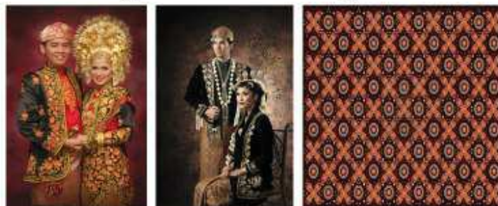
(4) La robe de mariage de Sumatra-Ouest (5) La robe de mariage de Java-Centre (6) Le Batik