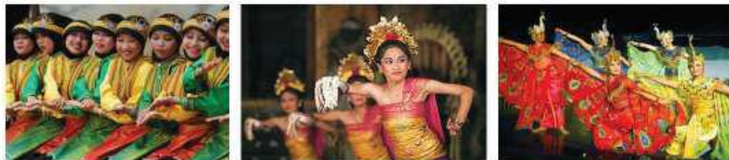
(1) La danse « Saman » d'Aceh (2) La danse « Pendet » de Bali (3) La danse « Merak » de Java-Ouest

Ce sont des formalités de la vie quotidienne dans la société de chaque région, un terme générique qui représente l'ensemble des façons de penser, de ressentir, des actes ordinaires de la vie quotidienne 5 , couvrant les règles, le système des affinités, les valeurs et les normes suivies, les cérémonies traditionnelles (telles que la cérémonie de naissance, de décès, de mariage, de jours sacrés, etc.) ainsi que les costumes traditionnelles à mettre pour certaines occasions et situations.