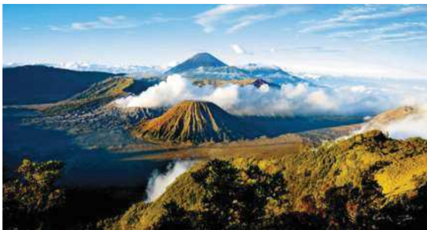
Figure 4: Le Mont Bromo en Java-Est

A part cela, il a également six religions officielles adoptées par le peuple indonésien, telles que l'Islam (87,18%), le Chrétien (6,96%), le Catholique (2,91%), l'Hindou (1,69%), le Bouddha (0,72%) et le Kong Hu Cu (0,05%) 7 .