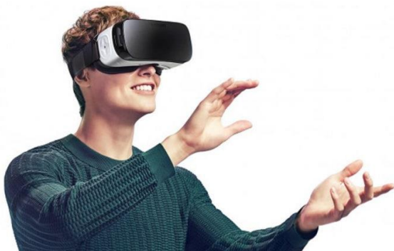
Figure 4 Illustration d'une modélisation virtuelle 3D 7