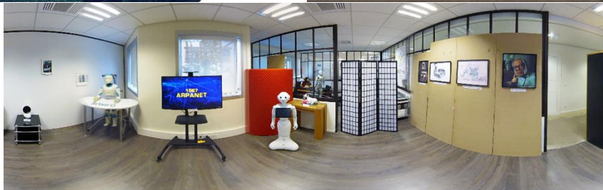
Figure 5 Illustration d'une modélisation virtuelle vidéo 360° 7

Les figures 4 et 5 donnent un bon aperçu de la manière dont une scène identique peut être abordée en réalité virtuelle.