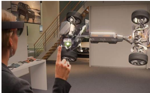
Figure 8 Illustration de la réalité mixte 11

Un dispositif de lunettes spéciales est bien sûr essentiel pour permettre à la réalité mixte d'opérer. Elles sont équipées d'une visière transparente sur laquelle sont projetés des éléments virtuels qui apparaissent en 3D dans le monde réel, et de capteurs qui, en analysant les mouvements de l'utilisateur, lui permettent de rentrer en interaction avec l'hologramme 11 .