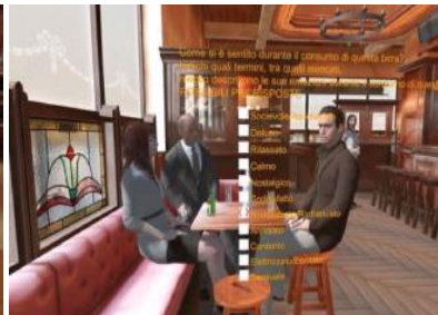
Figure 13 Illustration de la réalité virtuelle utilisant la 3D 17