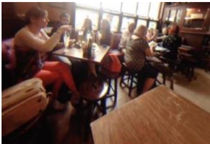
Figure 14 Illustration de la réalité virtuelle utilisant la vidéo 360° 17

Cette technique de réalité virtuelle, bien qu'à mi-chemin entre réel et virtuel, mais catégorisée ainsi par mes choix expliqué dans le chapitre 4, a l'avantage par rapport aux autres de reproduire artificiellement un contexte de consommation dans un espace réel. Une immersion complète et réaliste était donc possible en fonction bien sûr de la conformité des stimuli visuels, sonores, olfactifs utilisés. Cette technique est la seule qui ne demande pas de porter d'appareil et qui offre une interaction sociale avec les autres personnes autour. Cela procure l'avantage de rendre les participants plus à l'aise et d'ajouter encore une fois un degré de réalisme à la simulation. Côté organisation, elle fait preuve d'une certaine flexibilité en rendant possible la modification de quelques indices contextuels et contribue ainsi à étudier l'impact de ces changements sur les comportements des consommateurs (Sinesio et al, 2019).