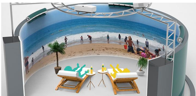
Figure 6 Illustration de salle immersive projection classique 9

Selon la forme de la salle immersive choisie, il est plus ou moins facile de catégoriser cet outil comme étant de la réalité virtuelle. En effet, les salles immersives n'utilisant pas de 3D ont recours à des éléments réels (meublier pour le décor) mais utilisent également des technologies (projections 4K, diffuseurs de son, etc.) pour immerger les participants dans un environnement artificiel. A mi-chemin entre monde réel et réalité virtuelle, je préfère dans un souci de compréhension classer l'ensemble des salles immersives comme étant de la réalité virtuelle, car, après tout, les salles n'utilisant pas la 3D ne seraient-elles pas une forme évoluée de la modélisation virtuelle vidéo 360° que l'on retrouve ci-dessus en Figure 5 ?