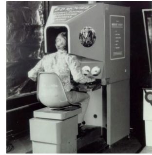
Figure 11 Illustration de la machine "Sensorama" 15

La réalité virtuelle est encore plus ancienne que la réalité augmentée mais connaîtra moins d'évolutions au cours du temps. Elle apparaît en 1962 sous la forme d'une machine de réalité virtuelle qui s'appelle « Sensorama » qui permettait à l'utilisateur de regarder un film 3D en s'immergeant dans un univers qui stimulait ses différents sens comme le toucher, l'odorat ou l'ouïe. D'autres dispositifs de ce type verront ensuite le jour mais resteront au stade de prototypes car bien trop chers à produire 15 .