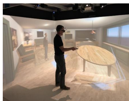
Figure 7 Illustration de salle immersive projection 3D 10