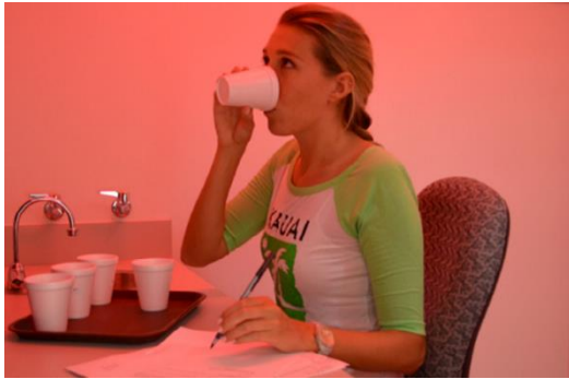
Illustration de l'environnement dans lequel a lieu un test CLT avec ici 5 échantillons de café présentés dans des gobelets neutres et identiques. Présence d'une lumière rouge pour éviter toutes distinctions des échantillons par une différence de couleur.

l'interaction avec les échantillons sont souvent courtes lors des tests CLT car une quantité limitée du produit est proposée au panéliste (Wendin, Aström et Stahlbröst, 2015, p.231).