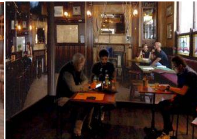
Figure 12 Illustration de la réalité virtuelle utilisant une salle immersive 17

Par ce développement, nous avons pu constater que chaque technique de réalité virtuelle a ses propres avantages en fonction du degré immersif qu'elle utilise. Partant de là, nous pouvons penser que les instituts pourront les sélectionner en fonction de leur contraintes et dans tous les cas obtenir des résultats plus fiables que si le test était mené avec une méthode « traditionnelle ». Mais sommes nous vraiment sûrs de cela ? Est-ce que les trois techniques immersives que nous venons de voir permettent toutes d'obtenir des résultats plus réalistes que la méthode traditionnelle CLT ? C'est ce que nous allons voir dans la prochaine partie.