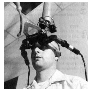
Figure 10 Illustration 1er casque de réalité augmentée 14

Commençons par nous plonger dans l'histoire de la réalité augmentée qui fit son apparition en 1968. A l'époque, il s'agissait d'un casque disposant de deux lentilles au niveau des yeux et relié à un ordinateur par un bras articulé. L'expérience consistait à faire apparaître un cube 3D qui s'ajustait en fonction des mouvements de la tête de l'utilisateur grâce à un recalcul de l'image et de l'angle de vue fait par l'ordinateur. Les bases de la réalité augmentée sont posées 13 .