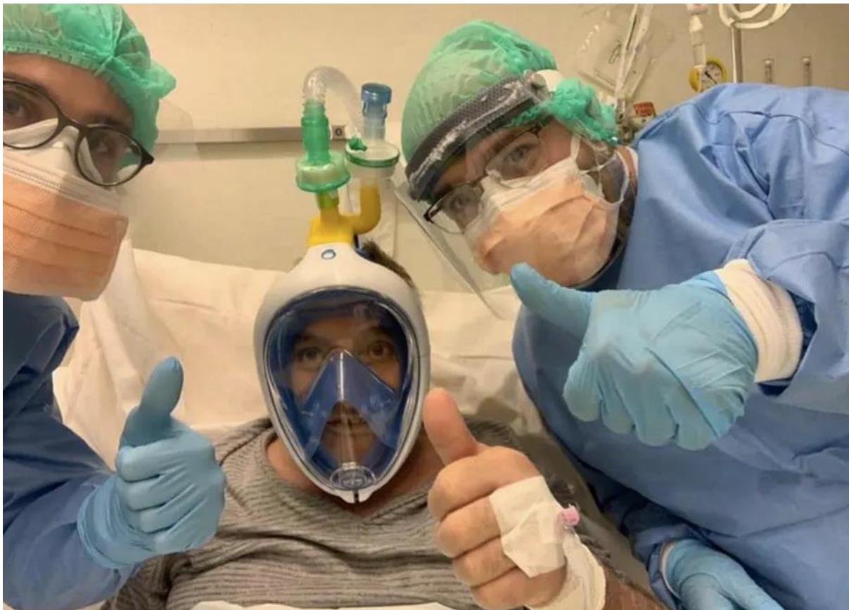
Figure 2 : Patient italien portant le masque de plongée Decathlon adapté à un respirateur.

Je pourrais également faire référence aux innovations réalisées par le CEA citées plus tôt, ou bien encore à cette entreprise de Jeans qui a arrêté sa production pour se concentrer sur la production de masques, et qui face à la petite taille de son atelier a appelé à l'aide les couturières de la région 6 .