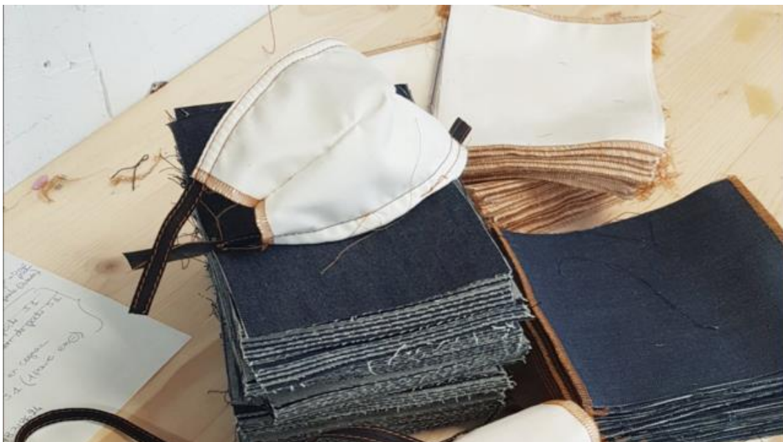
Figure 3 : Parmi les entreprises à se mobiliser, l'Atelier Tuffery s'est lancé dans la confection de protection simple.