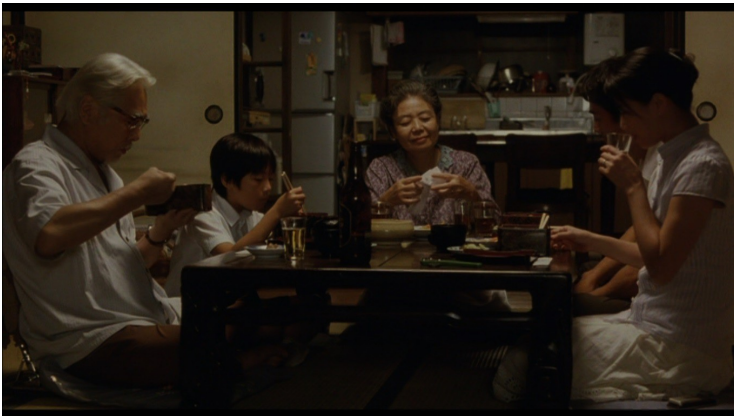
Image 7 Still Walking 1'08'49

regards vers le hors-champ du reste de la tablée. Le grand-père, au centre de l'attention, regarde sa femme et se met soudainement à manger frénétiquement. Le repas se termine dans un total changement de perspective : à aucun moment du film nous avons accès à ce point de vue sur la table, ce qui souligne le bouleversement : il s'agit d'un plan d'ensemble (donc une prise de distance par rapport aux autres plans) du point de vue de la pièce adjacente, plongée dans l'obscurité, qui se situe dans le dos du grand-père et du petit garçon (image 8). La famille est surcadrée par les murs de cette pièce et demeure silencieuse, mais à l'écoute de la chanson qui occupe tout l'espace, ce qui contraste avec la volubilité haineuse du reste du repas.