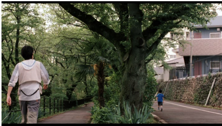
Image 26a Tel père, tel fils 1'48'26

recourent à la présence du champ matriciel de la nature pour souligner le besoin d'harmonie sous-tendant les trajectoires de leurs protagonistes. » 1 Il n'est pas anodin que Ryôta, habillé plus simplement qu'au début du film, où nous le voyons essentiellement en costume, emprunte ce tunnel végétal en forme de cuvette : le décor métaphorise aussi le cheminement intime que parcourt Ryôta après s'être rendu compte que l'essentiel, ce n'est pas forcément les liens du sang, la réussite sociale et professionnelle ou les apparences. C'est en retrouvant une certaine authenticité et une modestie, associées au décor naturel, que Ryôta résout aussi le conflit avec Keita : par exemple, alors qu'il reprochait à Keita de vouloir arrêter le piano, il lui avoue que, lui aussi, a arrêté subitement lorsqu'il était jeune.