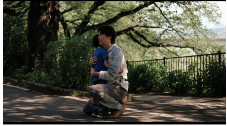
Image 26h Tel père, tel fils 1'51'23

Dans les drames familiaux d'Hirokazu Kore-Eda, la nature, bien que peu présente dans les films qui mettent en scène une ville surmoderne, attire irrémédiablement les personnages et joue un rôle fondamental dans l'équilibre psychologique et relationnel des personnages. Permettant une prise de recul et un rapport plus authentique à l'autre, la nature, comme nous l'avons vu, est souvent le cadre de réconciliations ou d'apaisement de tensions au sein des familles déchirées. Connotée positivement dans les films de Kore-Eda, elle permet aussi une dilatation de l'espace qui traduit reflétant l'état d'esprit des personnages.