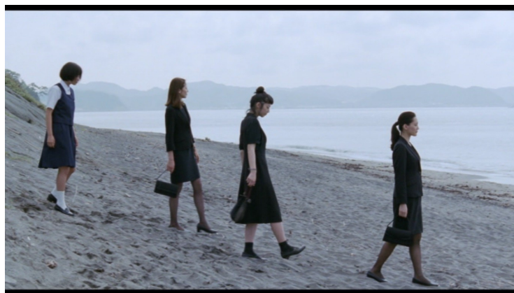
Image 27 Notre petite sœur 1'55'29

exclusivement féminine, finit par trouver un équilibre harmonieux au sein de la maison. Lors d'une petite escarmouche entre Yoshino et Sachi, Chika résume la situation à Suzu, fraîchement arrivée à Kamakura : « Elles se chamaillent, mais en cas de crise, elles font bloc. » Cet équilibre est marqué par le nombre inhabituellement élevé de plans encadrant toutes les sœurs. En effet, dans ses films, Kore-Eda utilise beaucoup de gros plans et de plans rapprochés séparant les membres des familles, signifiant bien souvent une mésentente. Mais dans ce film, peu de plans séparent les sœurs lorsqu'elles sont ensemble. La dernière scène est la plus significative de cet équilibre familial : après les funérailles de madame Ninomiya, leur bienfaitrice qui tenait aussi le restaurant où Suzu retrouve souvent son équipe de football, les quatre sœurs se rendent à la plage en habits de deuil. Leur indivisibilité se traduit par un long plan-séquence qui commence sur les quatre sœurs marchant au même rythme lent, l'une après l'autre, de profil (image 27). Au cours de ce plan, lorsqu'une des sœurs sort du cadre, comme c'est le cas de Suzu qui se rapproche de la mer ou de Chika qui joue dans l'eau, ce n'est pas pour marquer une exclusion puisqu'alors le regard et l'attention des trois autres sœurs sont dirigés vers le hors-champ dans lequel se situe la quatrième sœur. A la fin du film, les quatre sœurs s'éloignent de dos, en longeant la mer, tel un groupe indissoluble.