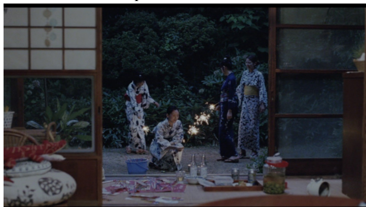
Image 29 Notre petite sœur 1'45'10

Kore-Eda, les protagonistes masculins sont souvent à l'origine des dysfonctionnements au sein des familles et qu'une architecture traditionnelle, au contact de la nature et de la culture japonaise, contribue à l'épanouissement de la famille qu'elle abrite.