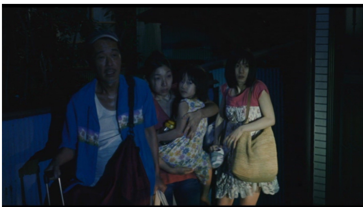
Image 8 Une affaire de famille 1'29'45