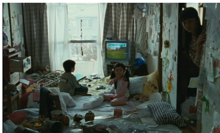
Image 14 Nobody Knows 1'20'55