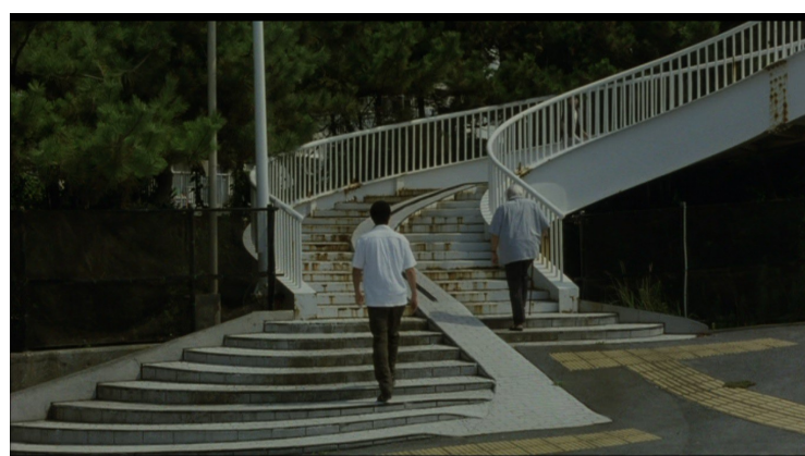
Image 24c Still Walking 1'37'11