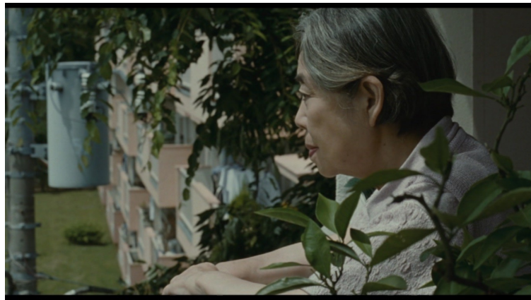
Image 12d Après la tempête 45'58