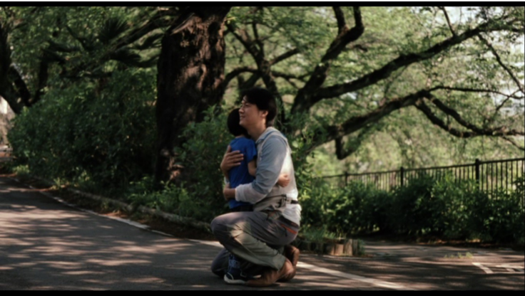
Image 26g Tel père, tel fils 1'51'05