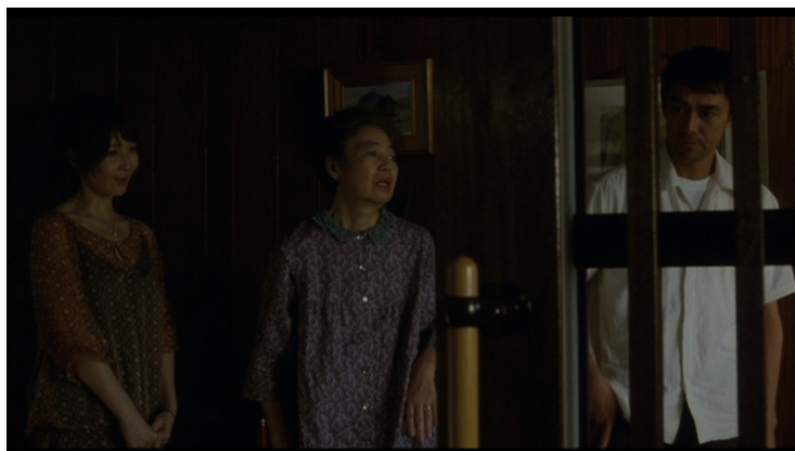
Image 10 Still Walking 58'44

(c'est-à-dire dans le hors-champ, derrière la caméra). Ryôta se retrouve donc seul en élément gênant, assis à table, immobile et silencieux. Tous ces éléments nous montrent que, pour Ryôta, la maison de ses parents est désormais loin de représenter son point d'ancrage psychologique où règne l'harmonie du groupe, son lieu-noyau vers lequel trouver refuge.