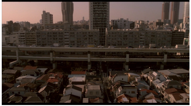
Image 3b Tokyo Sonata 52'49

Dans les ruelles du vieux quartier où déambule Nozomi, l'écoulement du temps est encore perceptible par la croissance perceptible de la végétation : des arbustes poussent le long des habitations à deux étages, les mauvaises herbes prolifèrent, discrètement sur les trottoirs, ou plus abondamment sur le muret qui sépare la rive du vieux quartier du bras de mer, face au quartier des affaires. Les traces du passé sont encore omniprésentes dans ce vieux quartier : la rouille a attaqué quelques structures métalliques, les murs sont craquelés, la peinture est écaillée sur les bancs et les poubelles en bois ont perdu leur éclat sur la pelouse jaunie où s'installe quotidiennement le vieil homme solitaire, face aux tours d'Odaiba. A l'opposé de cette rive où le temps s'écoule encore, l'autre rive, moderne, celle du quartier des affaires d'Odaiba, où les tours bouchent l'horizon, tout en menaçant les petites habitations à leurs pieds. Les traces de l'écoulement du temps se font plus rares et plus discrètes, l'acier du Rainbow Bridge se confond avec le béton des immeubles, rendant le paysage terne, gris et monotone en l'absence de végétation. Les pelouses sont trop parfaitement