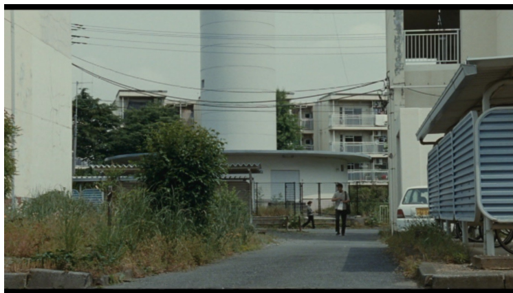
Image 14 Après la tempête 5'18

Nous constatons la même uniformité de couleurs pour Yoshiko et son appartement. Elle porte systématiquement des habits ternes, aux couleurs peu prononcées et proches de la teinte beige et jaunâtre des murs de son appartement, ce qui est particulièrement visible lorsqu'elle entre dans son appartement alors que Ryôta fouille dans ses affaires à la recherche d'un objet de valeur au