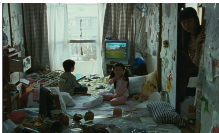
Image 14 Nobody Knows 1'20'55