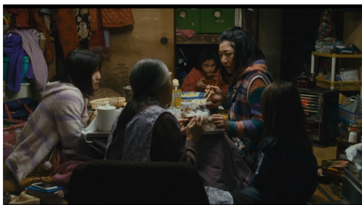
Image 5 Une affaire de famille 19'09