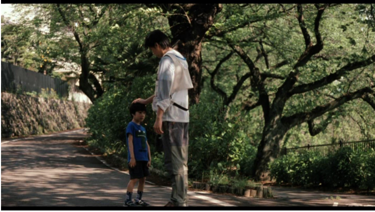
Image 26e Tel père, tel fils 1'50'51