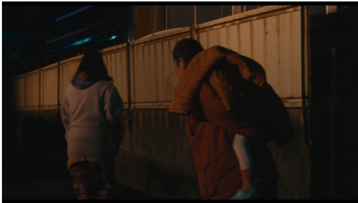
Image 18a Une affaire de famille 6'31

Juri et entendent la violente dispute de ses parents, ils s'immobilisent dans une portion de la rue éclairée par la froide lumière bleue-verte. Le contrechamp, un plan rapproché de face sur les trois personnages, montre que le reste de la rue qu'ils viennent de parcourir, en profondeur de champ, est toujours baignée de cette lumière jaune chaleureuse (image 18b). La composition de l'image par la lumière distinguent alors deux espaces : l'un d'où les protagonistes viennent, dans la profondeur de champ, métaphorique de la chaleur du foyer où a été accueillie Juri le temps d'un repas, et l'autre, qu'ils viennent d'atteindre, baignée de la lumière froide, symbolisant la brutalité de l'environnement de Juri. Le contraste entre l'ambiance chaleureuse et protectrice de la maison d'Hatsue et celle froide, dangereuse et violente de l'endroit d'où vient Juri s'exprime par l'éclairage de la scène.