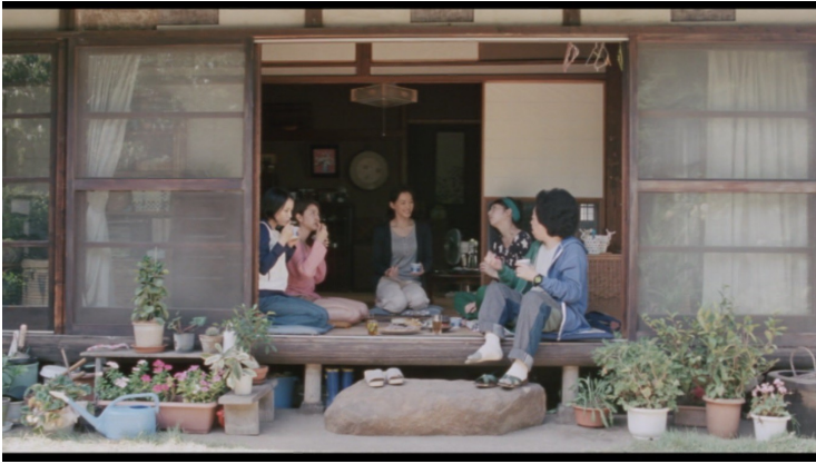
Image 28e Notre petite sœur 22 21'21