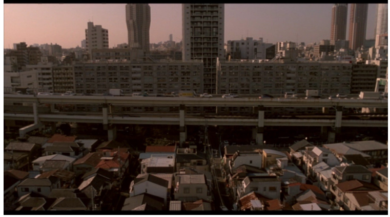
Image 3b Tokyo Sonata 52'49

Dans les ruelles du vieux quartier où déambule Nozomi, l'écoulement du temps est encore perceptible par la croissance perceptible de la végétation : des arbustes poussent le long des habitations à deux étages, les mauvaises herbes prolifèrent, discrètement sur les trottoirs, ou plus abondamment sur le muret qui sépare la rive du vieux quartier du bras de mer, face au quartier des affaires. Les traces du passé sont encore omniprésentes dans ce vieux quartier : la rouille a attaqué quelques structures métalliques, les murs sont craquelés, la peinture est écaillée sur les bancs et les poubelles en bois ont perdu leur éclat sur la pelouse jaunie où s'installe quotidiennement le vieil homme solitaire, face aux tours d'Odaiba. A l'opposé de cette rive où le temps s'écoule encore, l'autre rive, moderne, celle du quartier des affaires d'Odaiba, où les tours bouchent l'horizon, tout en menaçant les petites habitations à leurs pieds. Les traces de l'écoulement du temps se font plus rares et plus discrètes, l'acier du Rainbow Bridge se confond avec le béton des immeubles, rendant le paysage terne, gris et monotone en l'absence de végétation. Les pelouses sont trop parfaitement