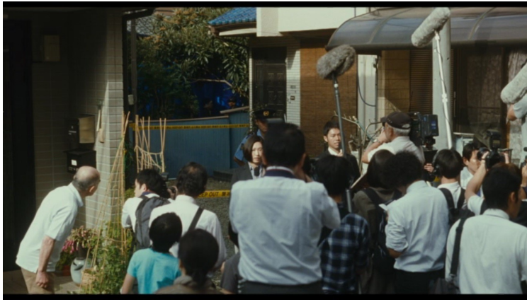
Illustration 1: Image 9 Une affaire de famille 1'34'53