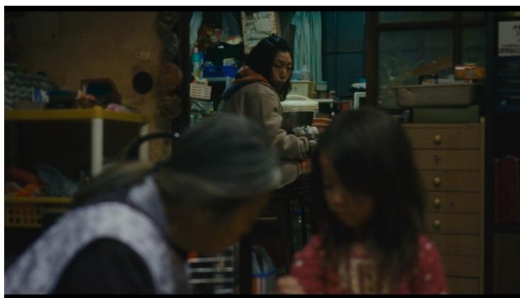
Image 19 Une affaire de famille 05'54