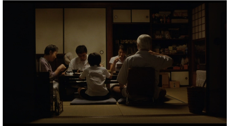
Image 8 Still Walking 1'09'46

C'est le plan suivant qui nous apprend le sous-texte de cette scène : dans un plan rapproché, de profil, le grand-père est installé, mi-allongé dans la baignoire, détendu, nu puis mis à nu par les paroles de sa femme. Nous entendons la grand-mère entrer dans la salle de bain et lui déposer des serviettes. Ils ont alors une rapide discussion au cours de laquelle, celle-ci lui révèle qu'elle a toujours su qu'il l'avait trompée lors d'un lointain été et que la chanson du repas est intimement liée à cet épisode, que tout le reste de sa vie, elle n'a jamais oublié et a pourtant « continué à marcher », à avancer, malgré cela. A aucun moment nous voyons le visage de la grand-mère. Nous l'entendons et distinguons uniquement ses mouvements à travers l'opacité de la vitre de baignoire, manifestation de cette communication devenue impossible au sein du couple. Cette séquence, climax du récit, met bien en scène un changement de situation au sein de la cellule familiale. C'est au cours de ce repas que se déverse la rancœur de toute une vie, conduisant à un renversement irrémédiable de point de vue. La mise en scène transcrit toute la tension du repas et traduit le retournement de situation au sein du couple.