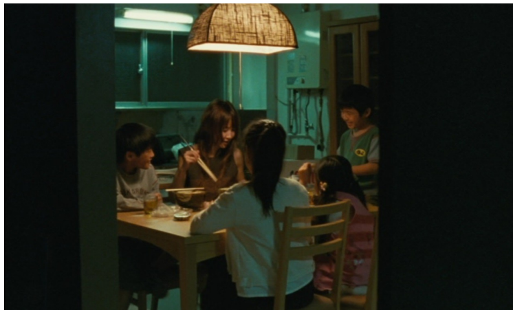
Image 1 Nobody Knows 6'49

verbale). La scène se clôt sur un plan moyen englobant la famille à table afin de souligner cette cohésion familiale qui présente néanmoins déjà des failles subtilement mises en scène par l'immersion dans la dynamique relationnelle.