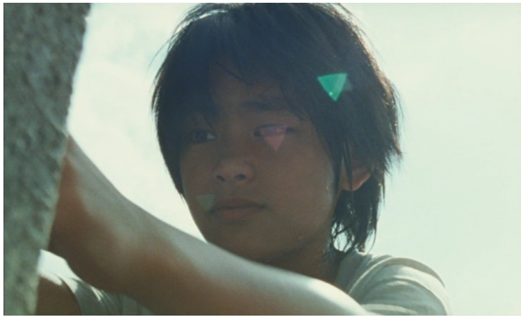
Image 5c Nobody Knows 1'31'12