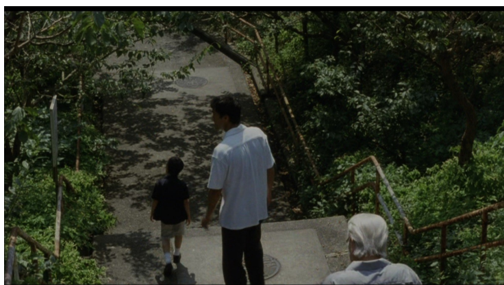
Image 24b Still Walking 1'35'39