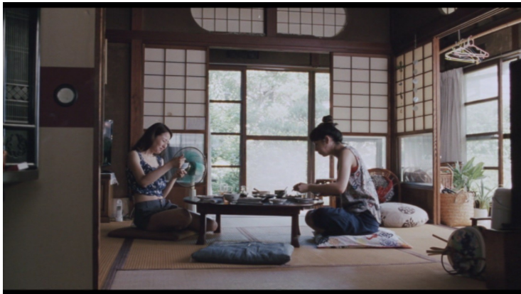
Image 28c Notre petite sœur 3'11