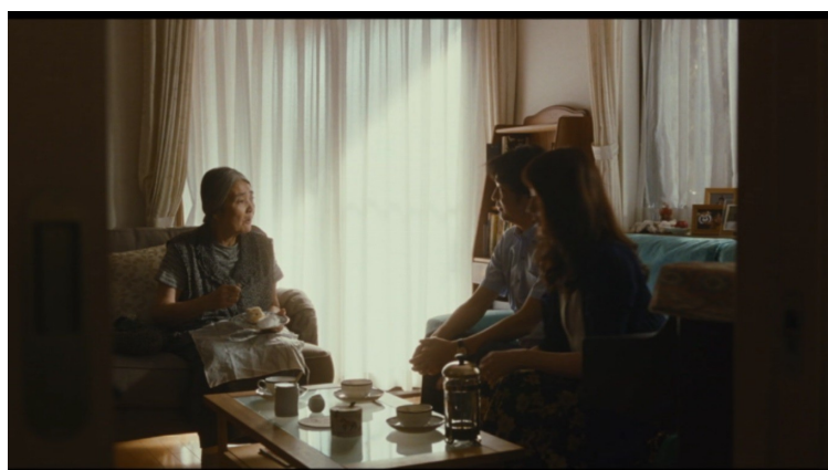
Image 16b Une affaire de famille 55'00