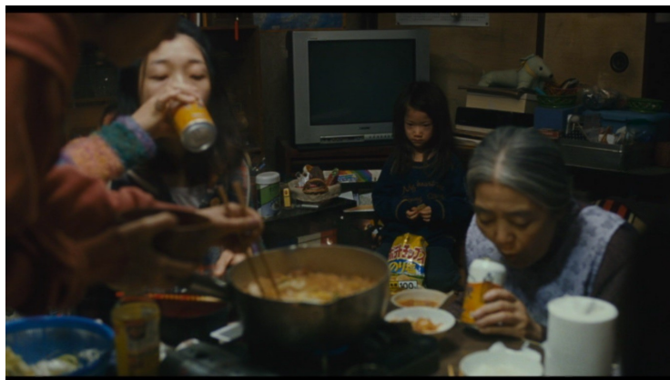
Image 4 Une affaire de famille 17'32

Cette scène s'ouvre par un plan moyen : la famille, au premier plan mais dans le flou, mange, alors que la petite est à l'arrière-plan, dans le net, mais à la marge, appuyée contre la télévision éteinte dans un coin, comme pour se faire oublier (ce qui est le cas dans un premier temps, puisque personne ne fait d'abord attention à elle) (image 4). Elle regarde cependant avec envie les membres de la famille manger. La marmite, par sa position centrale dans la pièce et dans le plan, symbolise d'une certaine manière le foyer, le noyau constitutif de la cellule familiale, autour duquel est réunie la famille au moment du repas. Cet usage du flou marque une dissociation entre l'avant-plan où la famille mange un repas chaud et appétissant autour du foyer, et l'arrière-plan, où la petite, blottie dans un coin et n'osant pas approcher l'espace convoité, grignote un paquet de chips. Lorsqu'elle devient le sujet principal de la conversation, la mise en scène l'exclue totalement du noyau familial par un plan rapproché sur Aki, qui, comme si Juri n'était pas là, dit que selon elle, il s'agit d'un enlèvement. Nobuyo, également filmée en plan rapproché, n'est pas d'accord sur le terme « enlèvement », alors que la grand-mère, en plan rapproché aussi, se demande si les parents n'ont pas signalé la disparition de la petite. C'est lorsque la conversation bifurque sur la nourriture par l'intervention de Shôta que la petite se lève en plan rapproché.