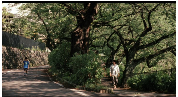
Image 26d Tel père, tel fils 1'50'35