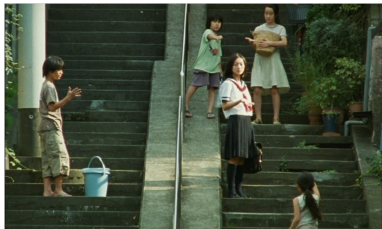
Image 7 Nobody Knows 1'33'18