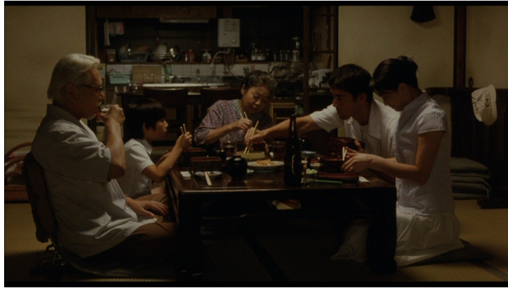
Image 6 Still Walking 1'03'56