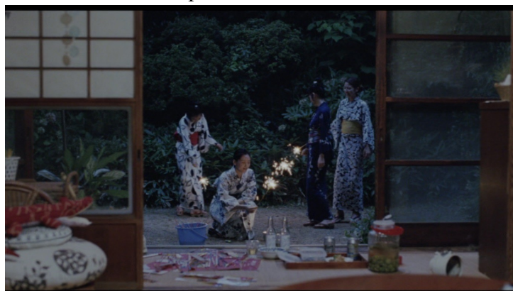
Image 29 Notre petite sœur 1'45'10

Kore-Eda, les protagonistes masculins sont souvent à l'origine des dysfonctionnements au sein des familles et qu'une architecture traditionnelle, au contact de la nature et de la culture japonaise, contribue à l'épanouissement de la famille qu'elle abrite.