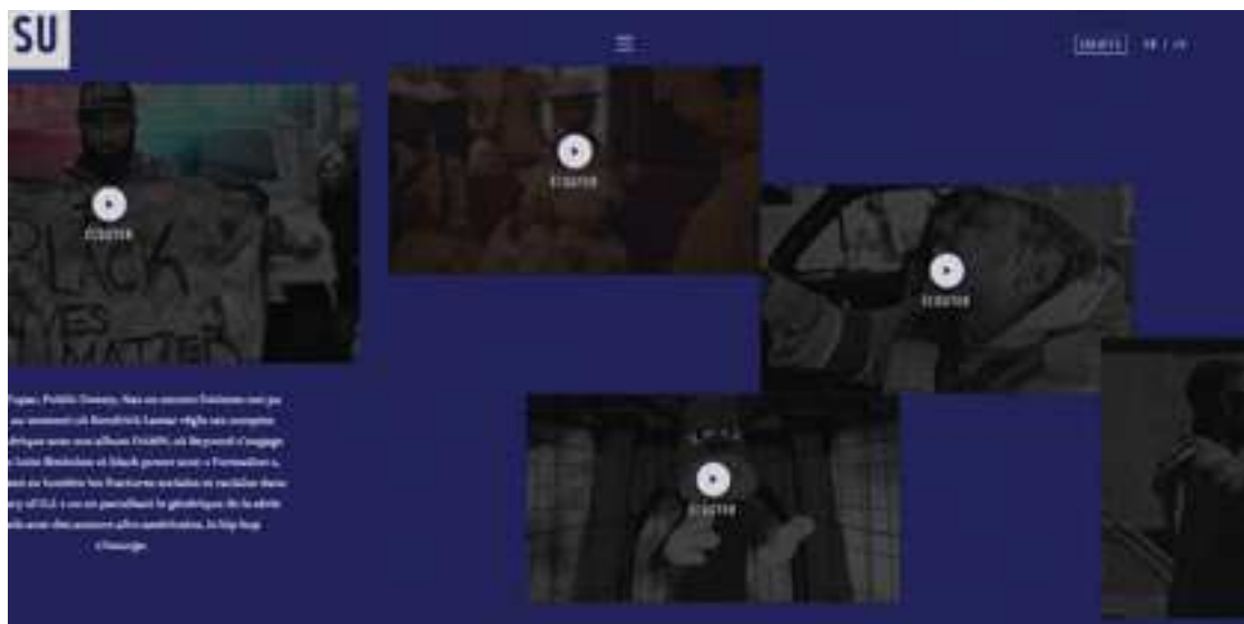
Figure 1 : capture d'écran de « Joey Bass, political MC » montrant les players qui incitent à l'écoute.

Les trois autres longforms revêtent plus un caractère d'information que de divertissement, ce qui pourrait caractériser les trois objets d'étude précédents. Toutefois, là aussi la hiérarchie entre les