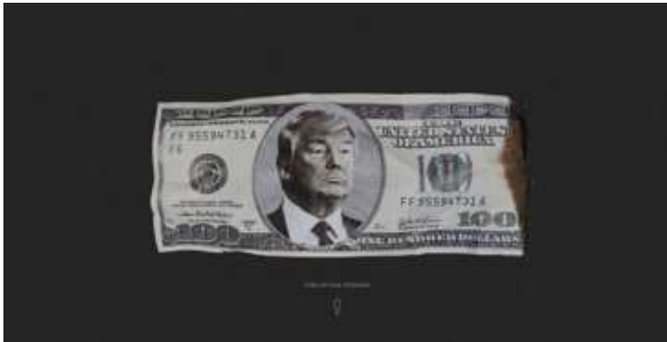
Figure 6: Capture d'écran de « Joey Badass, political MC » montrant l'incitation à scroller en bas de la page.

lecture guidée, pensée, le spectateur se retrouve plongé dans un temporalité spécifique. Il y a une temporalité propre à chaque média, alors combinée pour créer la temporalité spéciale. La théorie selon laquelle « La poésie a le temps, l'image: l'espace » change donc profondément: la poésie a le temps, les mots permettent de jouer avec le temps, mais pas autant que la mise en page, donc l'aspect visuel, et la combinaison de ces média qui créent une temporalité si particulière, et presque expérimentale. Le récit augmenté de son et d'images, c'est aussi un temps bien particulier.