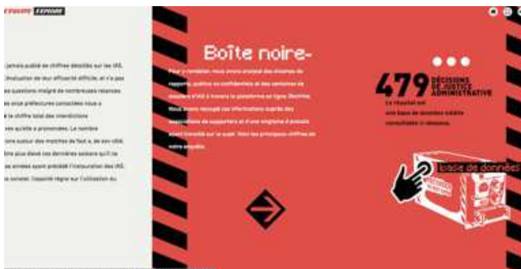
Figure 10: incitation à cliquer sur la « boîte noire » contenant une base de données, dans « IAS »

D'un autre côté, on montre aussi les éléments qui ont pu être utilisés lors de l'enquête journalistique. A l'ère des fake news et de la désinformation, la véracité des faits et les preuves apportées semblent constituer un vrai enjeu. Le journalisme, plus que jamais, se doit de justifier son travail. Grâce à internet, aux liens hypertextes et aux ressources infinies du web, il est désormais possible de mettre les preuves des faits avancés entre les mains du lecteur. De ce point de vue, le longform de L'Equipe Explore « Interdiction-Administrative-Stade » est particulièrement innovant. En plus des témoignages, des graphiques et des archives issues d'autres médias, comme le journal télévisé de TF1, L'Equipe Explore a mis à disposition du lecteur les ressources qui avaient été utilisées pour mener l'enquête, auxquelles il n'aurait absolument pas eu accès auparavant. En un clic, le lecteur se voit pouvoir télécharger un fichier, une base de données, lui permettant d'avoir accès aux informations pures. Et le mode d'apparition de ce fichier est lui-même intéressant: il est dans un google drive activé en mode « lecture seul », qui est d'habitude un document qui circulent en interne, et que l'on peut partager avec ses collaborateurs. Ainsi, le lecteur a accès à l'information pure sur le même mode de lecture que les journalistes et la rédaction d'un média, se sentant ainsi immergé dans l'enquête, et ne pouvant nier la véracité des faits avancés.