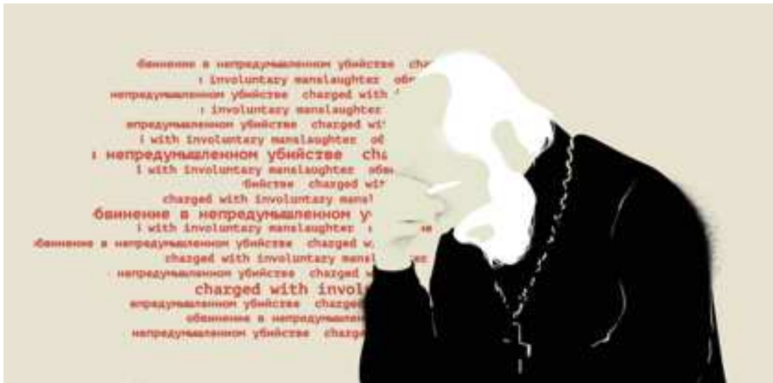
Figure 4 : Capture d'écran de l'article de Coda, montrant que les illustrations intimes montrent ici l'intériorité des intervenants.

La construction du portrait de Joey Badass par Shoes up présente un caractère particulièrement visuel. Le texte sert à raconter les éléments dans l'ordre. Mais la narration est agrémentée d'images qui, de manière traditionnelle, servent à ancrer le texte dans le réel, mais met aussi le texte à l'épreuve des documents réels. L'image n'est plus le royaume du doute, que l'on peut remettre en question, mais donne de la force aux mots et aux propos abordés. L'image fait office d'archive documentaire, tout en y ajoutant quand les directeurs artistiques trouvent cela nécessaire une dimension émotionnel qui justifie les éléments racontés dans le texte, comme la photo de la petite fille qui pleure au tribunal. Grâce aux images, les mots ont une consistance, et résonnent avec une réalité. L'image est ici fenêtre sur un monde qu'on ne soupçonne pas, vers un autre espace temps qui, bizarrement, est si proche: celui du quotidien des noirs américains d'aujourd'hui. Les vidéos et les sons, quant à eux, n'ancrent pas dans la réalité, mais dans un contexte artistique et culturel, à l'ère où les rappeurs sortent bien souvent des clips avant même de sortir des morceaux. Mais ces vidéos ont avant tout pour rôle de montrer les artistes qui ont influencé le rappeur.