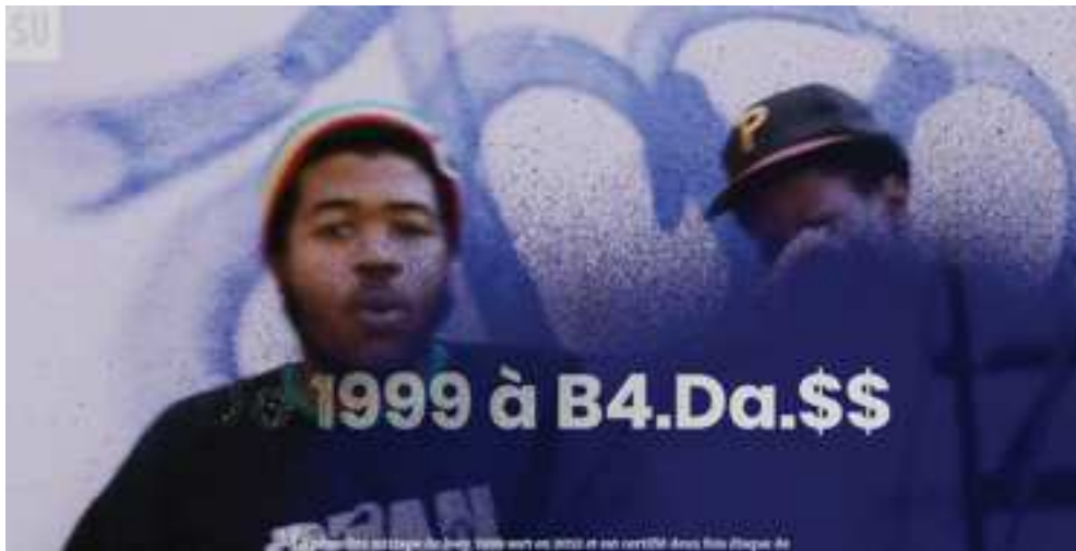
Figure 13 : Capture d'écran de l'article de Shoes Up . Un jet de peinture vient se déposer sur l'écran, faisant apparaître un titre.

Sur l'écran, par sa mise en valeur, on peut créer une poétique de l'écrit qui rend à la fois hommage au fond comme à la forme, en les faisant coexister en mettant à l'honneur ce qui leur permet d'exister à tous les deux, l'écran, support ancestral de l'écrit, de la lecture. On pense que sur l'écran, le texte n'a ni profondeur, ni espace. Malgré les possibilités des médias informatisés, le regard semble enfermé par une « fenêtre ». Mais comme le souligne une nouvelle fois Souchier, les premiers écrits se lisaient déjà sur écran, virtuel comme matériel. On montre l'écran comme une fenêtre sur laquelle des choses apparaissent. Des visages et une cartographie sur Highline , faite de sable ou de poussière d'or qui révèle des images et des mots sur l'écran, auparavant noir, comme une tempête de sable qui viendrait s'accrocher sur une surface jusque là oubliée et invisible. Du texte et des images, qui apparaissent à gauche où à droite de l'écran comme si ce n'était qu'une fenêtre sur un univers plus large qu'on ne voit que partiellement. Des mots qui passent d'un langage binaire à un alphabet lisible, comme s'ils venaient du fond de l'écran pour ensuite s'imprimer de manière lisible sur sa surface. Les signes écrits ne sont plus donnés à lire directement sur le support physique où ils sont inscrits, mais à l'écran, imaginaire de verre et de lumière. L'écran devient le support matériel d'une écriture éphémère, lieu d'accueil passager d'un écrit devenu texte nomade. 46