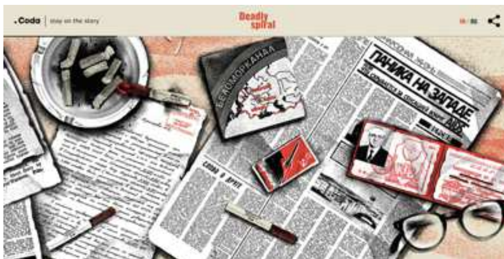
Figure 9: capture d'écran de la vue panoramique d'un bureau du KGB par Coda.

une brèche qui nous fait apparaître un moment d'histoire du journalisme soumis à un pouvoir, à un moment de la presse russe.