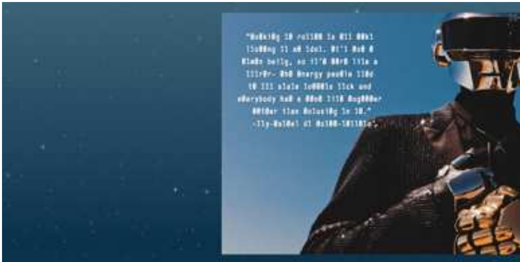
Figure 7: Capture d'écran de « Machines for life » montrant l'apparition d'une citation en écriture binaire.

Mais Pitchfork n'est pas le seul à utiliser ce type d'apparitions. Mila Leva, illustratrice de Coda , a également choisi de faire figurer la machine dans les images qu'elle a créées pour Coda . Lorsqu'une des femmes russes infectées par le virus du Sida cherche en ligne des réponses à ses questions, Mila Leva nous donne à voir ce processus de recherche en figurant sur la page des câbles, des ports USB, mais aussi la petite flèche, sur un fond rouge comme une tâche de sang. La malade est en effet à un clic des réponses sur sa maladie, raison pour laquelle il était important, semble-t-il, de figurer l'instrument de sa recherche. Il semble ici important de noter que ces choix de représentation du web et de l'ordinateur sont toujours motivés par le récit. Ces petits éléments peuvent amuser quand on les repère, mais montrent surtout l'omniprésence du média web dans nos vies quotidiennes, et se rattachent à un mode de représentation de la modernité, de l'innovation et de la vie d'aujourd'hui. Surtout, ces petits signes racontent l'histoire, beaucoup plus qu'ils ne font allusion au média. Ce n'est pas dans ces choix graphiques que se place la plus grande influence du média sur l'objet final.