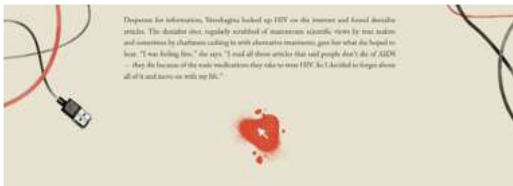
Figure 8: Capture d'écran de Coda montrant l'utilisation d'éléments qui font appel à l'imaginaire de l'ordinateur.

Mais Pitchfork n'est pas le seul à utiliser ce type d'apparitions. Mila Leva, illustratrice de Coda , a également choisi de faire figurer la machine dans les images qu'elle a créées pour Coda . Lorsqu'une des femmes russes infectées par le virus du Sida cherche en ligne des réponses à ses questions, Mila Leva nous donne à voir ce processus de recherche en figurant sur la page des câbles, des ports USB, mais aussi la petite flèche, sur un fond rouge comme une tâche de sang. La malade est en effet à un clic des réponses sur sa maladie, raison pour laquelle il était important, semble-t-il, de figurer l'instrument de sa recherche. Il semble ici important de noter que ces choix de représentation du web et de l'ordinateur sont toujours motivés par le récit. Ces petits éléments peuvent amuser quand on les repère, mais montrent surtout l'omniprésence du média web dans nos vies quotidiennes, et se rattachent à un mode de représentation de la modernité, de l'innovation et de la vie d'aujourd'hui. Surtout, ces petits signes racontent l'histoire, beaucoup plus qu'ils ne font allusion au média. Ce n'est pas dans ces choix graphiques que se place la plus grande influence du média sur l'objet final.