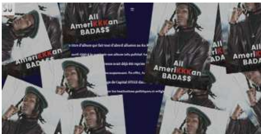
Figure 12 : Capture d'écran de l'article de Shoes Up. Des affiches viennent se coller sur l'écran.

Ici, il s'agit donc de réconcilier l'écran, sa profondeur, et ce qui est raconté. L'important semble ici de raconter conjointement grâce à une poétique établie de manière commune entre le sujet de l'article et le média. Par ce double récit, de l'écran et sur écran, c'est une double émotion, et un intérêt dédoublé chez le lecteur. C'est l'écran qui semble venir cristalliser toutes ces tentatives. Le récit d'écran devient ainsi une sorte de récit de l'écran. L'article sur Joey Badass en est le témoin: l'écran n'est jamais occulté, mais sert à mettre en valeur le récit grâce à des effets stylistiques qui le subliment. Dans ce longform , l'histoire s'écrit sur l'écran de la même manière que des tracts politiques et des slogans s'affichent sur les murs.