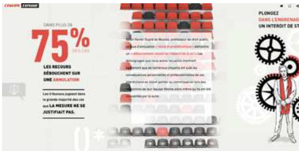
Figure 5: Capture d'écran de « IAS » permettant de voir la mise en scène de la data dans le récit journalistique.

peut alors succéder au texte pour raconter, comme en une sorte de roman graphique. Les vidéos sont elles-mêmes parfaitement intégrées au récit. Elles racontent des faits réels, vécus par les intervenants, et plus précisément encore une histoire intime, personnelle, qui donne encore plus de force au récit. Ces témoignages ont bien un statut à part, qui succède au texte, car ils ne sont pas repris en mots écrits, et ne sont donc pas dissociés de la voix et du visage de ceux qui les prononcent. Les dessins et les photos, de leur côté, semblent lier ensemble les différentes phases du récit, auquel participe également la data. Au coeur du papier qui se veut enquête exhaustive, la data est elle-même illustrée de dessins symboliques qui les replace dans leur contexte et leur domaine d'étude, et donnent des éléments concrets, encore plus réels que tout ce qui a été proposé, afin de mieux comprendre en voyant. L'enjeu est ici le suivant: voir, c'est comprendre.