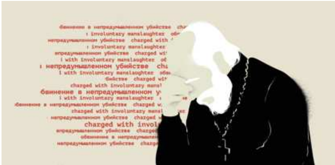
Figure 4 : Capture d'écran de l'article de Coda, montrant que les illustrations intimes montrent ici l'intériorité des intervenants.

La construction du portrait de Joey Badass par Shoes up présente un caractère particulièrement visuel. Le texte sert à raconter les éléments dans l'ordre. Mais la narration est agrémentée d'images qui, de manière traditionnelle, servent à ancrer le texte dans le réel, mais met aussi le texte à l'épreuve des documents réels. L'image n'est plus le royaume du doute, que l'on peut remettre en question, mais donne de la force aux mots et aux propos abordés. L'image fait office d'archive documentaire, tout en y ajoutant quand les directeurs artistiques trouvent cela nécessaire une dimension émotionnel qui justifie les éléments racontés dans le texte, comme la photo de la petite fille qui pleure au tribunal. Grâce aux images, les mots ont une consistance, et résonnent avec une réalité. L'image est ici fenêtre sur un monde qu'on ne soupçonne pas, vers un autre espace temps qui, bizarrement, est si proche: celui du quotidien des noirs américains d'aujourd'hui. Les vidéos et les sons, quant à eux, n'ancrent pas dans la réalité, mais dans un contexte artistique et culturel, à l'ère où les rappeurs sortent bien souvent des clips avant même de sortir des morceaux. Mais ces vidéos ont avant tout pour rôle de montrer les artistes qui ont influencé le rappeur.