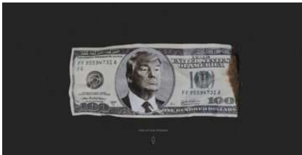
Figure 6: Capture d'écran de « Joey Badass, political MC » montrant l'incitation à scroller en bas de la page.

lecture guidée, pensée, le spectateur se retrouve plongé dans un temporalité spécifique. Il y a une temporalité propre à chaque média, alors combinée pour créer la temporalité spéciale. La théorie selon laquelle « La poésie a le temps, l'image: l'espace » change donc profondément: la poésie a le temps, les mots permettent de jouer avec le temps, mais pas autant que la mise en page, donc l'aspect visuel, et la combinaison de ces média qui créent une temporalité si particulière, et presque expérimentale. Le récit augmenté de son et d'images, c'est aussi un temps bien particulier.