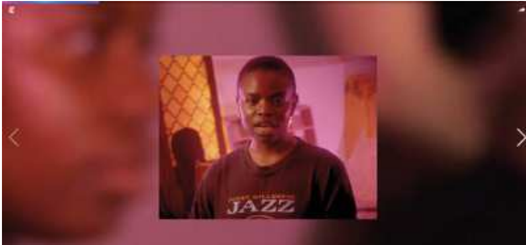
Figure 3: Capture d'écran de l'article du New York Times, montrant la mise en scène orale d'une citation.

de la clarté et de l'efficacité sans fioritures ni agréments, comme en témoigne l'écran noir sur lequel il apparaît. Enfin, les images peuvent revêtir un aspect assez subversif en délivrant un véritable discours sans paroles, l'air de rien, alors qu'il ne s'agit que d'images d'arrière plan. Les images d'ambiance deviennent alors manifestes subversifs, l'air de rien, et sont alors le medium de la revendication et du souterrain, propre aux mouvements féministes sont il est question dans le papier.