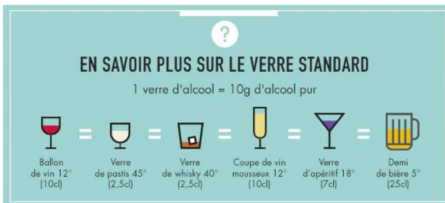
Figure 3 : La notion de verre standard ( www.alcool-info-service.fr/alcool/boissons-alcoolisees/verre-alcool )

L'usage simple sans dommage ou à moindre risque est défini comme une consommation d'alcool inférieure aux seuils de santé publique. En France, ces seuils sont de dix verres standards par semaine et pas plus de deux verres standards par jour ; avec au moins un jour dans la semaine sans aucune consommation d'alcool (5).