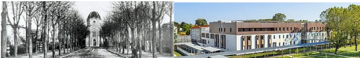
Figure 1a : La chapelle du domaine du Mas des Tours à partir duquel fut créé l'Asile de Bron.