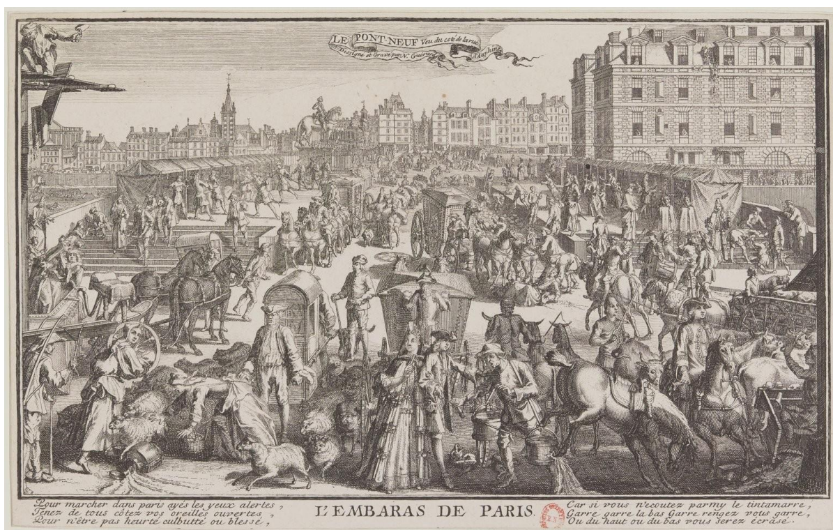
Figure 4 : « Le Pont-Neuf vu du côté de la rue d'Auphine : l'embarras de Paris »