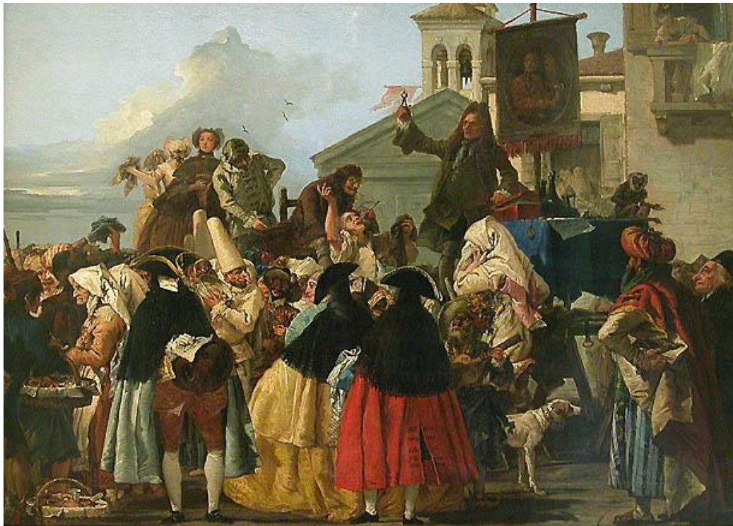
Figure 9 : Le charlatan ou l'arracheur de dents, Huile sur toile du Musée du Louvre

Source : Tiepolo (1727-1804), Le Charlatan ou l'Arracheur de dents, v. 1754-1755.