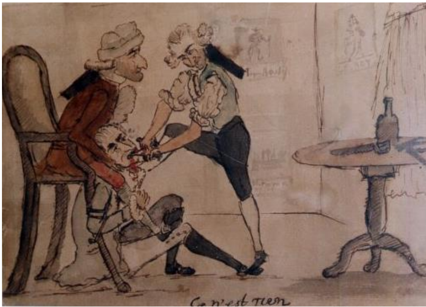
Figure 5 : Aquarelle sur trait de plume à l'encre noire, caricature d'une extraction

Source : Royal college of surgeons of Edinburgh, « Ce n'est rien », fin XVIIIe siècle.