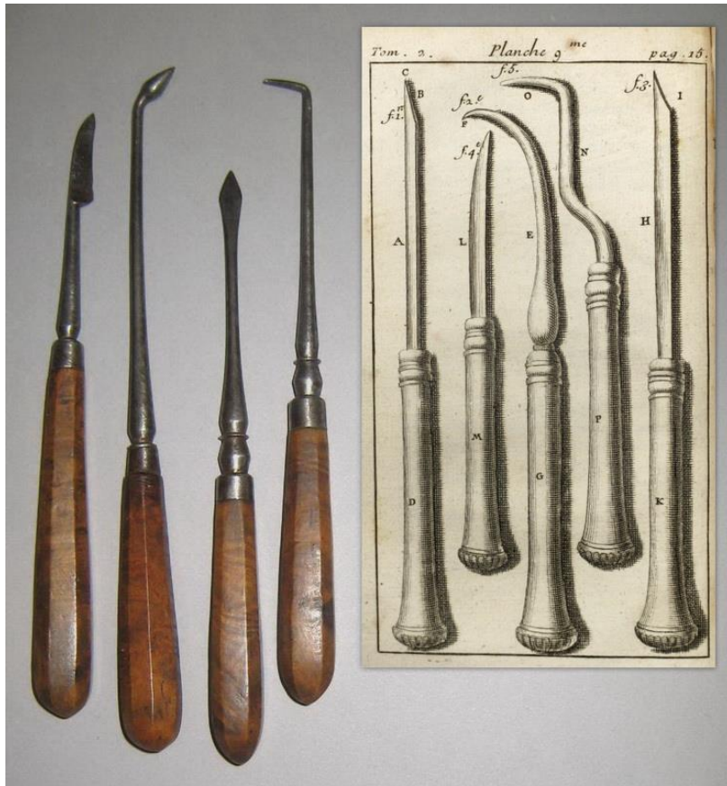
Figure 13 : Cinq instruments servant à nettoyer les dents

Source : Bibliothèque interuniversitaire de santé, Cinq instruments à nettoyer les dents, 1746.