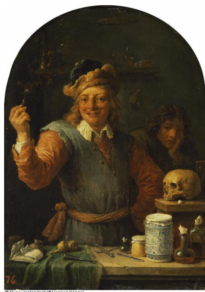
Figure 1 : Un chirurgien-dentiste, huile sur toile, Galerie des Vieux Maîtres du Musée de Cassel (Allemagne)

Source : Teniers le Jeune, Un chirurgien-dentiste, 1645-1650.