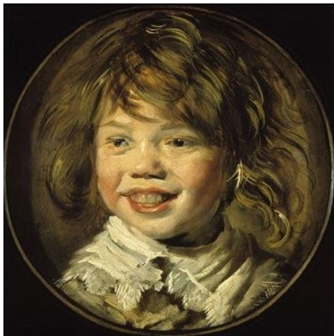
Figure 12 : Jeune garçon riant, huile sur toile, Mauritshuis, La Haye (Pays-Bas)

Source : Hals, Jeune garçon riant, 1627.