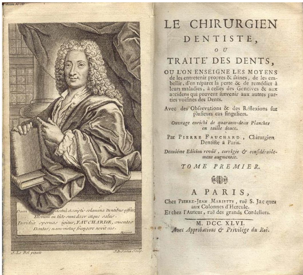
Figure 10 : Frontispice et page de titre de « Le chirurgien dentiste, ou traité des dents » de Fauchard