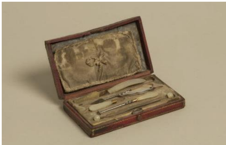
Trousse de détartrage, fin du XVIIIe siècle.