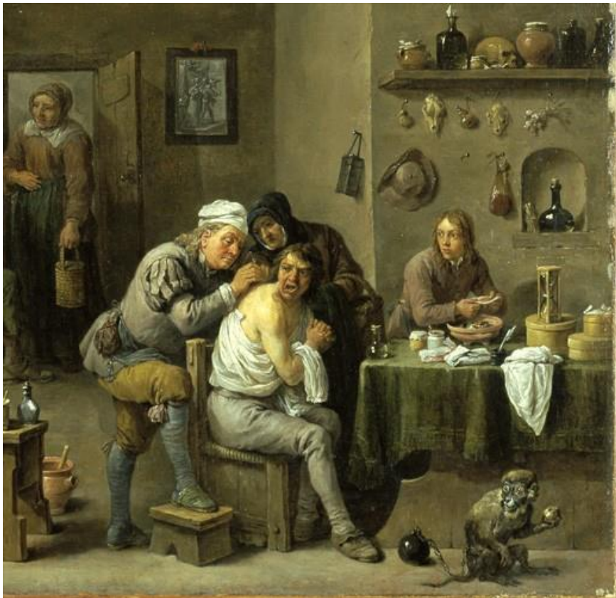
Source : Teniers le Jeune, Le chirurgien-barbier, 1670.