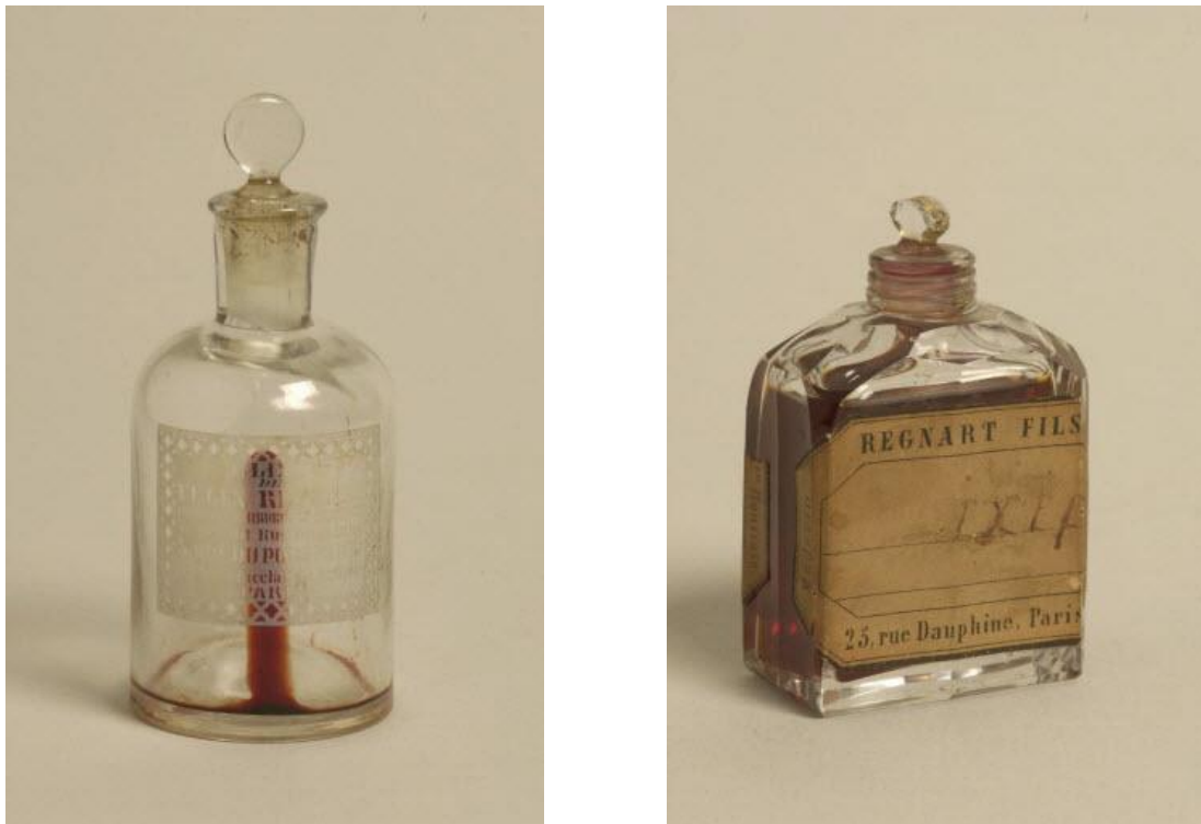
Figure 14 : Petits flacons d'élixir dentaire vendus par la maison Regnart Fils