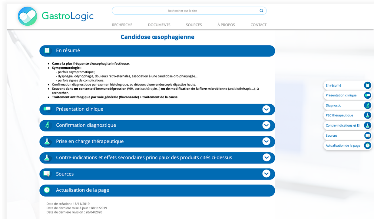
Figure 1 : Exemple de page "classique" (candidose œsophagienne)