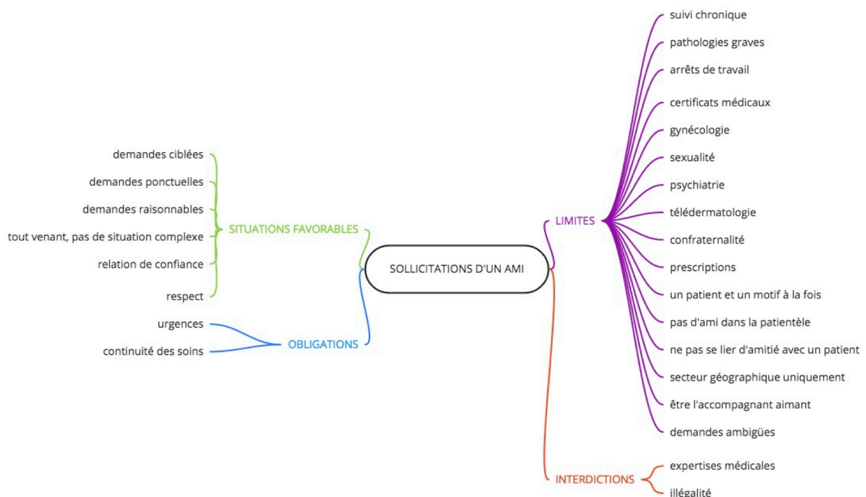
Figure 3. Carte heuristique 3 – Situations favorables et limites