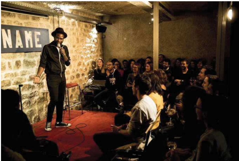
Lenny on the Paname Comedy Club's stage

2016: One More Joke . 2017: Laugh Steady Crew . 2019: Barbes Comedy Club , Madame Serfati , Premières fois , 33 Comedy , Inglorious , Bootleg Comedy Club . And in February, the Fridge is expected to open, near the “Grands Boulevards”. It has been three years comedy clubs are more and more popping up in Paris. Let's come back to one of the first ones, which opened in 2008, and is nowadays considered as a Parisian place to be. Let's come back to the Paname Art Café .