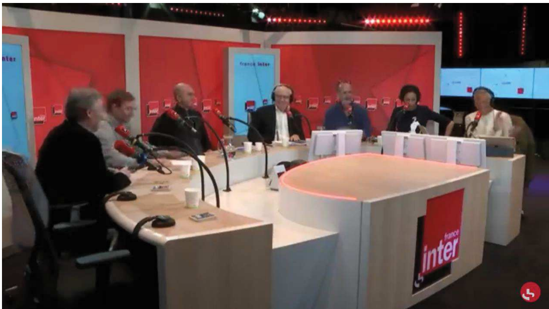
Nagui (présentateur de l'émission et celui qui mène l'interview), Leïla Kaddour-Boudadi (qui mène l'interview en personnage secondaire avec Nagui), Daniel Morin

On n'entend pas Marina Rollman pendant la première heure de l'émission (qui dure 1h15). Comme on peut le constater sur la photo ci-après (à 35 mins de l'émission) : elle n'est même pas sur le plateau.