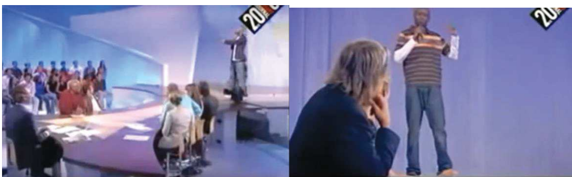
Illustration de la posture physique de Thomas Ngijol lors de ses chroniques de stand-up au Grand Journal en 2006 (gauche) et 2007 (droite).

Cette posture de tiers « importun » 65 , certains tentent de la transcender, comme ce fut par exemple le cas de Thomas Ngijol. De 2006 à 2008, ce stand-upper effectuait une chronique quotidienne dans Le Grand Journal (Canal +), mais avec une particularité : il se tenait debout, certes, mais sur table de l'émission.