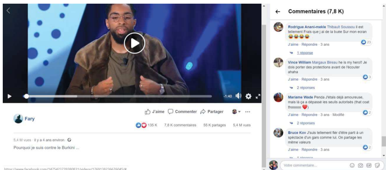
Capture d'écran illustrant le panel des réactions à la publication de la chronique par Fary sur Facebook.

Ce passage recueille de nombreux applaudissements sur le plateau, et un relai massif par les réseaux sociaux.