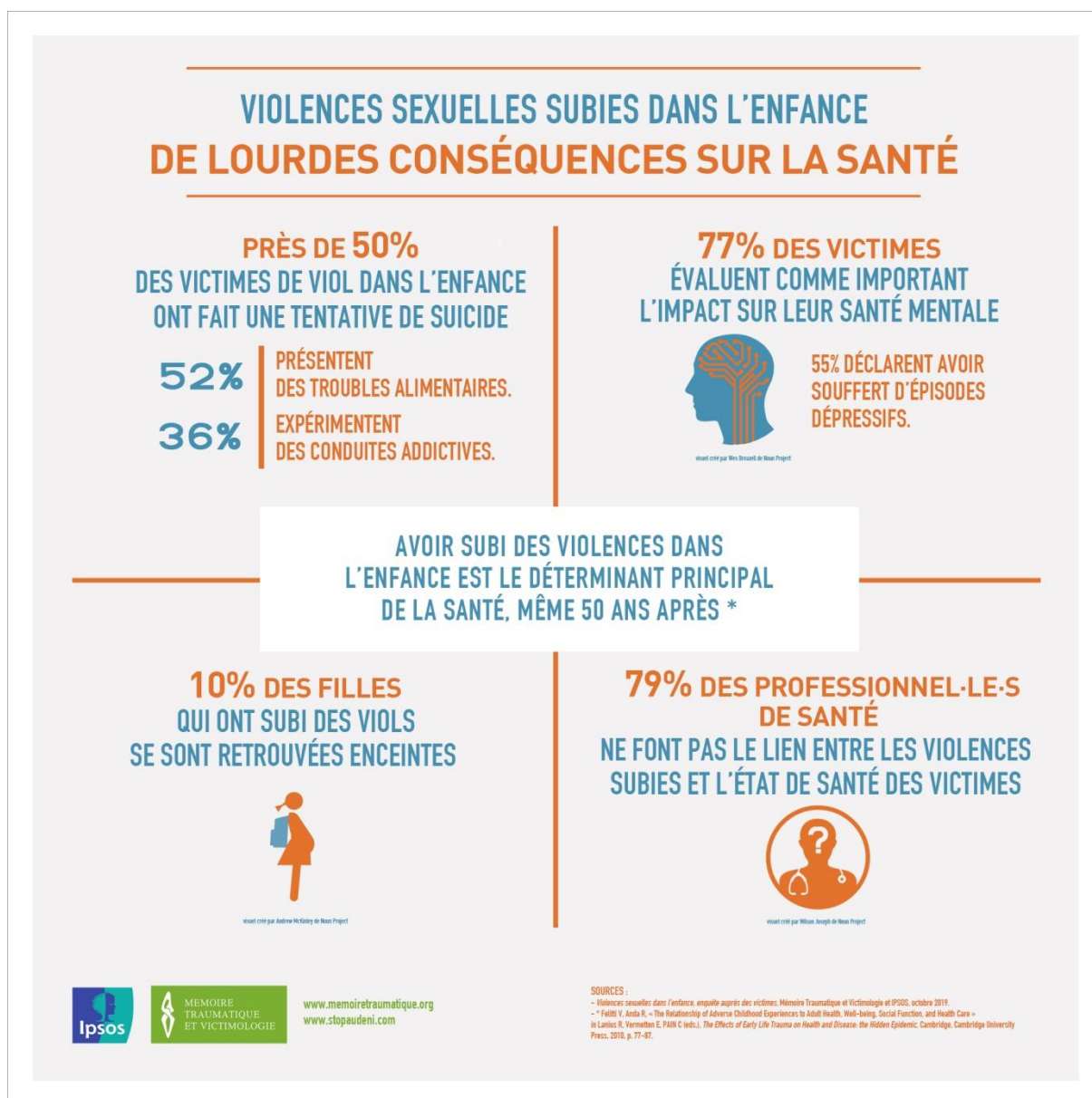
Figure 4 : Enquête IPSOS (2019)

L'enquête IPSOS citée ci-dessus retrouvera des troubles similaires :