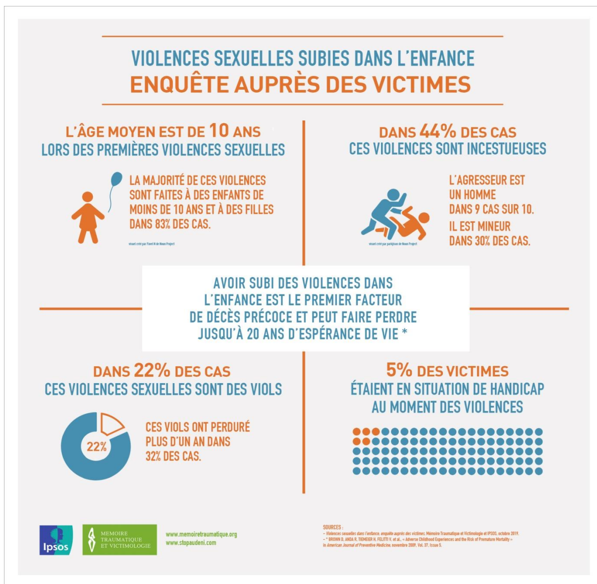
Figure 2 : Enquête IPSOS (2019)