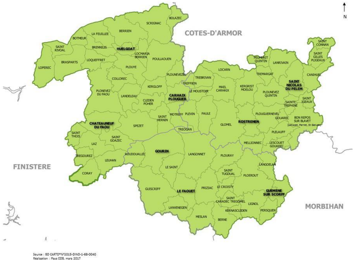
Figure 1: carte du pays COB

Ce territoire a été choisi pour sa vulnérabilité, sur le plan de la santé et de l'offre de soins. Selon un rapport de l'ARS paru en 2010, la population du pays COB présentait une mortalité générale supérieure de 22% chez les hommes et 16% chez les femmes par rapport aux moyennes françaises entre 2000 et 2006 (14). On notait une surmortalité prématurée évitable augmentée de 58% par rapport à la norme française. Celle-ci est liée à des pratiques et des comportements à risques accessibles à la prévention primaire. Par ailleurs on remarque que le pays COB présente une densité de professionnels de santé libéraux