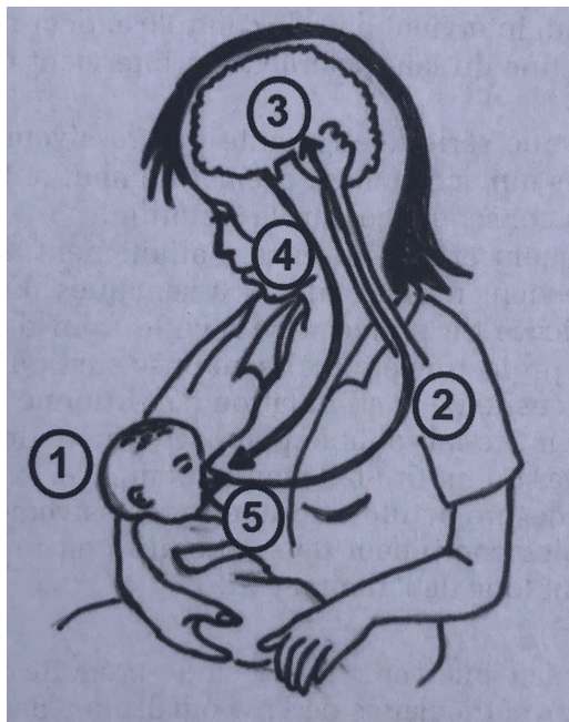
Figure n°2 : Les 5 phases d'une tétée (Geiler et Fouassier, 2013).