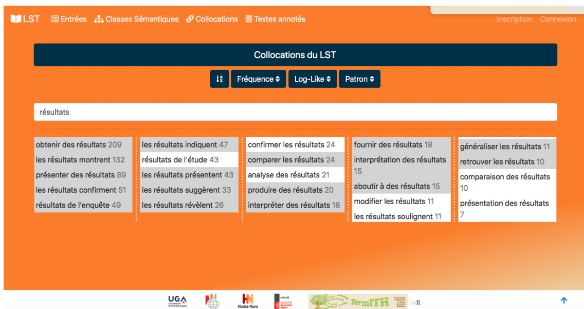
FIGURE 5.4 – Résultats des collocations contenant le mot “résultats” via la plateforme LST. À côté de chaque collocation on trouve sa fréquence en gris.

La collocation la plus fréquente associée au mot “hypothèse” est “faire une hypothèse”. Nous apercevons par la suite que ce mot, selon l’ordre en fréquence, est associé aux verbes “tester, rejeter, confirmer, avancer, formuler, émettre”. Les résultats de collocations relatives aux “résultats” et “hypothèse” sont identiques à celles trouvées dans Scientext. En ce qui concerne l’emploi d’ “expérience”, deux collocations sont seulement trouvées. La première associée au verbe “montrer” : “l’expérience montre” est déjà repérée dans Scientext et la deuxième : “décrire l’expérience”, constitue une nouveauté par rapport à ce qui a été trouvé.