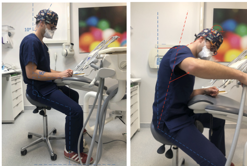
Figure 1 : Posture de travail idéale versus posture de travail néfaste.