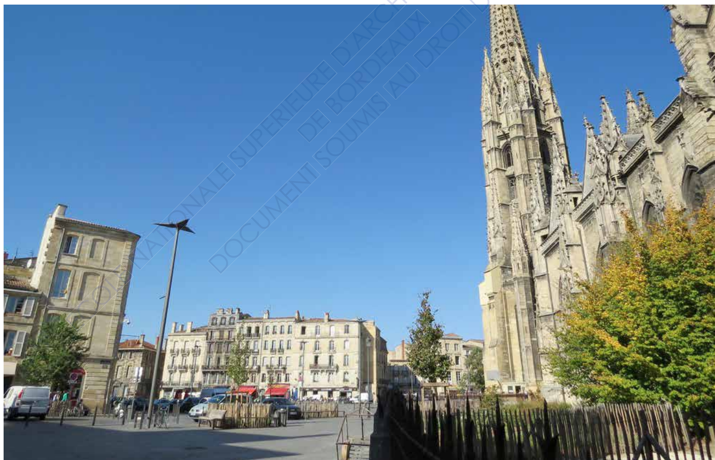
Photographie de l'espace Saint-Michel - Horizons paysages & Obras architectes

Toujours selon les enquêtes de Guy di Méo sur les représentations des femmes dans la ville de Bordeaux, Saint-Michel a longtemps été un espace de refus pour certaines femmes. Regards insistants, provocations, remarques machistes, de nombreux « rappels à l'ordre » qui font alors qu'une partie des femmes associent à cet espace le sentiment d'insécurité et de danger latent. On pourrait alors se demander si cette problématique fut prise en compte dans le processus de projet notamment dans les échanges visiblement bien pris en compte avec la population locale.