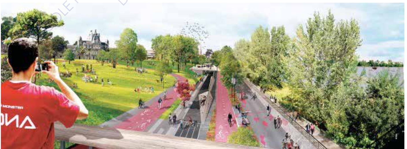
Perspectives du projet des berges de Saint-Jean Belcier - Exit Paysagistes associés