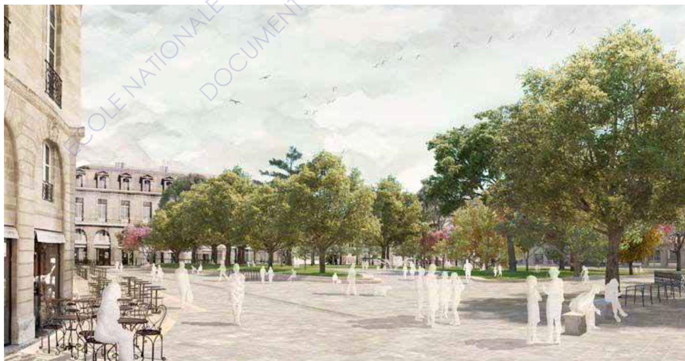
Perspective du projet de la place Gambetta - Sabine Haristoy & West8

Dans ce lieu de la ville de Bordeaux, aucun travaux n'a fait émerger une quelconque représentation négative du lieu sous l'angle du genre. D'après l'étude menée par A'Urba en 2011, Gambetta fait même partie des zones avenantes pour les femmes. La place se trouve être, pour les jeunes femmes, un point de rendez-vous comme plusieurs rotules de croisements des transports à Bordeaux. Or, lors de la présentation du projet au public le 21 novembre 2016, l'équipe de maîtrise d'oeuvre évoque le parti pris de garder « un contrôle social » sur la place et « éviter les recoins » pour que cet espace soit « plus accessible aux femmes » pour enfin ajouter « il faut que les vues soient dégagées, c'était un parti pris » (Sabine Haristoy, Maarten van de Voorde - 2016). L'ambition semble alors clairement revendiquée et pourtant contradictoire avec les témoignages livrés à propos de cet espace dans l'étude de l'A'Urba. Il apparaît alors intéressant d'analyser le discours des auteurs de ce projet à ce sujet. Cette action n'est-elle qu'une recette systématique infondée ou résulte-t-elle d'une démarche particulière ayant décelé des représentations et usages liés au genre en rapport avec la place Gambetta?