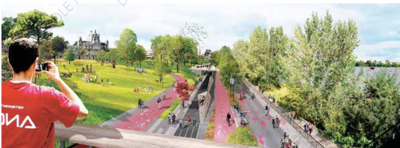
Perspectives du projet des berges de Saint-Jean Belcier - Exit Paysagistes associés