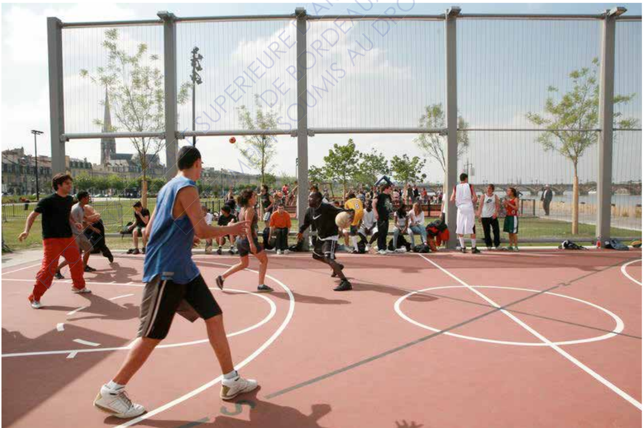
Photographie des quais des sports de Saint-Michel - Michel Corajoud & Anouk Debarre

Dans ce cas de projet déjà réalisé, il serait intéressant de savoir si, grâce au recul sur cette expérience, les concepteurs auraient envisagé une évolution de leurs pratiques vers une meilleure prise en compte de ce facteur.