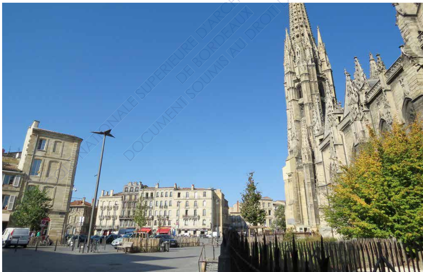
Photographie de l'espace Saint-Michel - Horizons paysages & Obras architectes

Toujours selon les enquêtes de Guy di Méo sur les représentations des femmes dans la ville de Bordeaux, Saint-Michel a longtemps été un espace de refus pour certaines femmes. Regards insistants, provocations, remarques machistes, de nombreux « rappels à l'ordre » qui font alors qu'une partie des femmes associent à cet espace le sentiment d'insécurité et de danger latent. On pourrait alors se demander si cette problématique fut prise en compte dans le processus de projet notamment dans les échanges visiblement bien pris en compte avec la population locale.