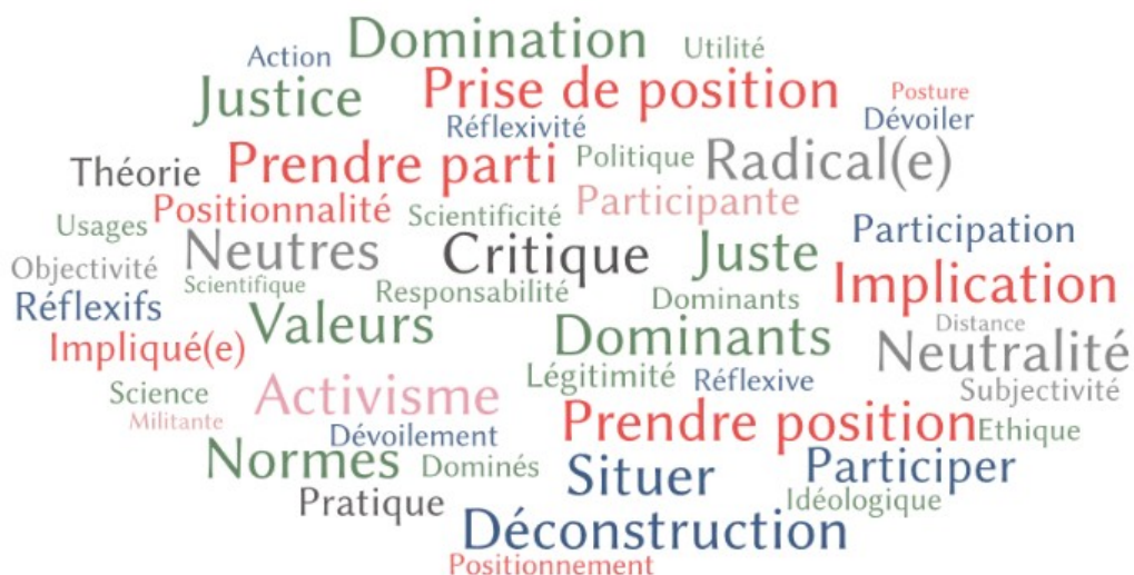
Figure 2: Termes, notions, expressions pensés avec l'engagement

I.A.1 : Proposition d'un lexique commun : avec quels différents termes les géographes sociaux.ales et critiques pensent-iels leurs rapports à l'engagement ?