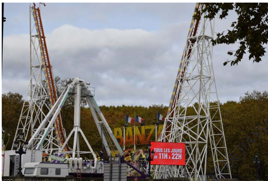
attraction du Banzai, foire aux plaisirs de Bordeaux, 2020

Il existe cependant d'autres fêtes foraines où l'intégration, ou plutôt l'inclusion du paysage de la fête foraine se lit d'une manière beaucoup plus brutale dans l'espace.