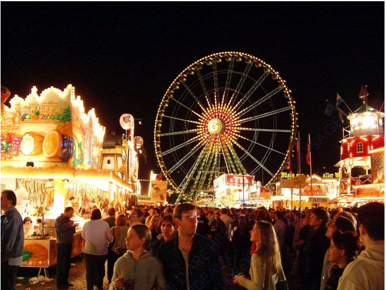
Photographie amateur de Rainer Driesen, fête foraine de Düsseldorf, Allemagne, 2002

Cette photographie a été prise à hauteur d'homme, légèrement en surplomb de la foule et durant un moment nocturne. Au premier plan on observe des visiteurs et la foule, au second plan des baraques et des attractions et au troisième plan la grande roue.