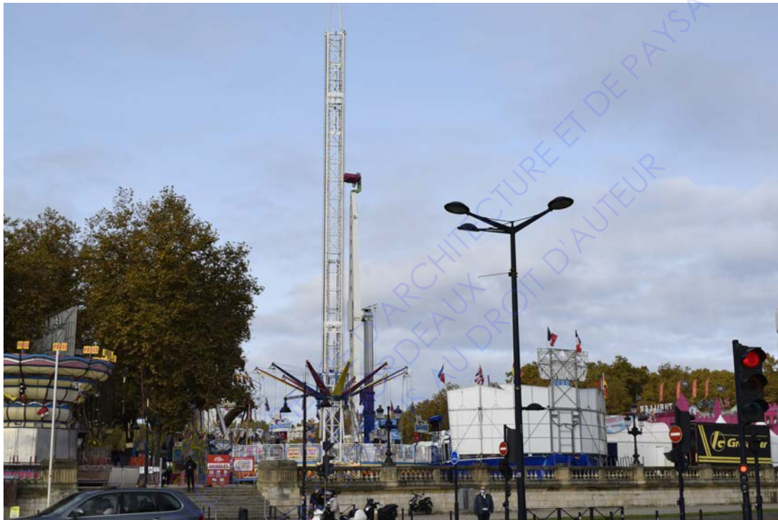
vue depuis les quais, foire aux plaisirs de Bordeaux, 2020

Lorsqu'on se situe à l'extérieur de la fête foraine et que l'on expérimente le lieu à partir du contexte urbain, la lecture de ce paysage dépend bien de la mobilité, la dynamique des attractions, et de la tombée de la nuit qui amène cet artifice lumineux si opposé à l'assombrissement soudain de la ville.