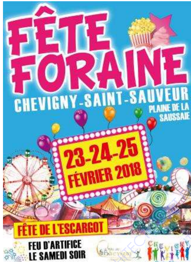
Affiche publicitaire de la fête foraine de Chevigny-Saint-Sauveur, 2018

Cette affiche publicitaire a été réalisée à l'aide de logiciels informatiques de graphisme.