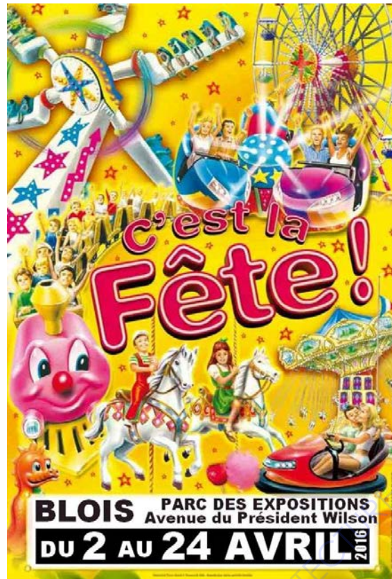
Affiche publicitaire de la fête foraine de Blois, 2016

Cette affiche publicitaire est également comme la précédente une production informatique à l'aide de logiciels de graphisme.