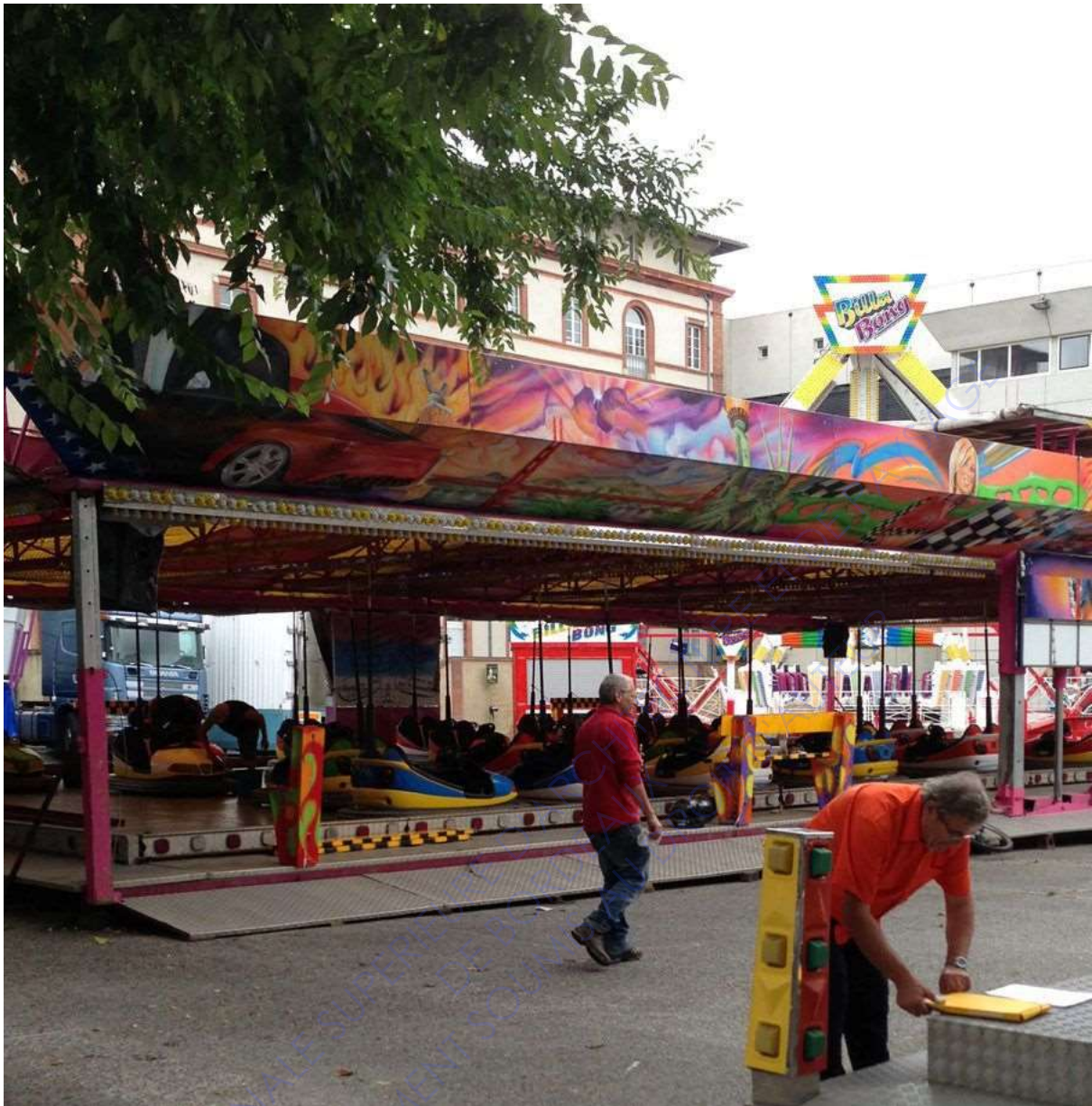
fête foraine de Pamiers, 2013

Sur cette photographie figure un homme penché sur un dossier au premier plan, il s'appuie à la structure d'une attraction. Au second plan un homme marche, derrière lui se trouve un circuit d'auto-tamponneuses. Au dernier plan s'entremêlent structures de fer et autres attractions, il est difficile de différencier les éléments.