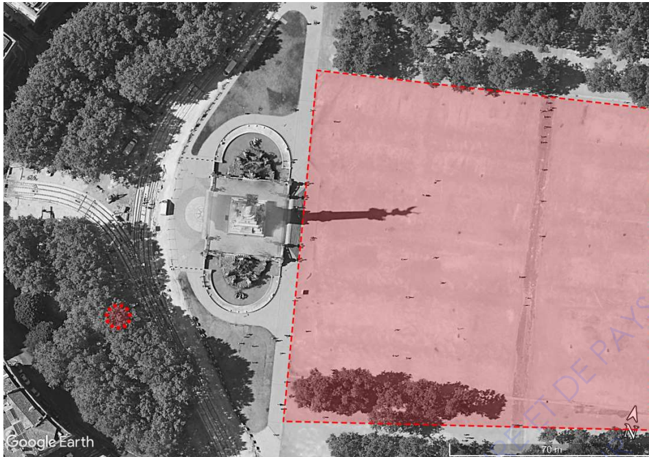
Photographie aérienne de la place des Quinconces