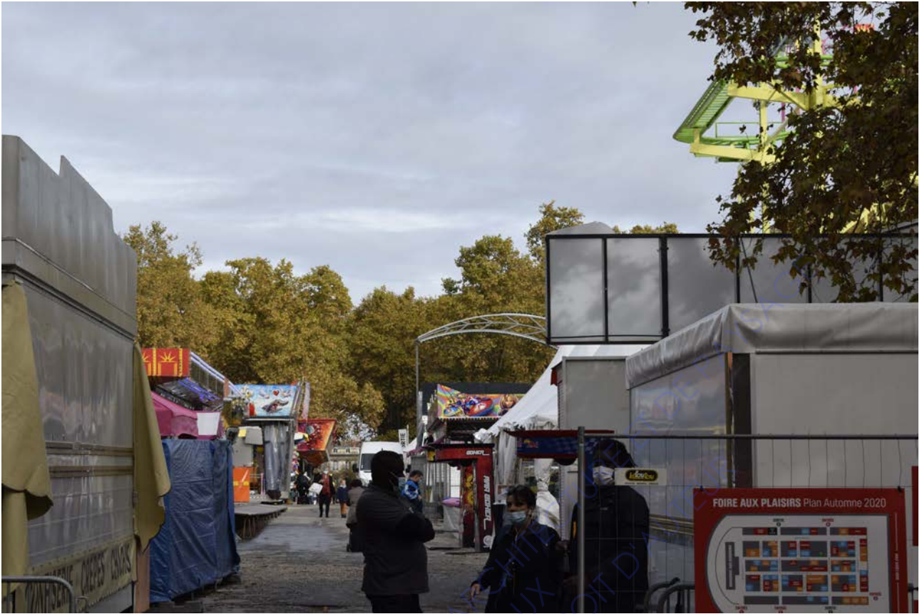
Foire aux plaisirs, Bordeaux, 2020

Devant une des entrées de la foire aux plaisirs, s'étire une allée qui traverse sur toute la largeur la fête foraine. On aperçoit au loin dans une minuscule percée un bâtiment de l'architecture traditionnelle. C'est le seul élément visuel faisant référence au contexte urbain. Nul autre objet ne peut l'identifier. Les arbres très volumineux camouflent complètement l'horizon, et tous les éléments visibles au premier et second plan font référence à l'architecture éphémère de la fête foraine avec les bâches, les devantures peintes, les marches des attractions en acier léger.