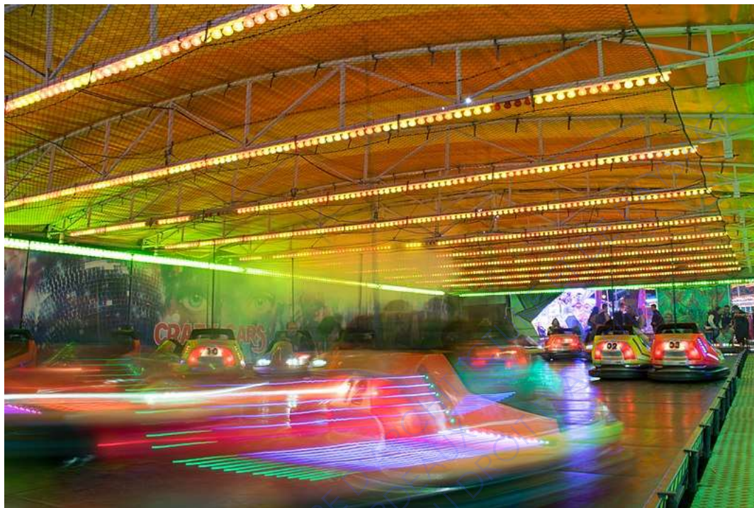
Photographie amateur de Jules Xénard, à la fête foraine de Rambouillet, 2018

de la ville sont des thèmes récurrents dans mon travail. Cette série considère la fête foraine comme métaphore de la ville. Le regard posé sur les percolations entre un univers fantasmé en marge des territoires urbains et l'aube d'une forêt vient compléter un tableau de paysages hybrides que j'explore depuis plus de dix ans. » Cyrille Weiner rejoindrait-il Michel Foucault sur ses hétérotopies d'illusion ? Ce paysage éblouissant serai-il un rêve urbain que seule la forêt nous rappelle qu'il n'est qu'imaginaire ?