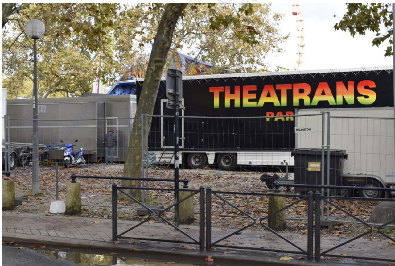
Photographie personnelle, foire aux plaisirs de Bordeaux, 2020

Ces espaces, à la fois vides, à la fois pleins, révèlent un néant, là où devrait se former le lien entre la cité et la foire aux plaisirs.