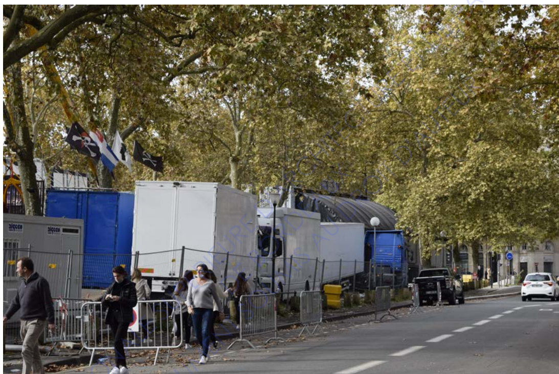
Photographie personnelle, foire aux plaisirs, Bordeaux, 2020

Au troisième plan on devine la grande roue, cependant elle reste trop faible dans le cadre pour avoir une importance dans la lecture de l'image.