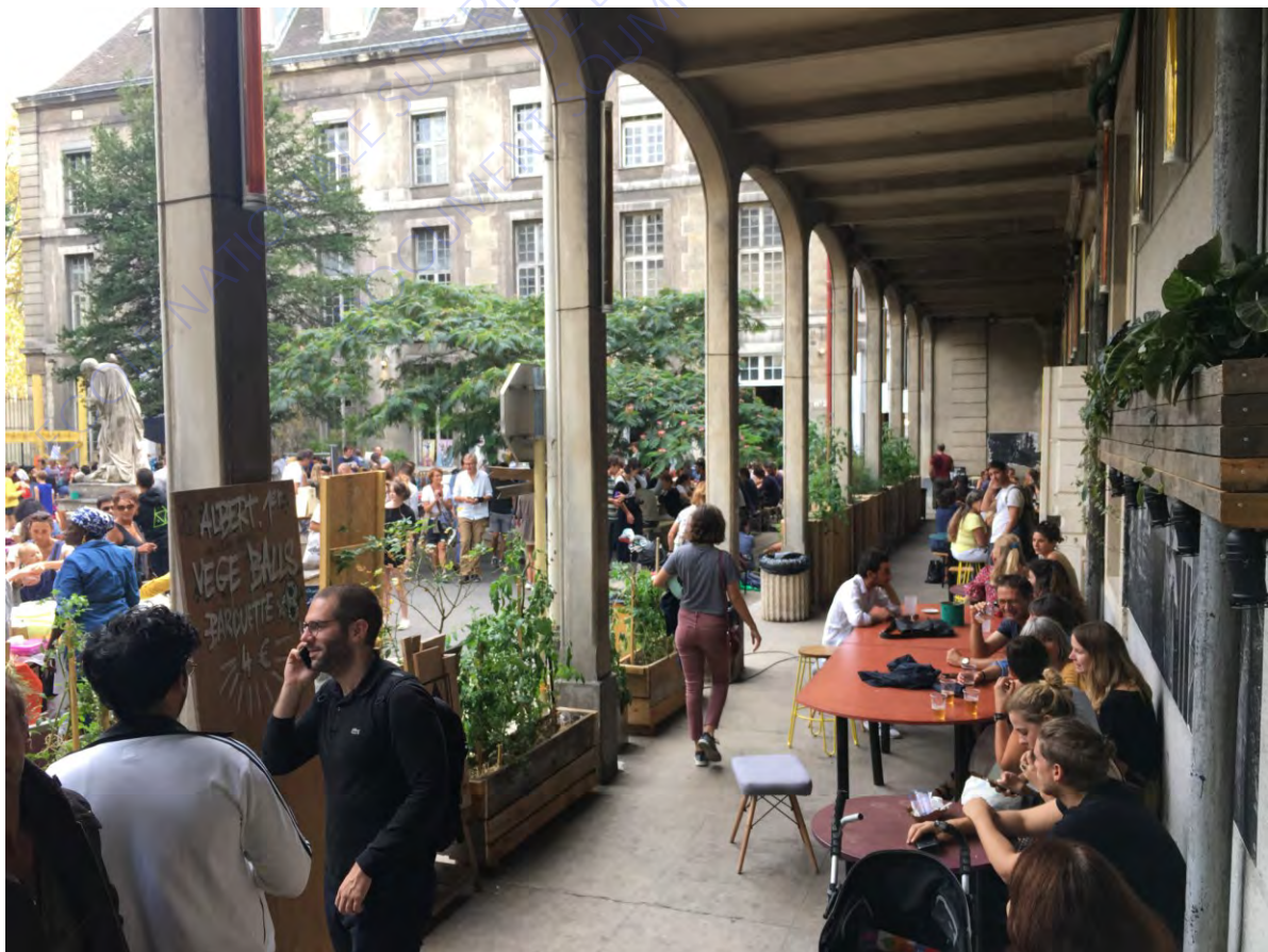
La cours principale des Grands Voisins (le 26/08/2018)