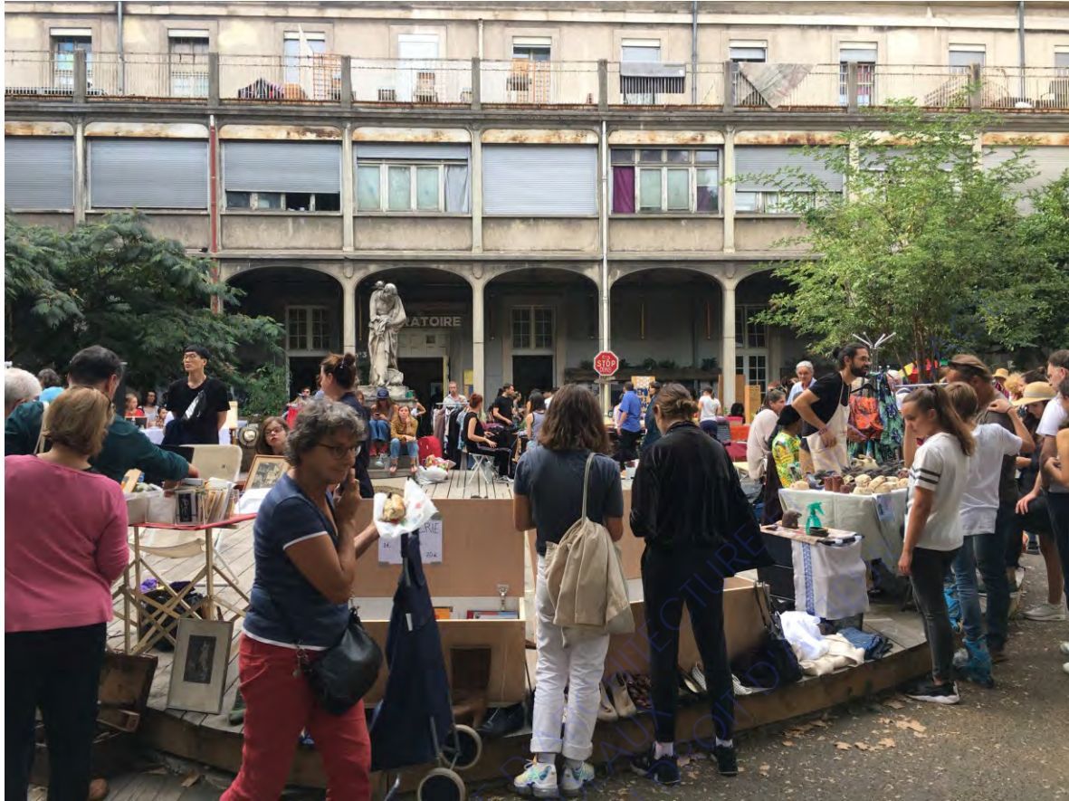
La cours principale des Grands Voisins (le 26/08/2018)