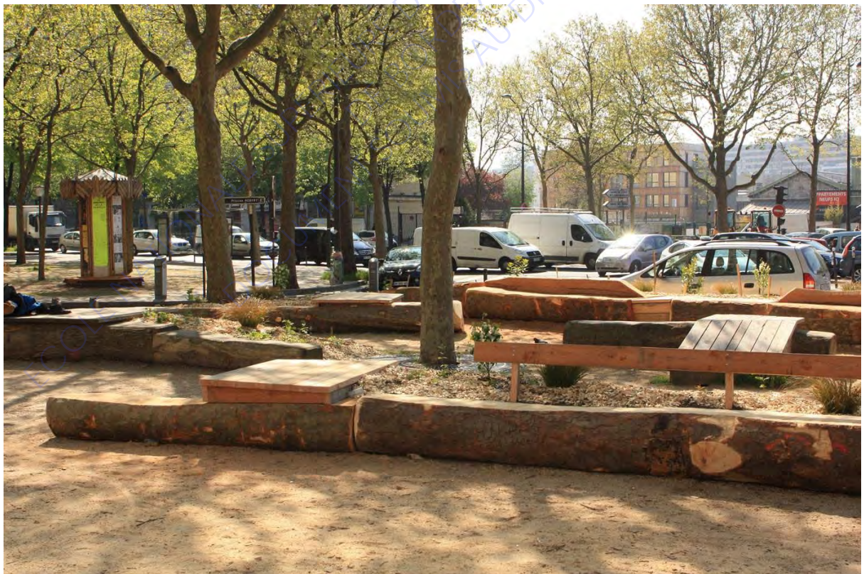
Projet du Rond point à Paris.

Ce projet dans le 18 e arrondissement de Paris visait à accompagner les habitants et les acteurs locaux du quartier de la Chapelle (XVIII e ) à l'émergence d'un projet d'aménagement du Rond Point de la Chapelle. L'objectif était de répondre à une demande exprimée depuis de