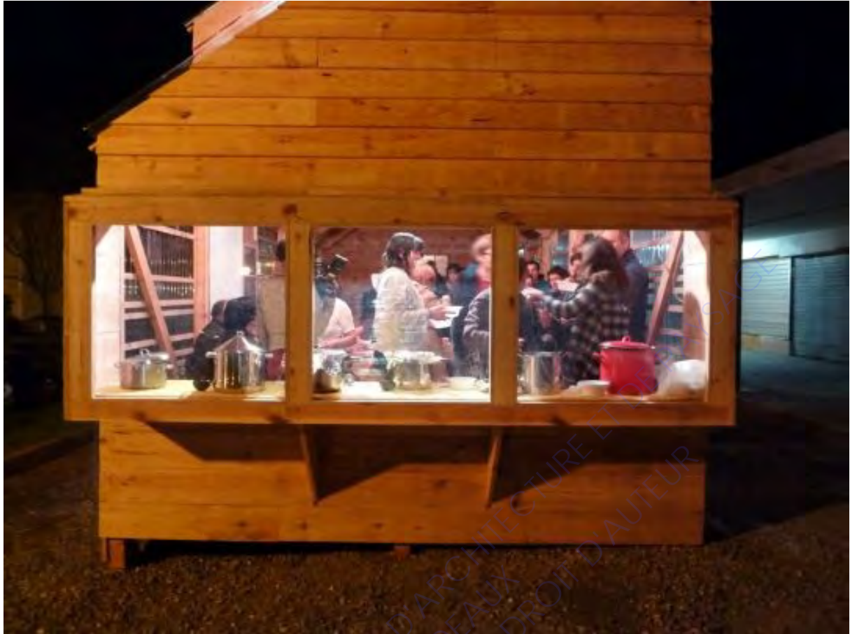
Le cabanon Cuyès (Dax) soirée « battle de soupes » (source : http://www.bruitdufrigo.com/index.php?id=341 )

« Cependant il ne s'agit pas seulement d'une construction technique. S'il fallait seulement créer un espace pour réunir les gens, on aurait loué un chapiteau. Là on s'est dit qu'on allait construire un bel objet. Il faut que les gens en soient fiers, qu'ils se l'approprient et que l'objet suscite la curiosité pour que les gens aient envie d'y venir. Dès le moment de la construction, les gens posent des questions sur le projet. C'est en construisant le cabanon « Cuyès » qu'on explique ce qu'on vient faire. Ce sont les conditions que l'on crée qui permettent à chacun de se dire « Qu'est-ce que c'est que ce truc ? Je suis curieux, je vais aller voir, ça m'intéresse... ». Si tu prends les gens frontalement en disant : venez participer à une réunion pour penser l'avenir de votre quartier, tu fais fuir tout le monde. » (Yvan Detraz, Bruit du Frigo).