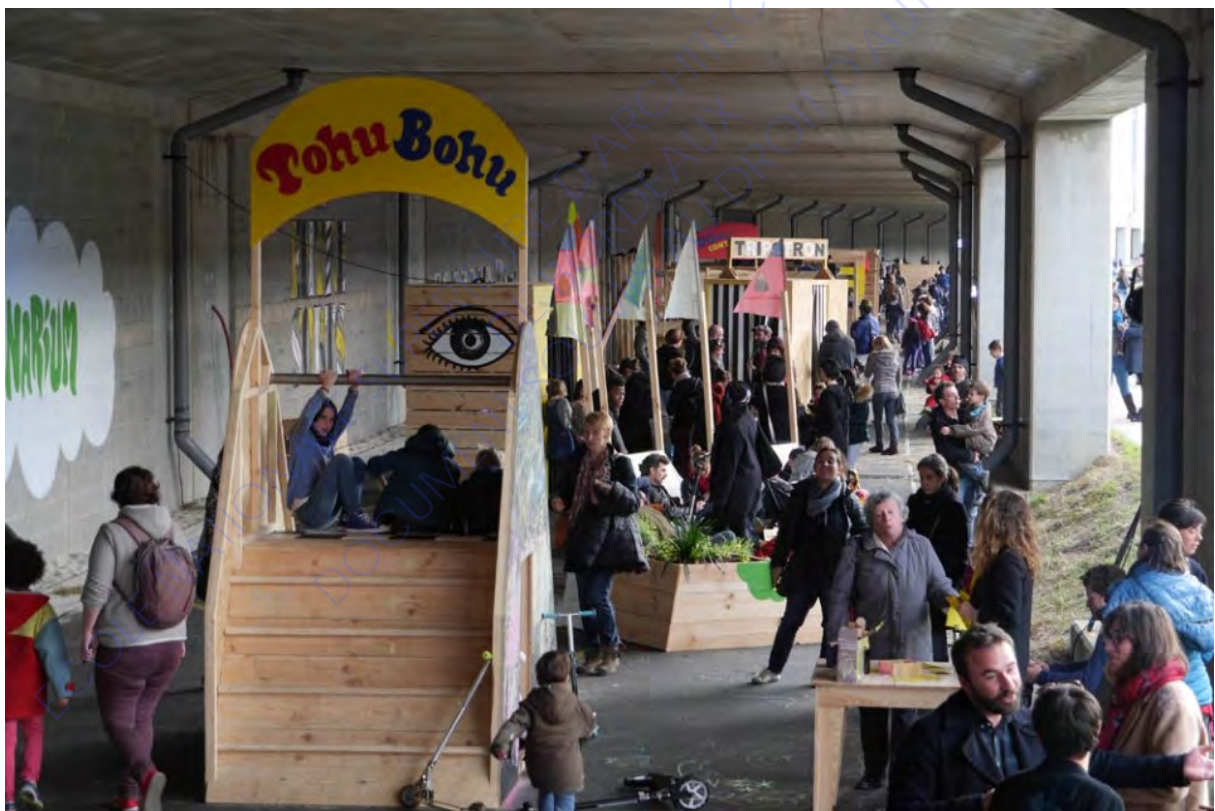
Le Tube

« Les situations spatiales (de la collaboration) sont toutes liées au temps en ce qu'il a de plus précaire. Elles ont des temporalités relativement courtes. La durabilité de l'architecture n'est pas une préoccupation majeure de leurs promoteurs. Par contre, la dynamique des rapports humains et les ambitions que les aménagements spatiaux ont su susciter au sein de la communauté locale qui les a accueillis, peut offrir un intérêt plus pérenne par delà les installations architecturales vouées à disparaître. De ce fait on parle d'urbanisme temporaire. » 18 (Enrico Chapel 2018, p.12). Le caractère temporaire des projets est assumé et revendiqué par les collectifs et permet qu'avec peu de moyens une grande énergie soit déployée.