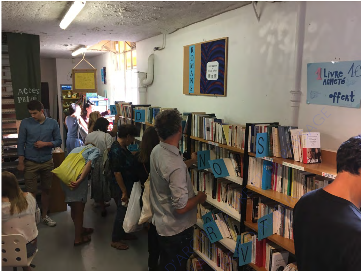
La librairie des grands voisins (le 26/08/2018)

Ainsi, l'évaluation des projets est une condition pour leur futur. Si l'évaluation se fait sur une valeur culturelle, alors les librairies participatives sont un atout à exposer. L'ensemble des projets d'urbanisme transitoire aujourd'hui, qu'ils aient acquis une certaine notoriété ou non, sont des tests. Ils sont observés, surveillés par la maîtrise d'ouvrage et les opérateurs urbains. Comme les projets des opérateurs, les projets des collectifs paraîtront alors aussi légitimes et rentables à la maîtrise d'ouvrage.