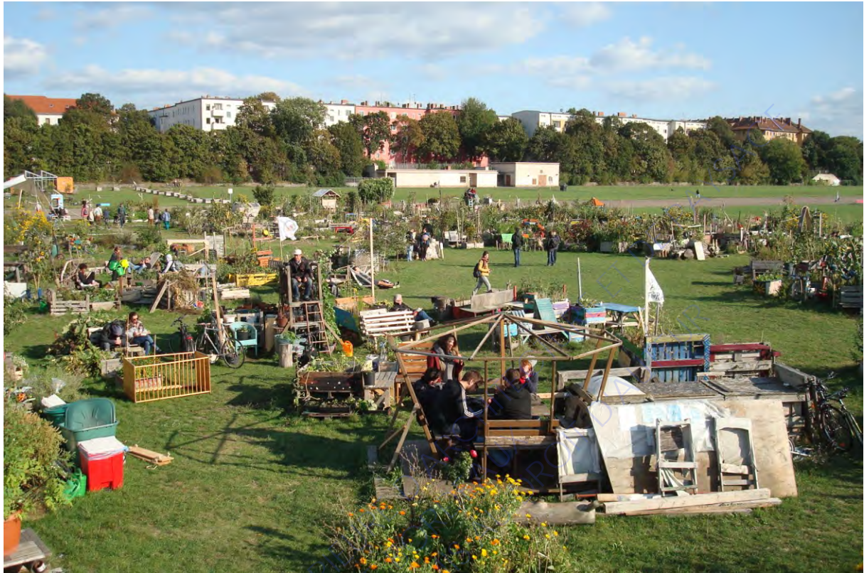
Les jardins partagés du parc de Tempelhoff, Berlin, Allemagne. (Le 27/03/2015)

spécifiques en la matière. Ainsi, elles ont progressivement appris à argumenter en s'appuyant sur des connaissances précises du sujet. » 9 (Habermann-Niesse, 2012, p. 80). Ce phénomène allemand montre que la société civile a le potentiel de monter en compétences sur des sujets et de remettre en cause le statut des experts urbains.