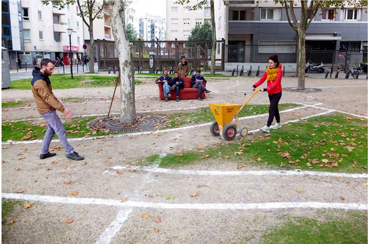
Projet du Rond point à Paris. L'échelle 1/1