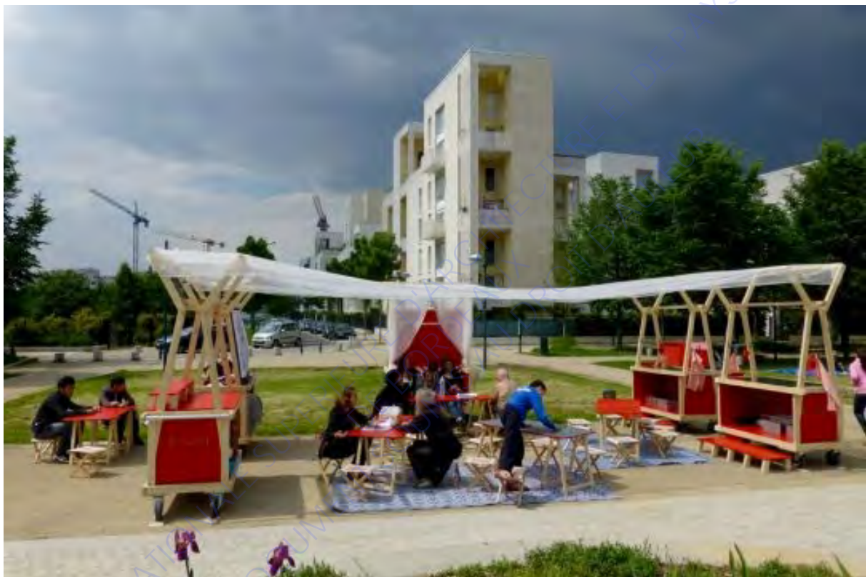
Gresilab : la structure nomade

En alternant les moments de détente et de travail, le collectif crée chez les participants une représentation conviviale de l'objet architecturale qu'est le cabanon et de tout ce qu'il intègre. Le cabanon dans sa dimension esthétique, le poêle, les casseroles pendant le moment de « battle de soupe » sont autant d'objets intermédiaires qui véhiculent une image conviviale et chaleureuse dans un contexte hivernal. Le rôle des objets intermédiaires est donc signifiant et d'une certaine importance dans ce qu'il mobilise les gens du quartier.