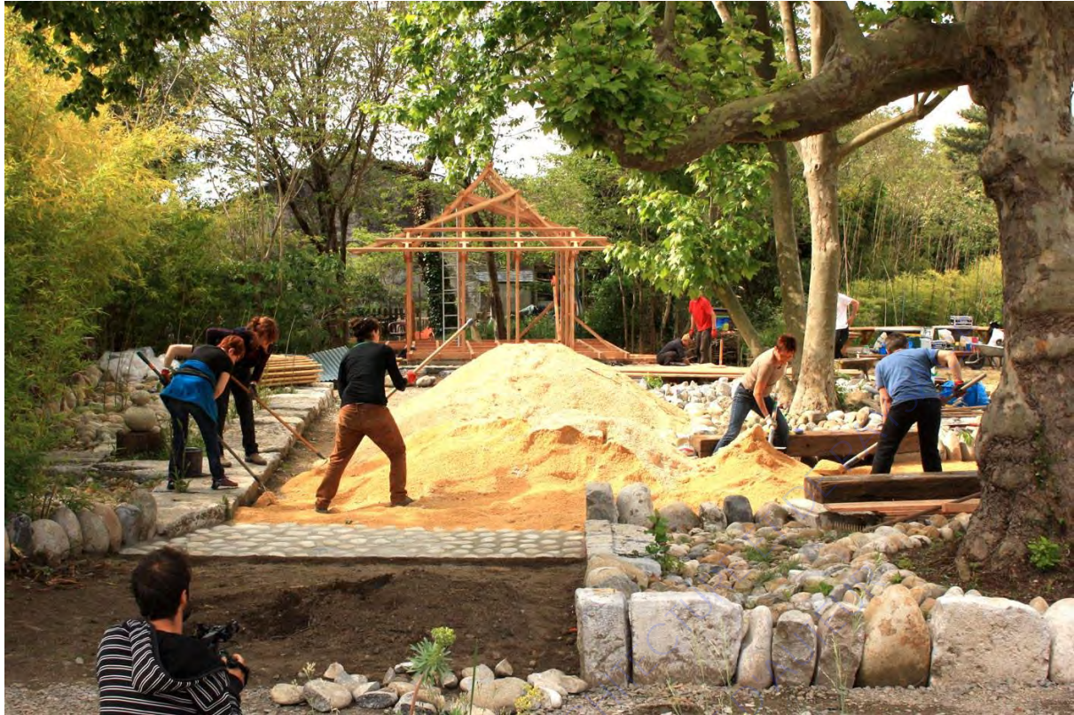
Les ateliers de l'enclos, « saison 2 »

L'atelier Bivouac, qui regroupe six paysagistes fait des chantiers participatifs qui font suite à des ateliers de co-conception. Dans leur déroulement, la population est actrice sur le chantier. Pour l'atelier de l'enclos, les habitants se sont mis à contribution pour la fourniture de « centaines de plants d'une soixantaine de variétés différentes ». Tout au long du projet, une équipe de documentaristes (Films sur la comète) a construit un documentaire-fiction racontant le déroulement du projet. Les enfants de la commune de Lanas (07) ont donc écrit l'histoire « De grands travaux nous attendent ».