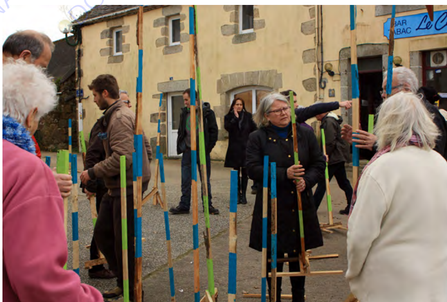
Tester les scénarii