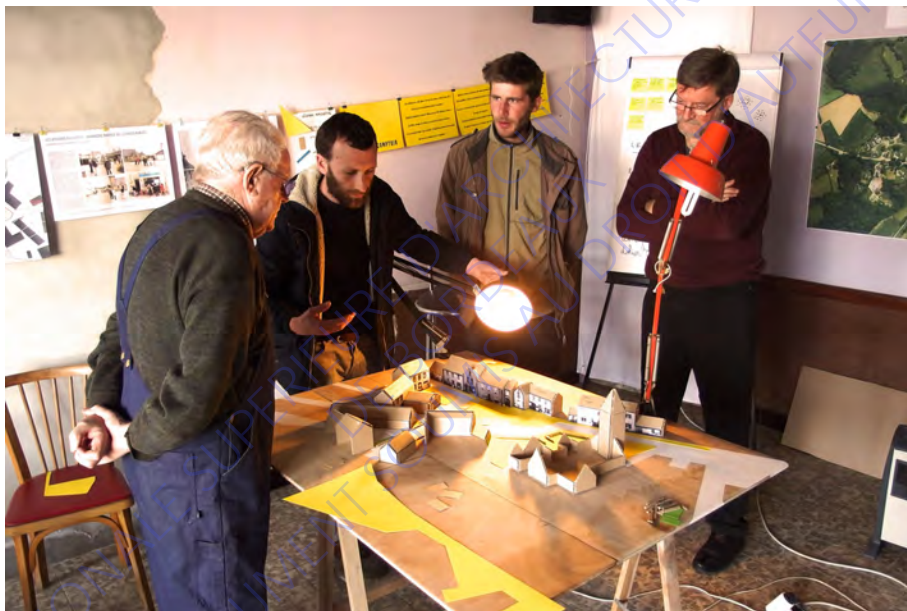
La maquette sensible