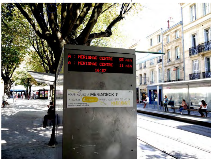
Faire changer les perceptions du temps et des distances