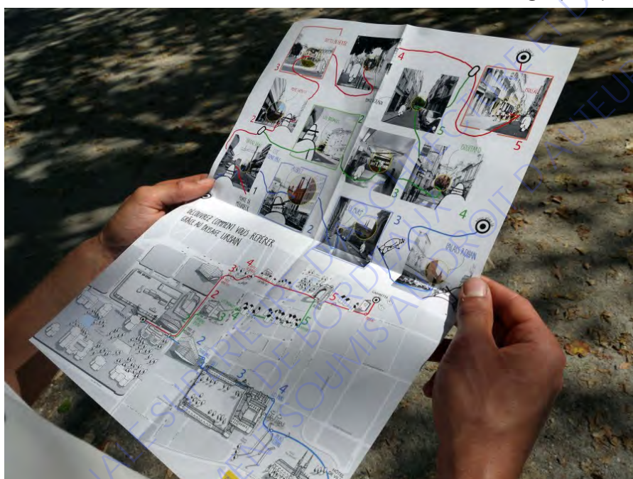
Carte des qualités paysagères du quartier pour favoriser la marche