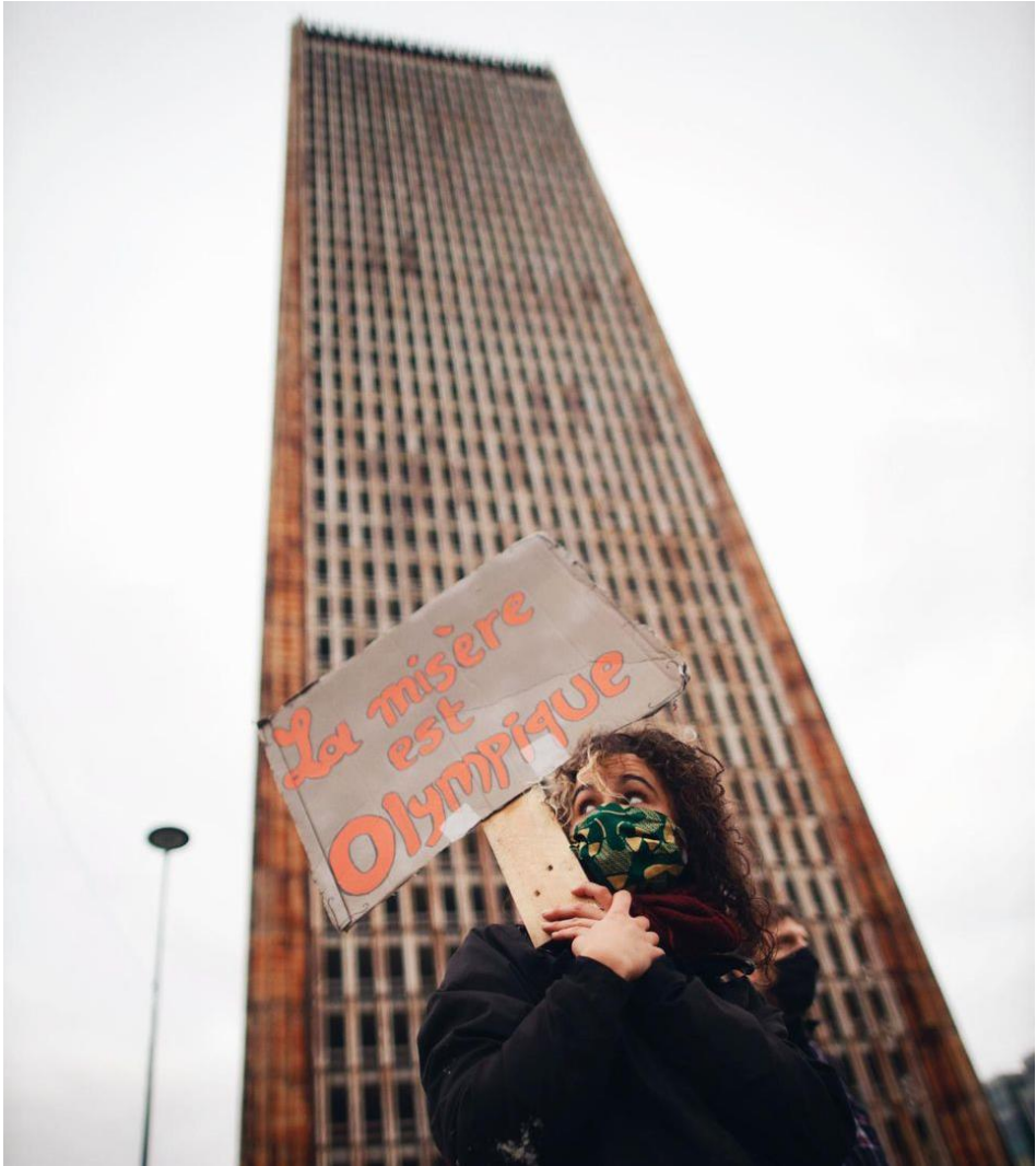
Manifestation anti-JO à Paris, 2017