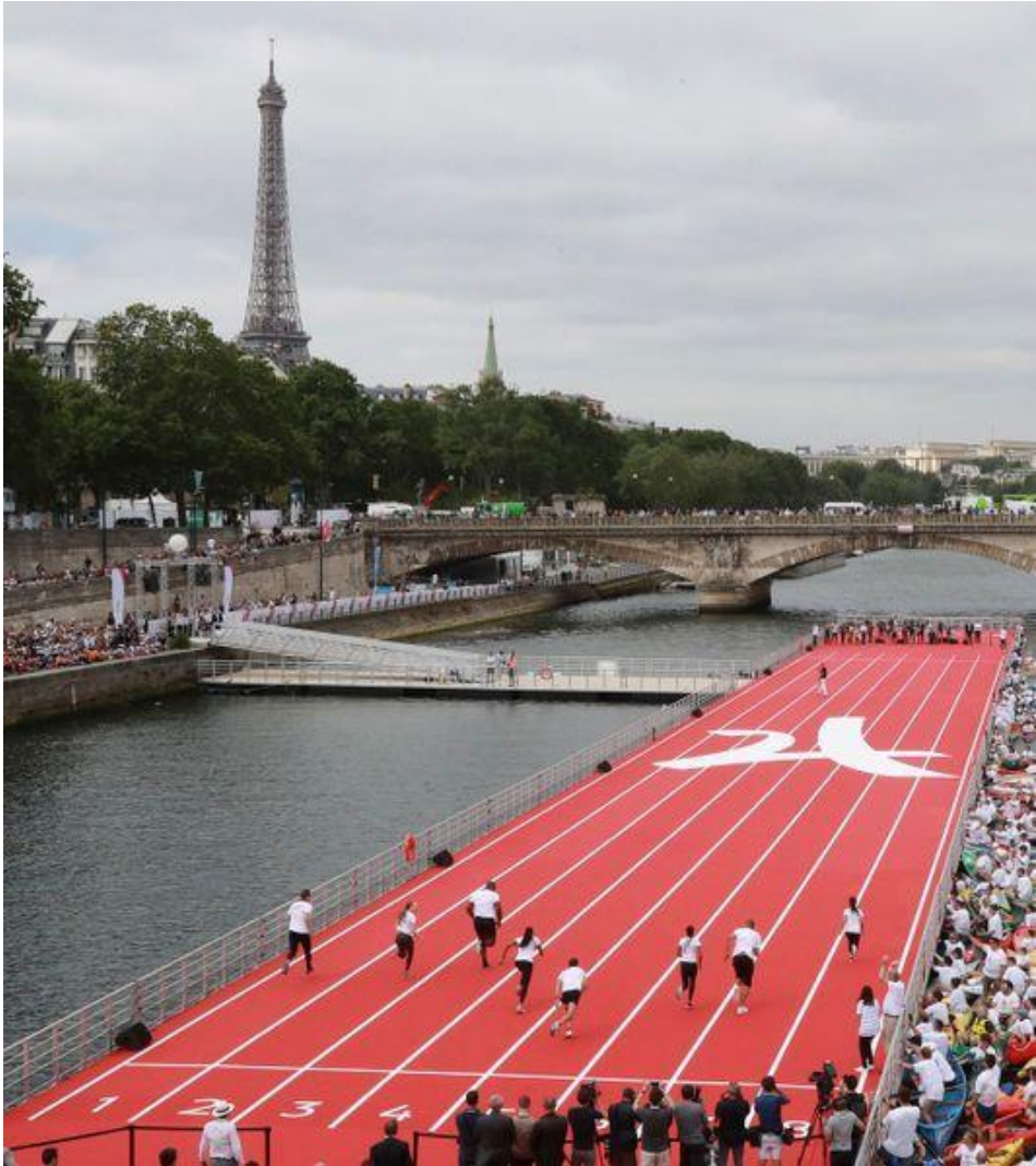
Mise en scène pour la candidature de Paris, 2016