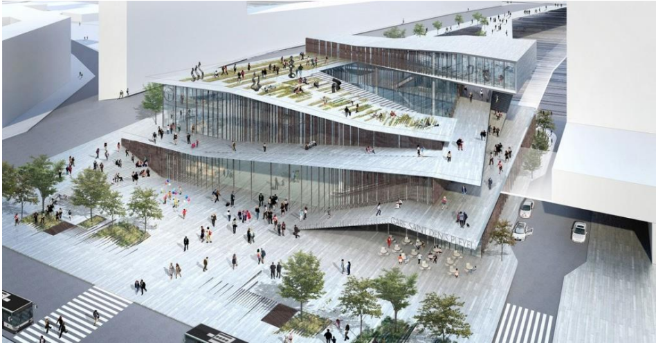
La nouvel hub de transport du 93 situé à Pleyel, Saint-Denis