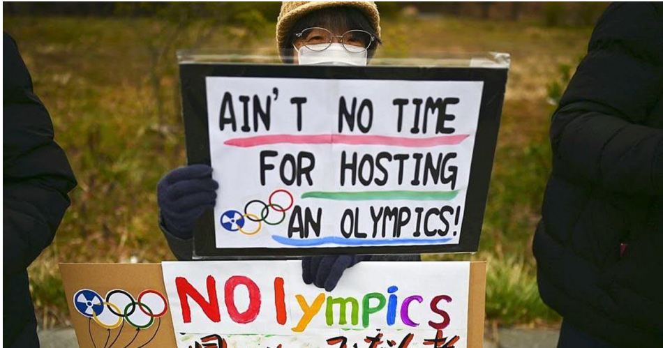
Habitante de Fukushima contre la tenue des JO, 2019