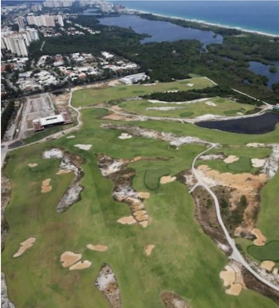
Le parcours de golf, un an après RIO 2016 @Naco Doce