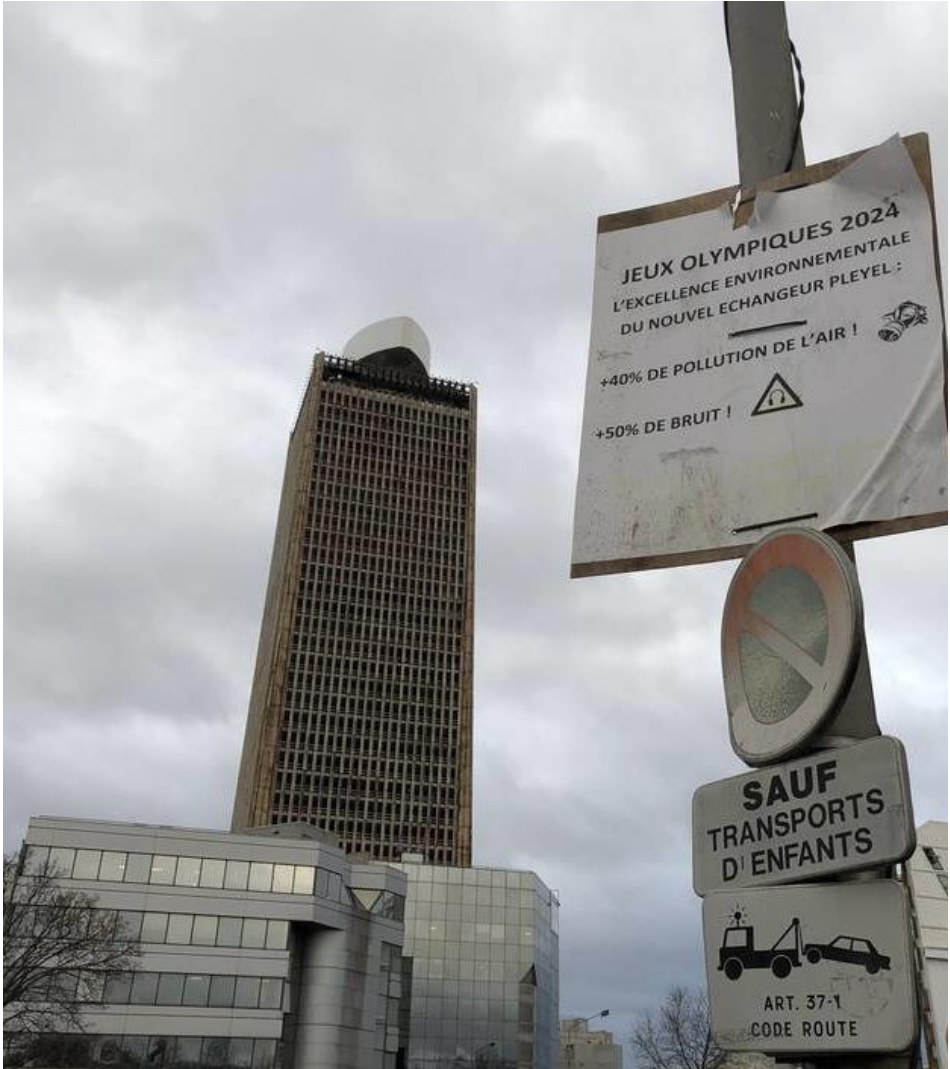
La Seine Saint-Denis en colère, 2020