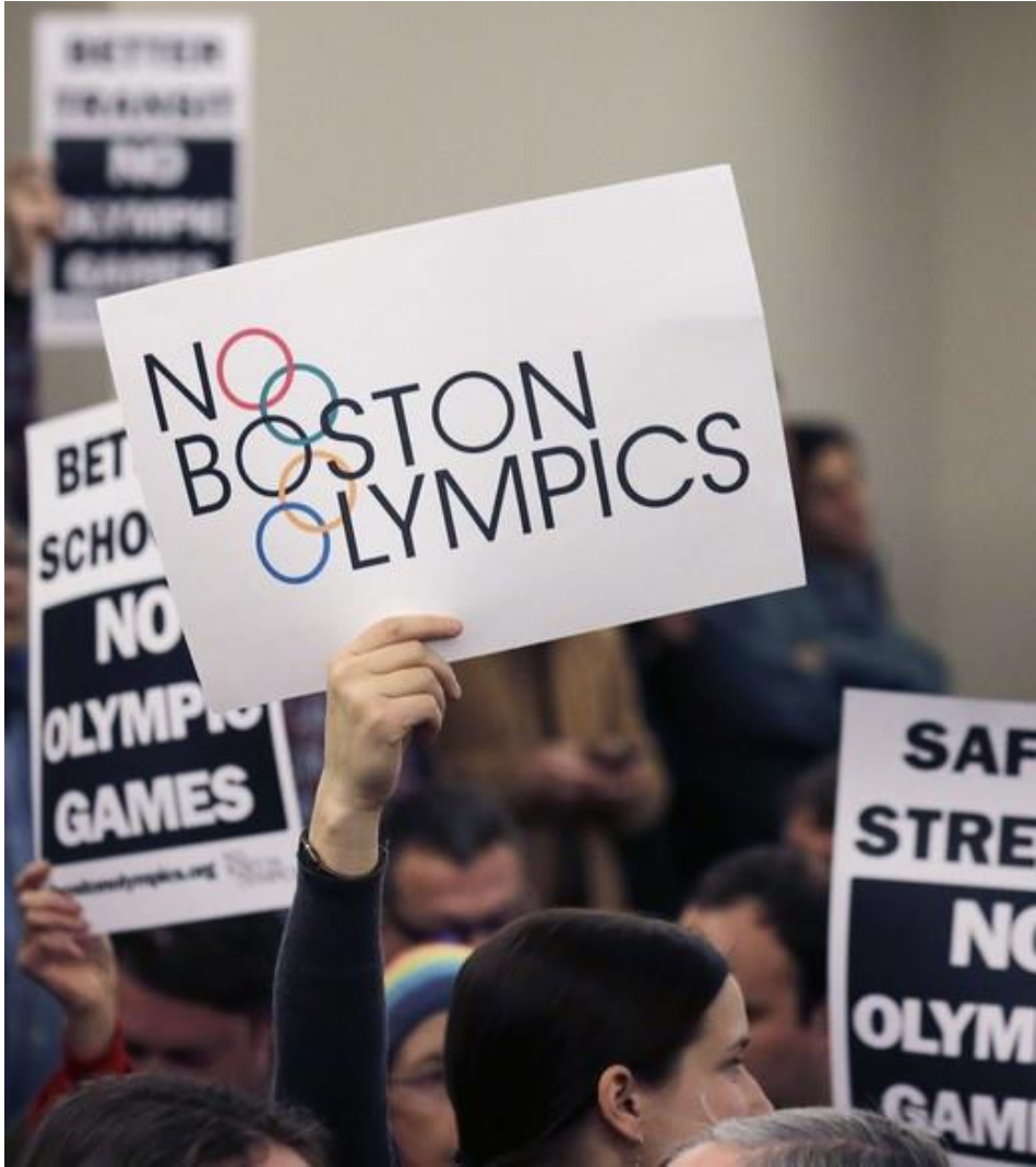
Manifestation contre l'organisation des JO 2024 à Boston, 2017