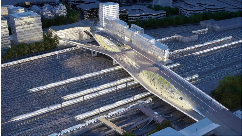
Le Franchissement Urbain Pleyel à Saint-Denis