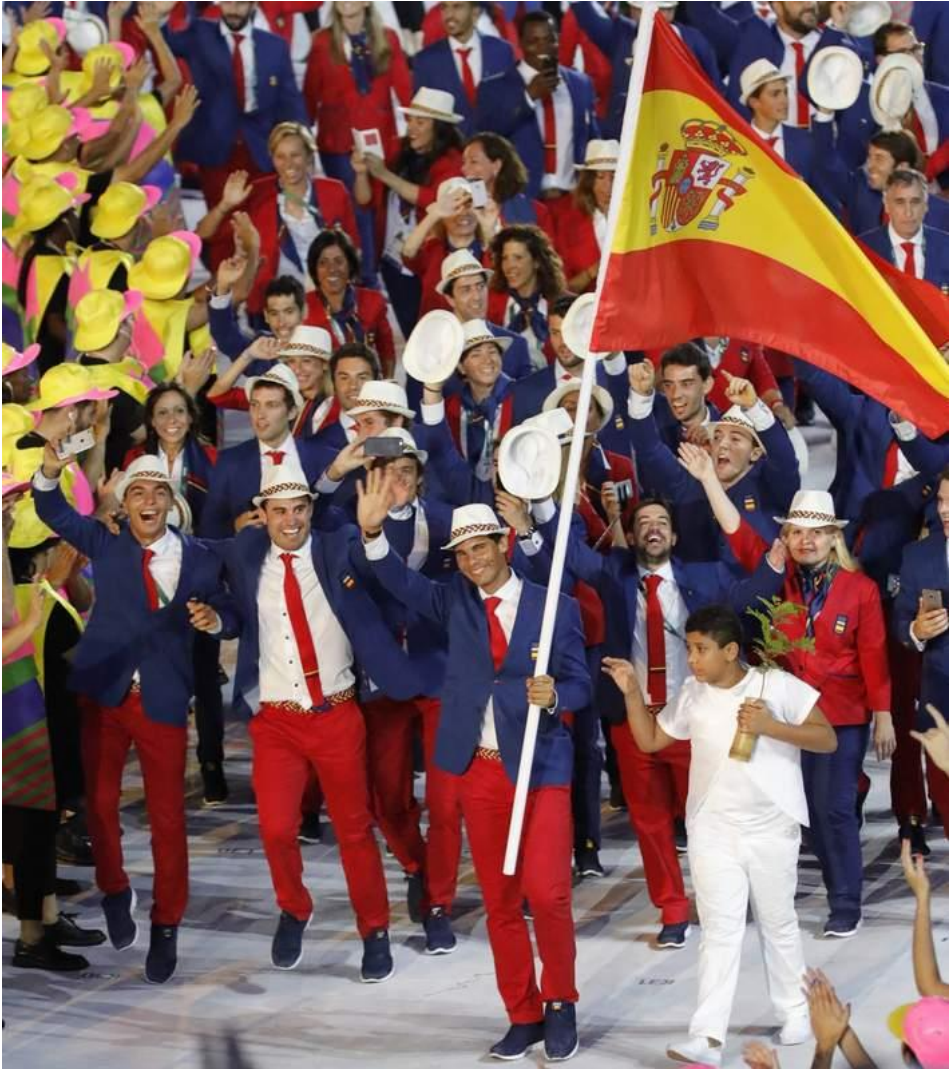
Un moment de fête et de rassemblement national, Rio 2016