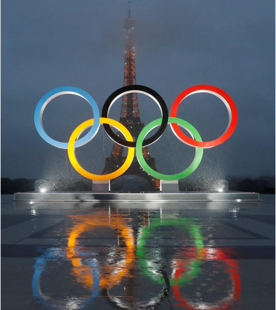
Attribution de l'édition de 2024 à Paris, 2019