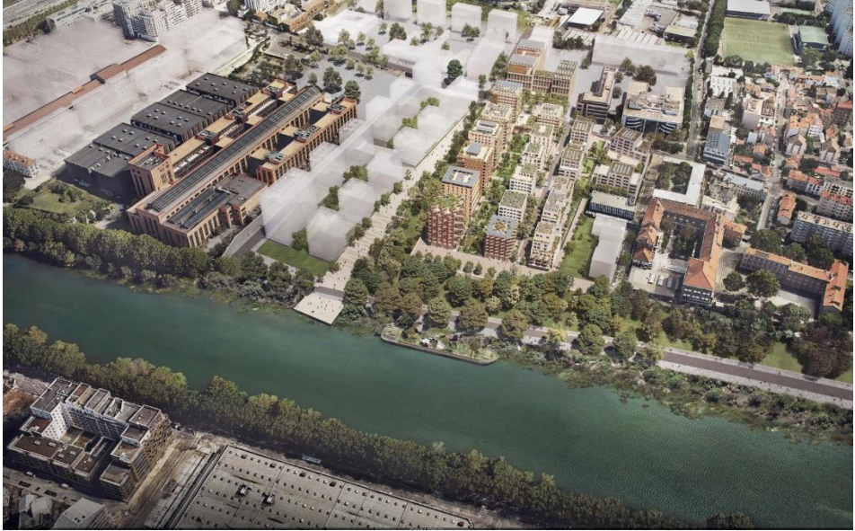
Futur Village Olympique à Pleyel, Saint-Denis