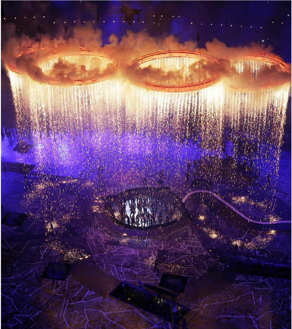
Deux semaines qui se terminent par une cérémonie de clôture, Londres 2012