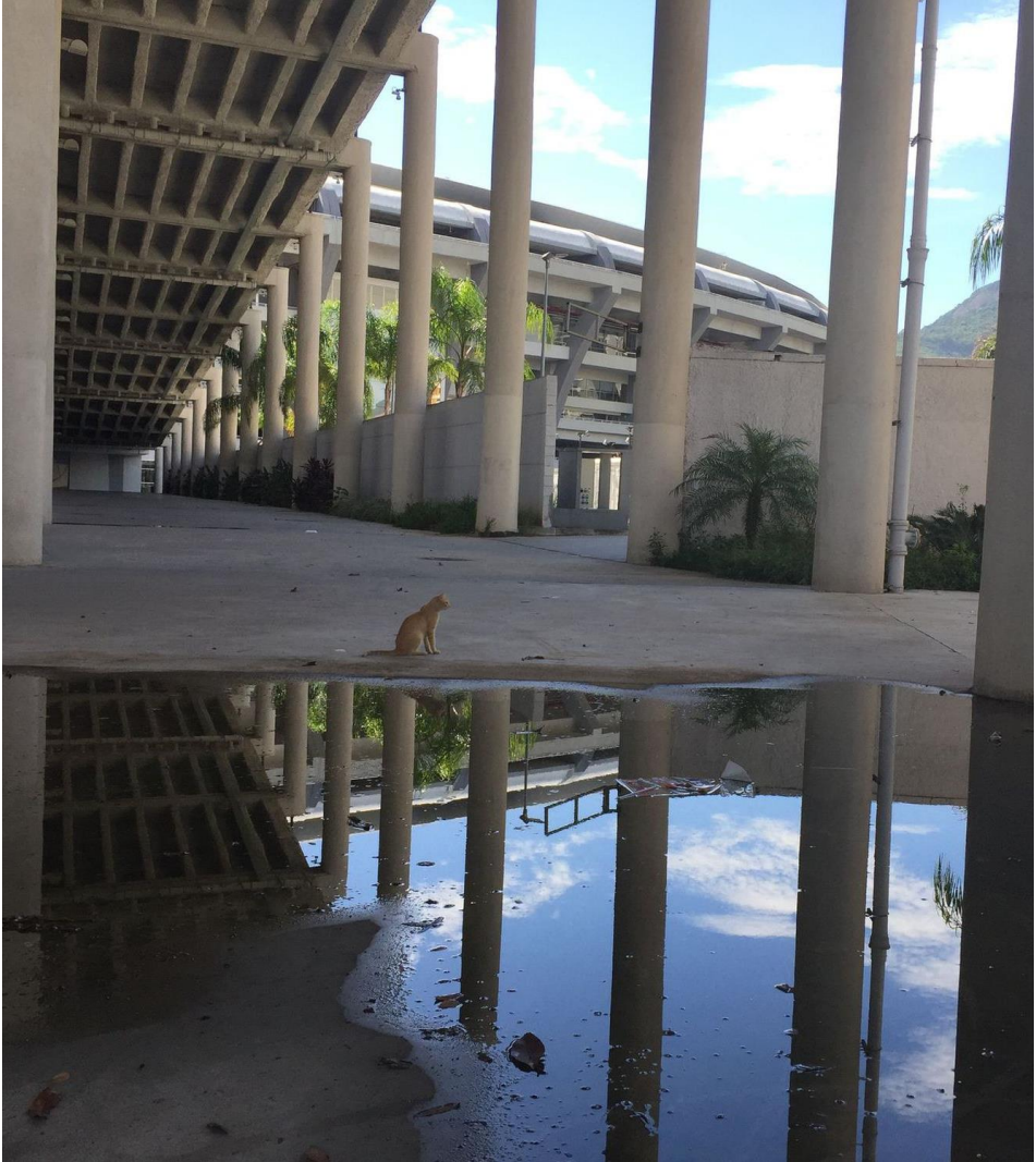
Installation sportive en friche, un an après RIO 2016