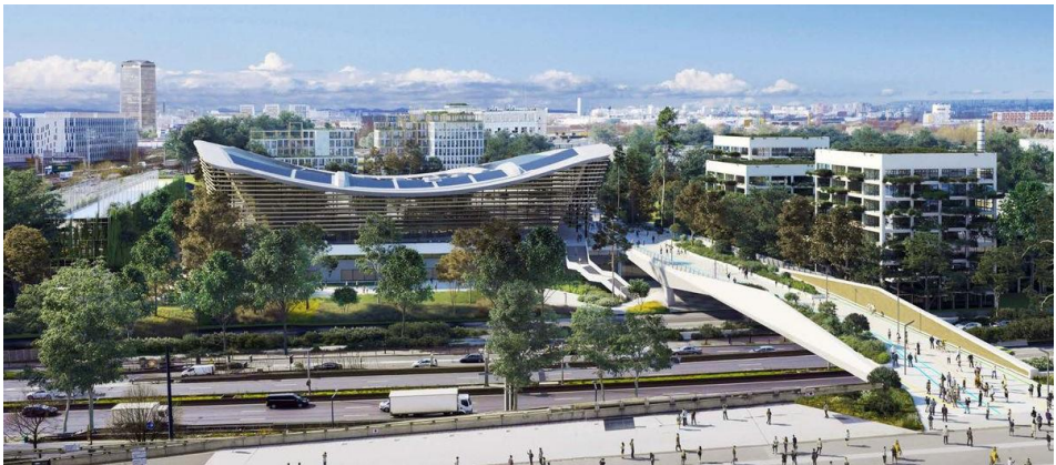
Le CAO, nouvelle infrastructure sportive à Pleyel, Saint Denis