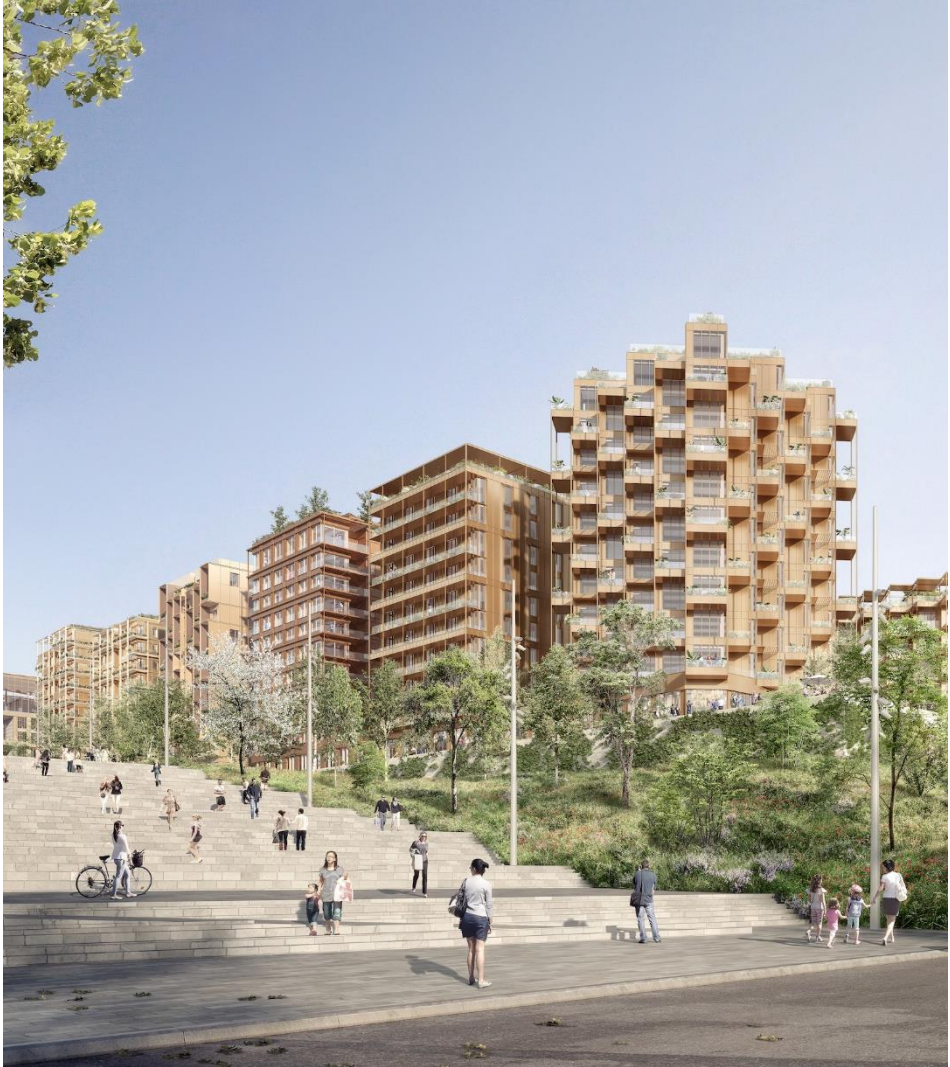
Futur Village Olympique à Pleyel, Saint-Denis