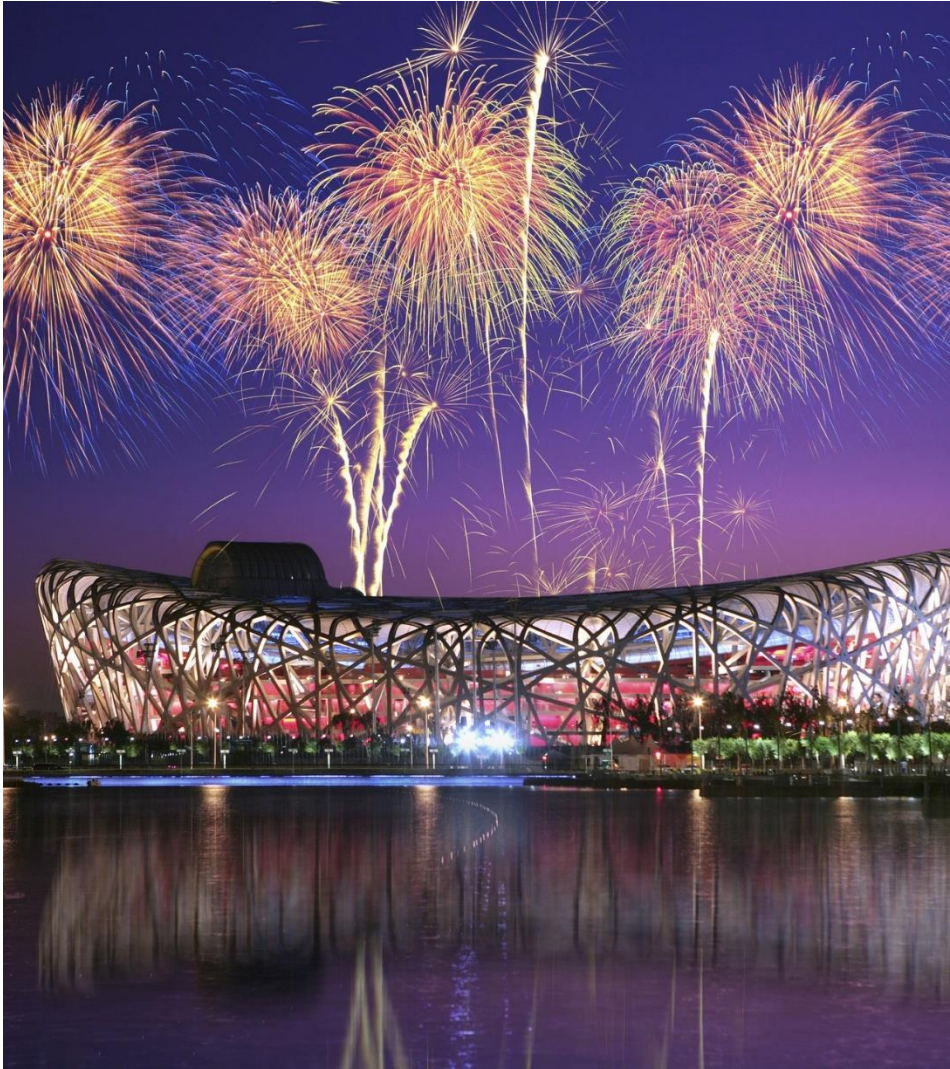
Cérémonie d'ouverture Beijing 2008