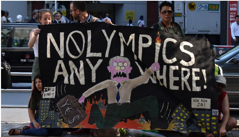
Manifestation anti-olympique à Tokyo, 2019