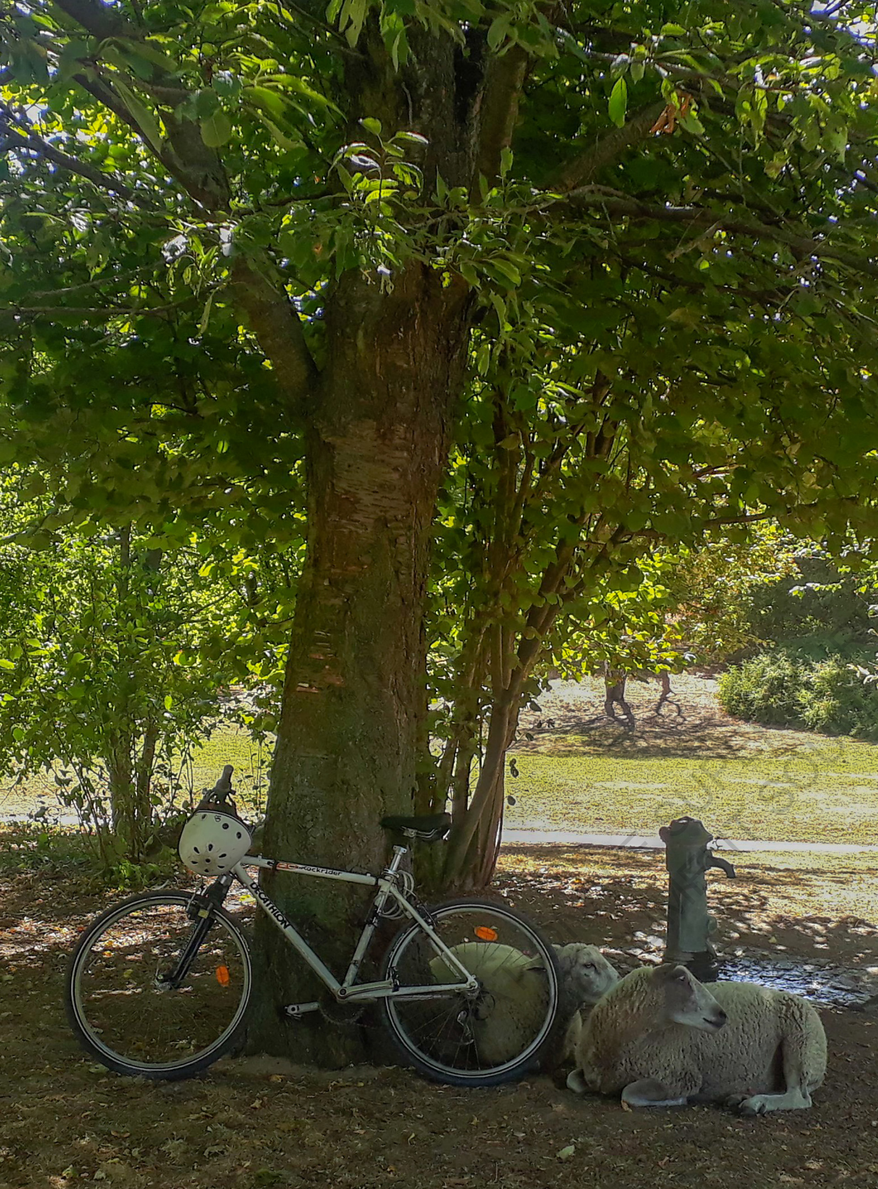
Clinamen dans le parc de La Courneuve.