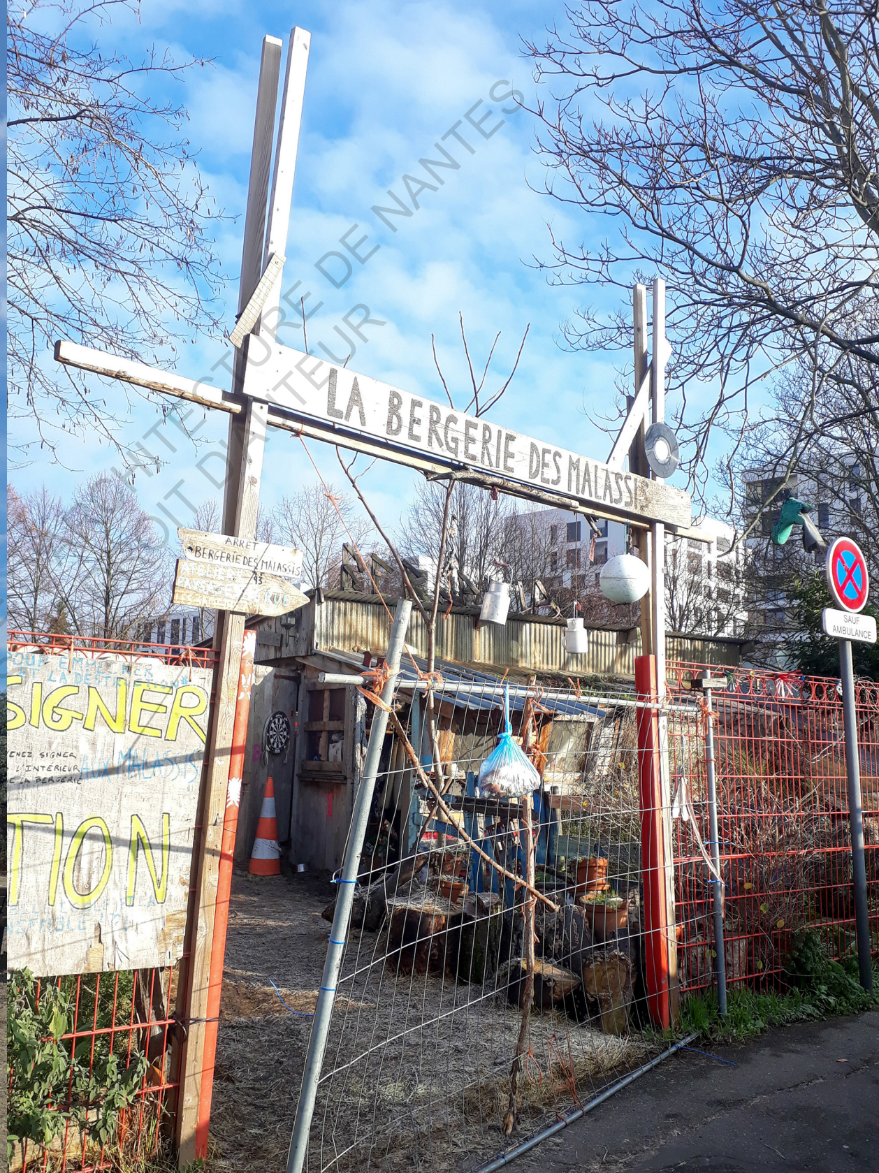
Sors de Terre à la Bergerie des Malassis.