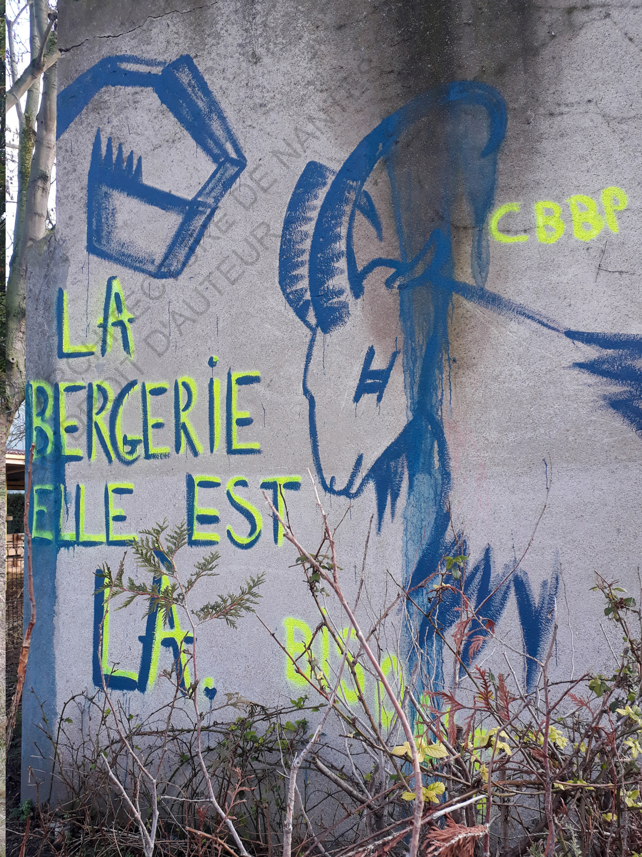
Sors de Terre à la Bergerie des Malassis.