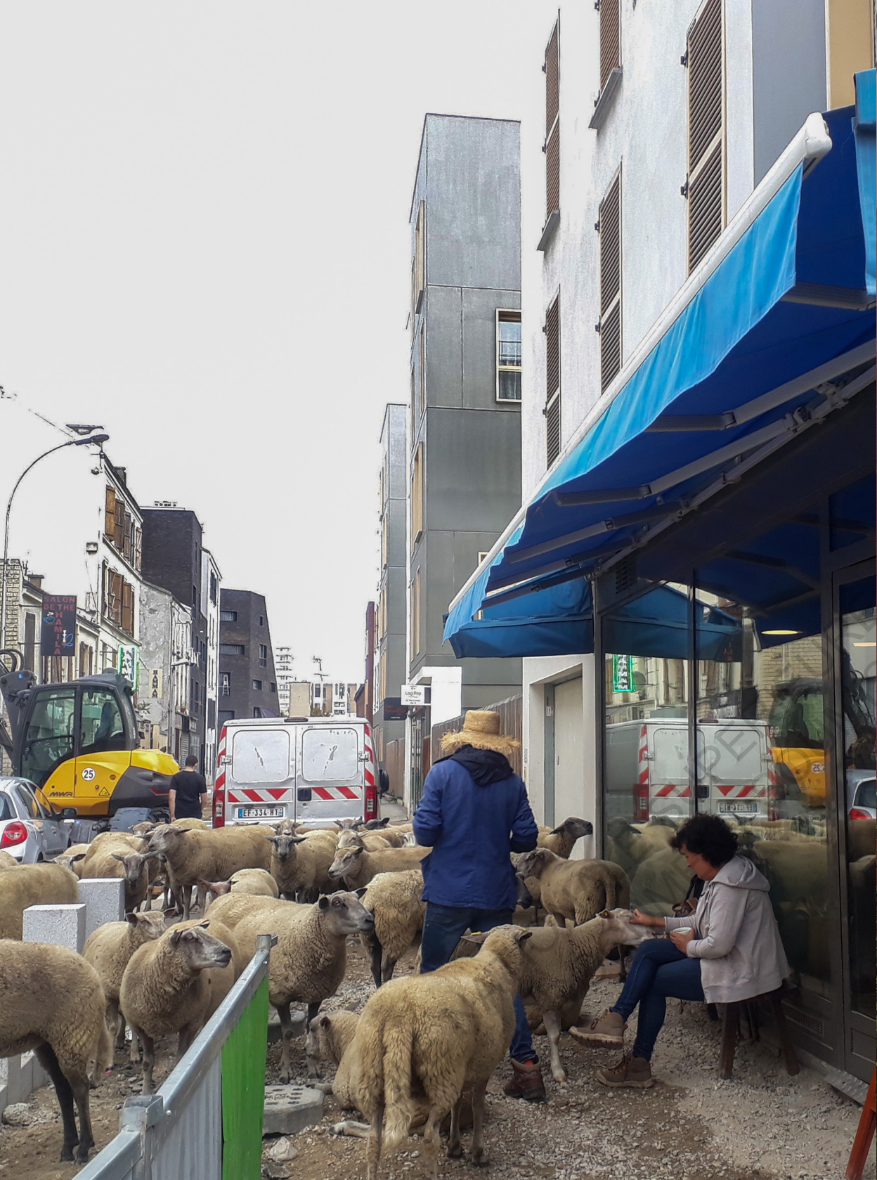
Bergers Urbains à Aubervilliers.