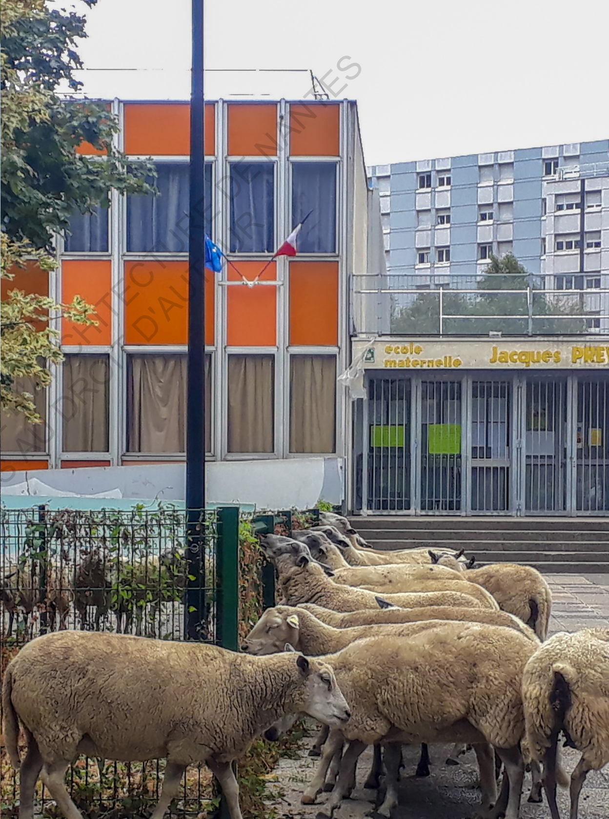
Bergers Urbains à Aubervilliers.