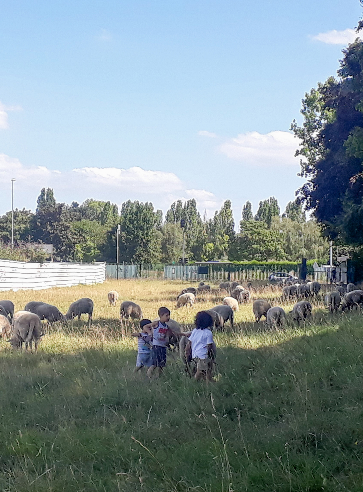
Clinamen dans le parc de La Courneuve.