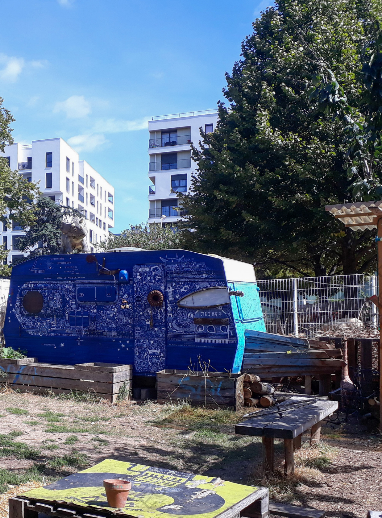
Sors de Terre à la Bergerie des Malassis.