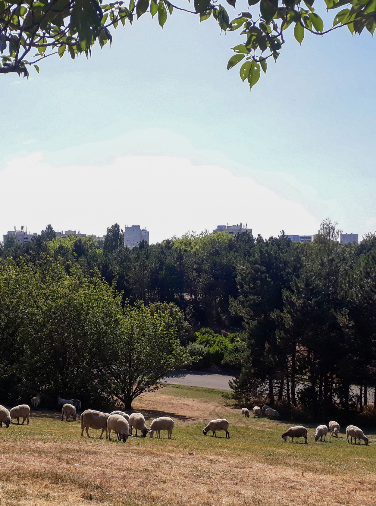
Clinamen dans le parc de La Courneuve.