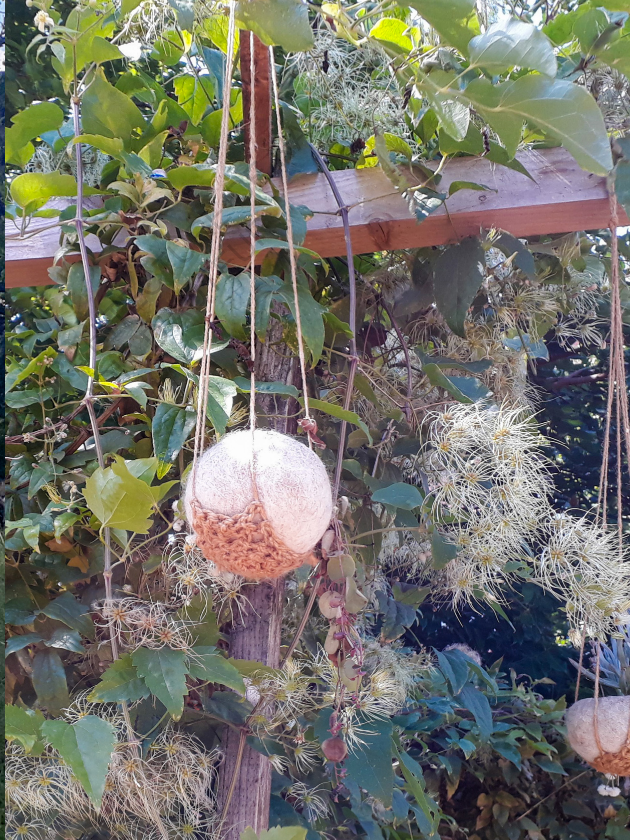
Sors de Terre à la Bergerie des Malassis.