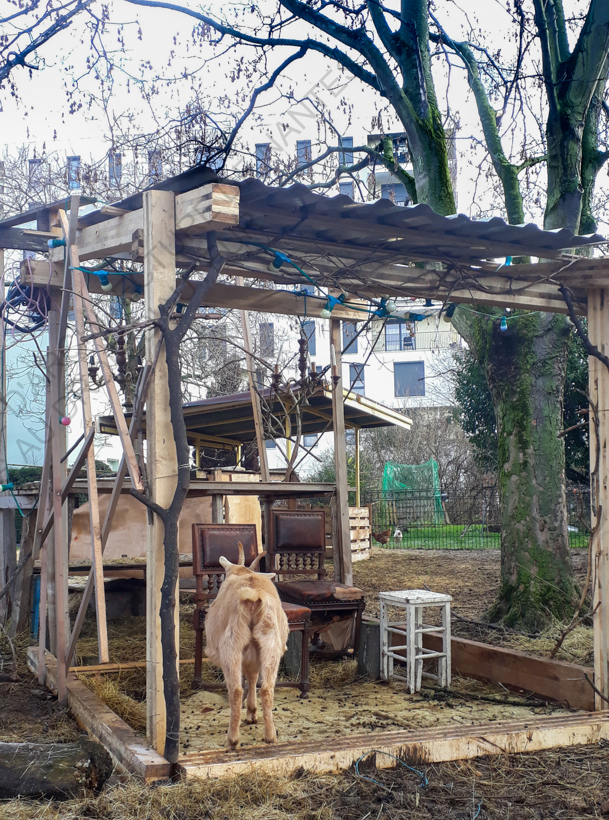
Sors de Terre à la Bergerie des Malassis.