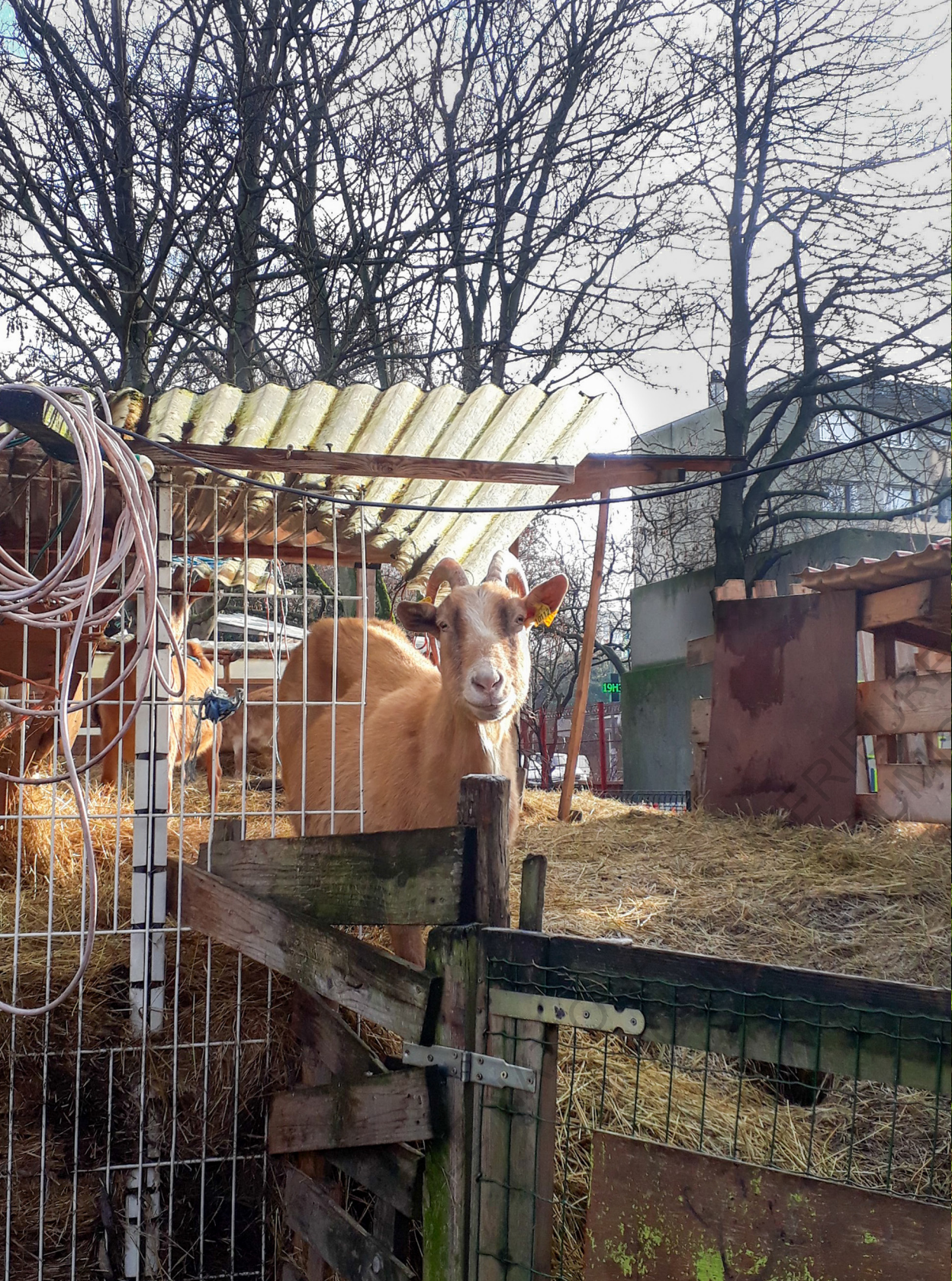
Sors de Terre à la Bergerie des Malassis.