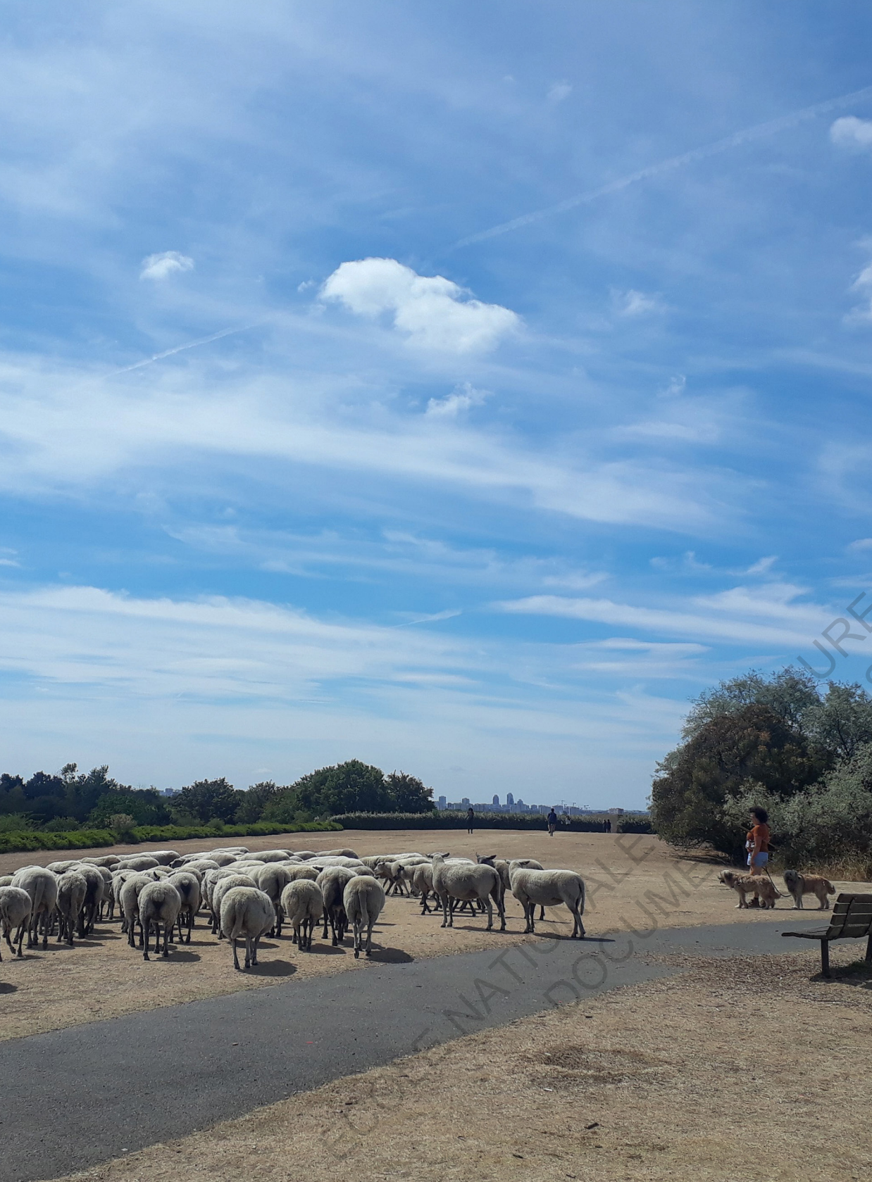
Clinamen dans le parc de La Courneuve.