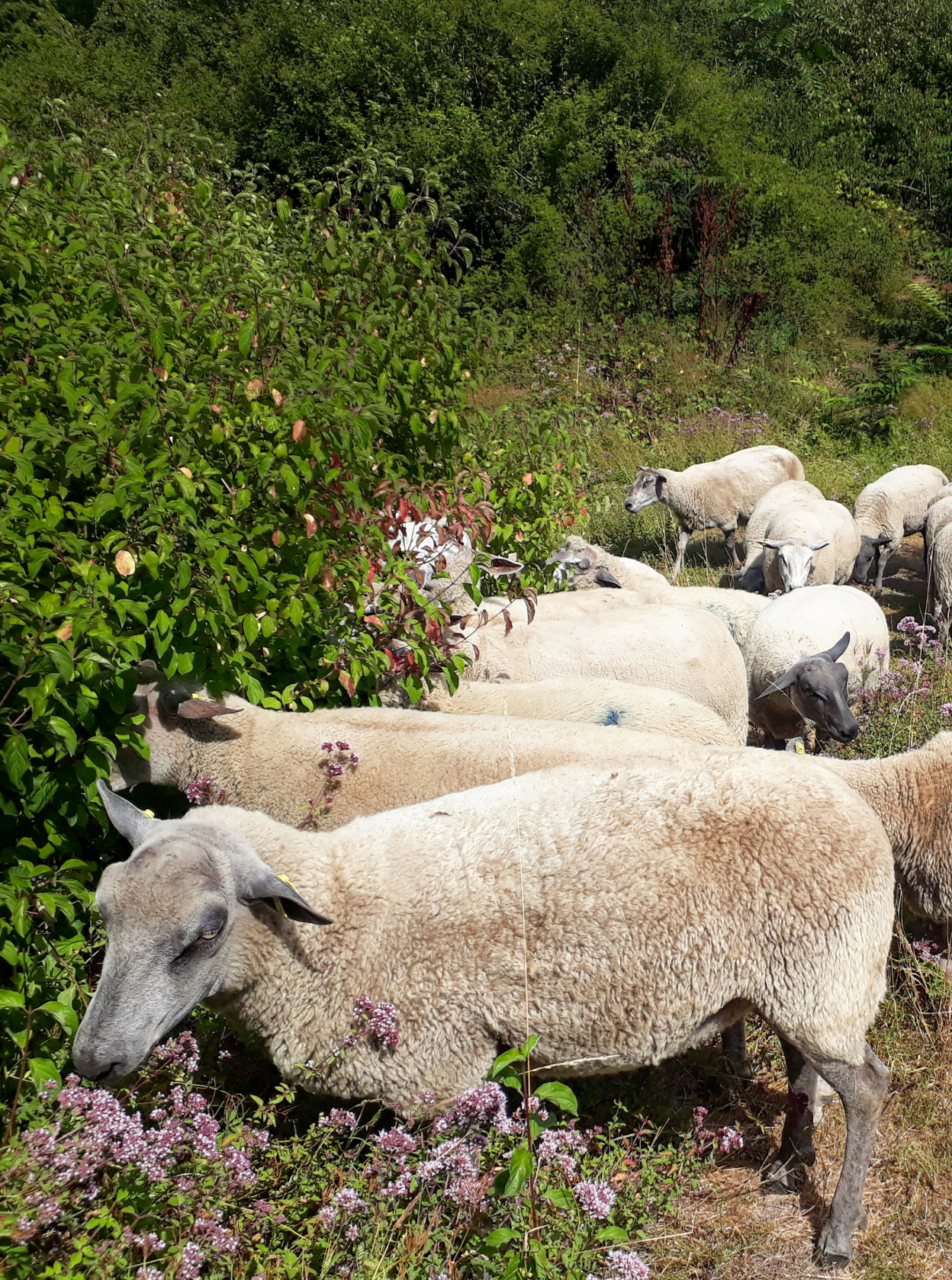
Clinamen dans le parc de La Courneuve.