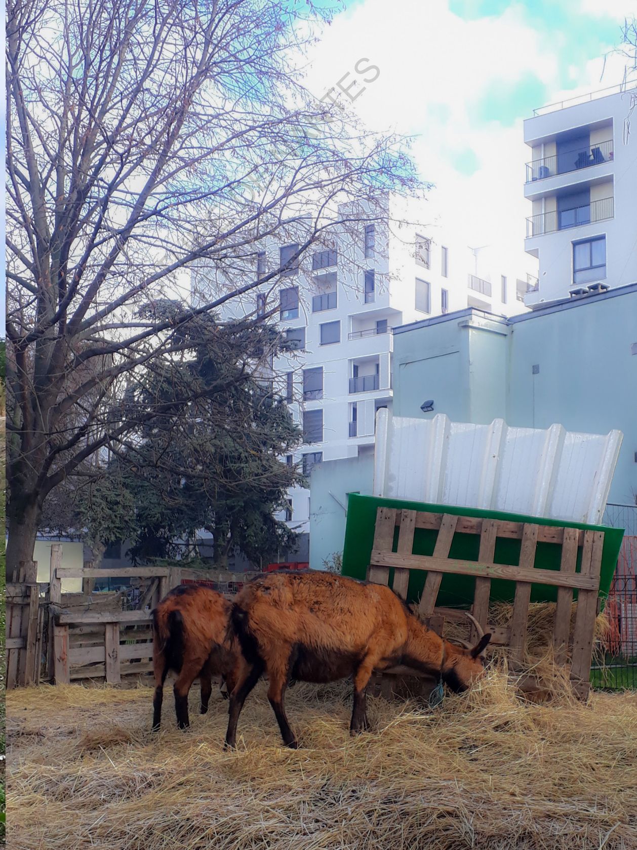
Sors de Terre à la Bergerie des Malassis.