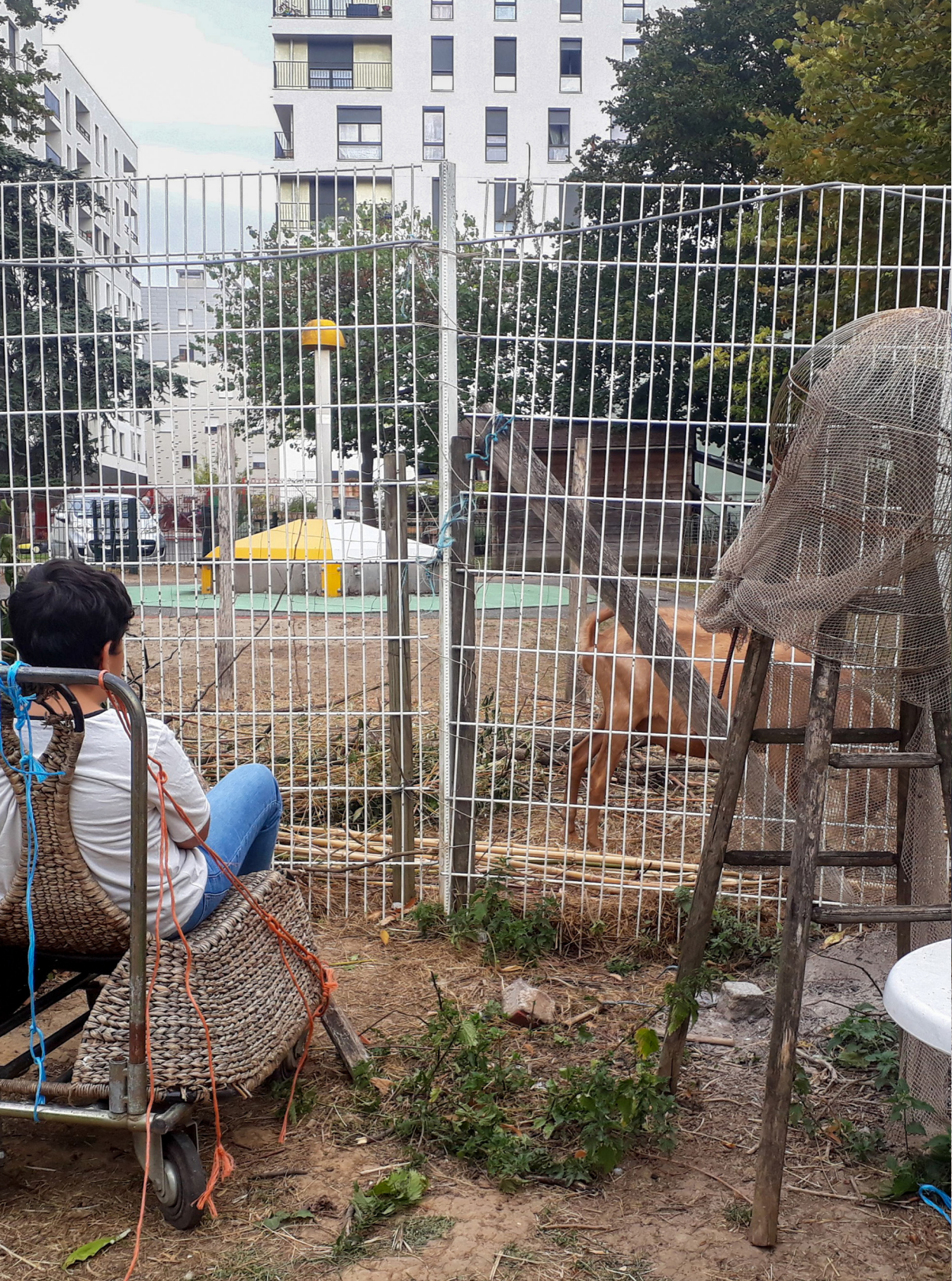
Sors de Terre à la Bergerie des Malassis.