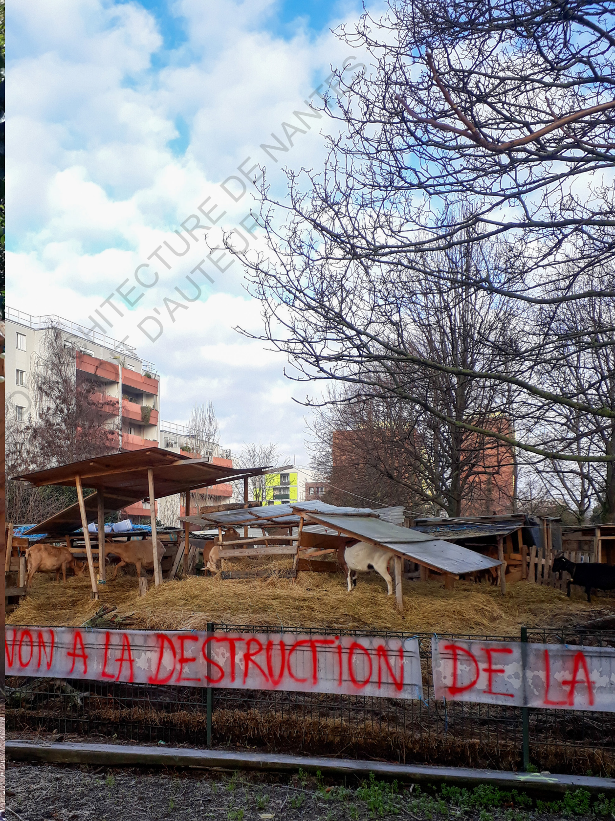
Sors de Terre à la Bergerie des Malassis.