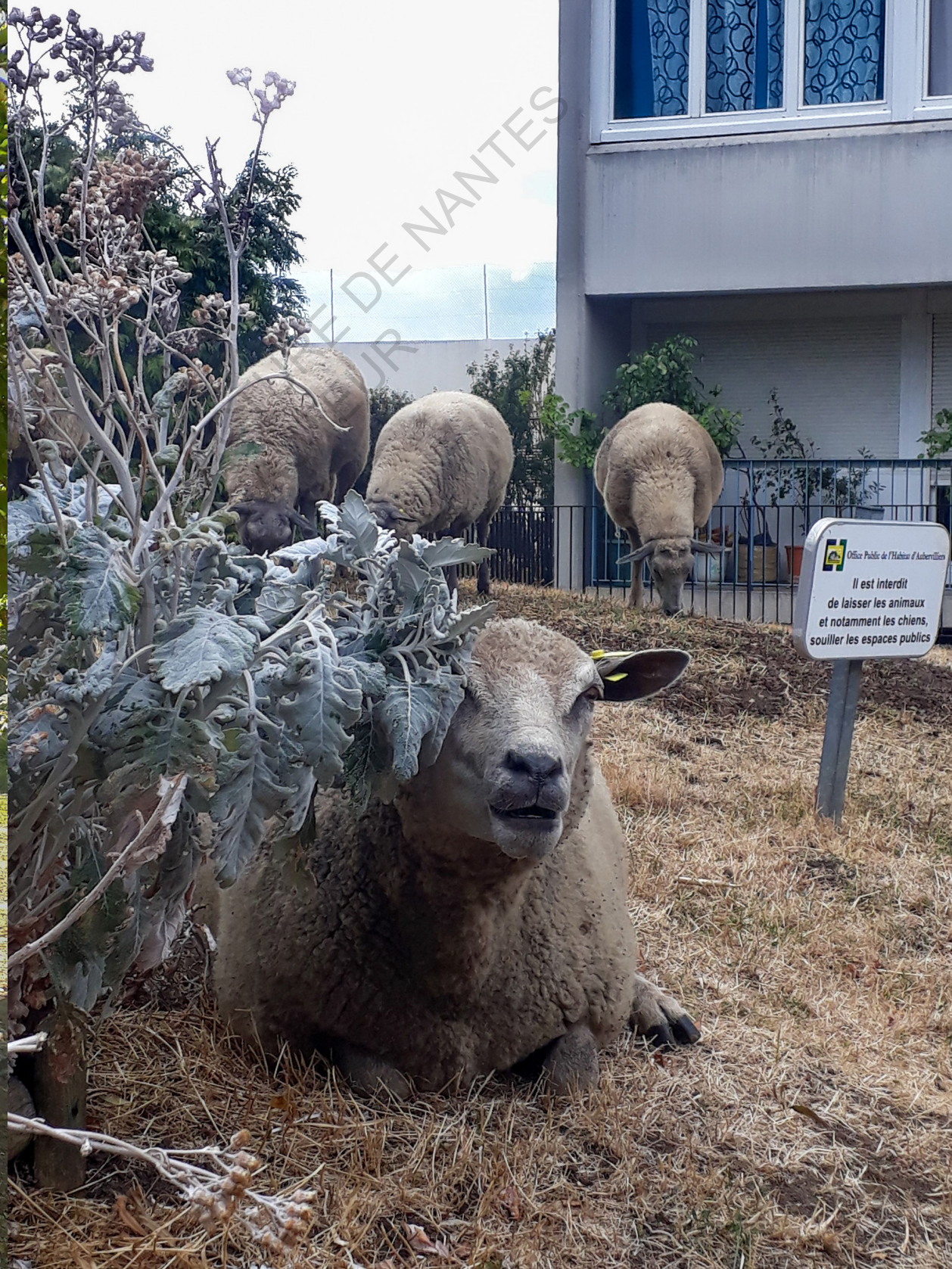
Bergers Urbains à Aubervilliers.