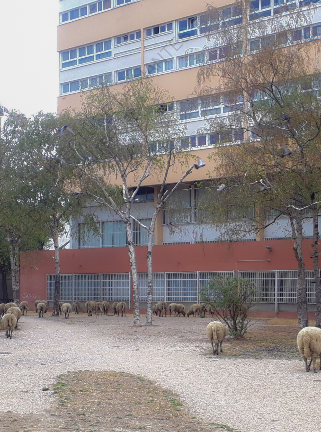
Bergers Urbains à Aubervilliers.