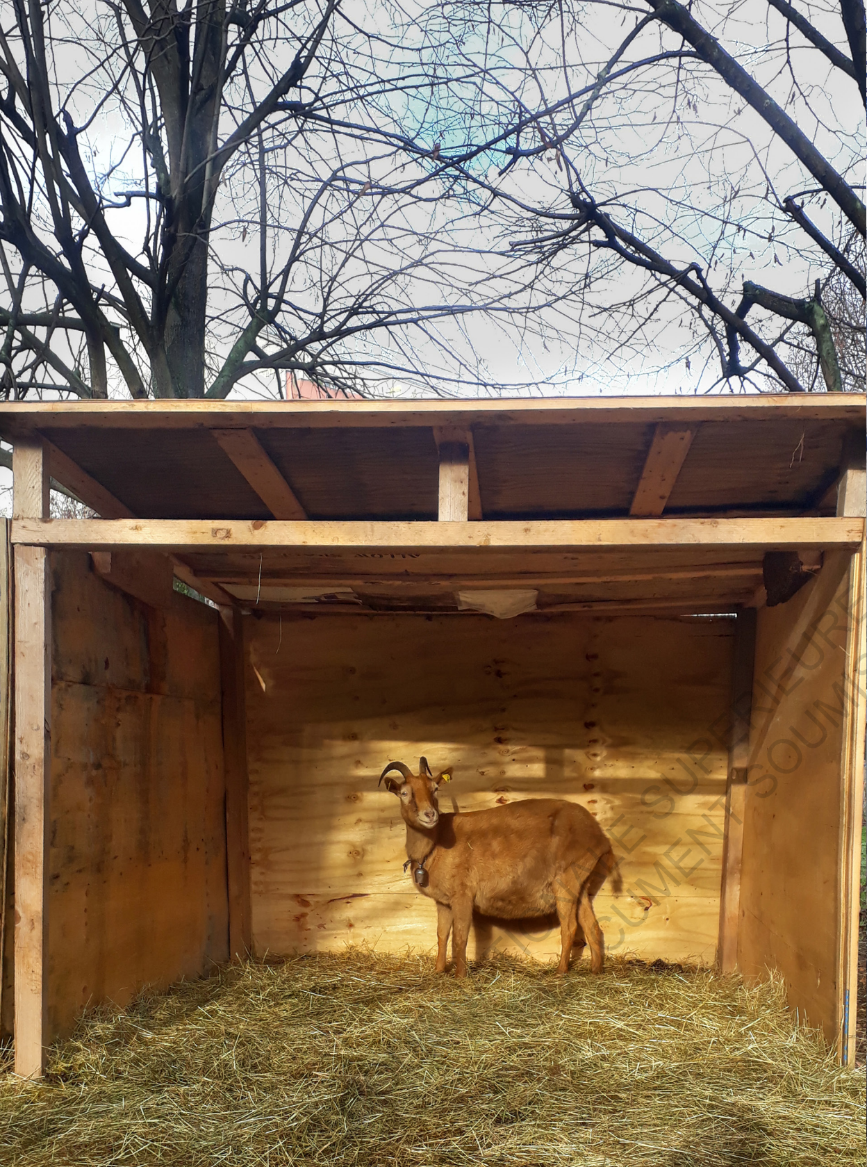
Sors de Terre à la Bergerie des Malassis.