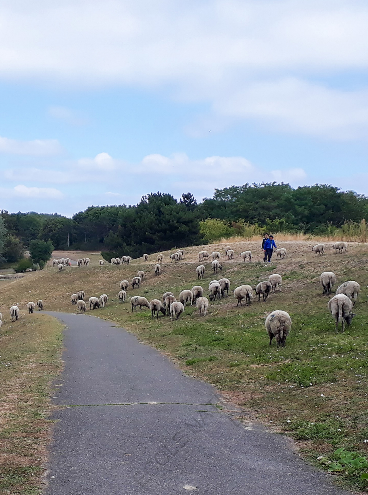
Clinamen dans le parc de La Courneuve.