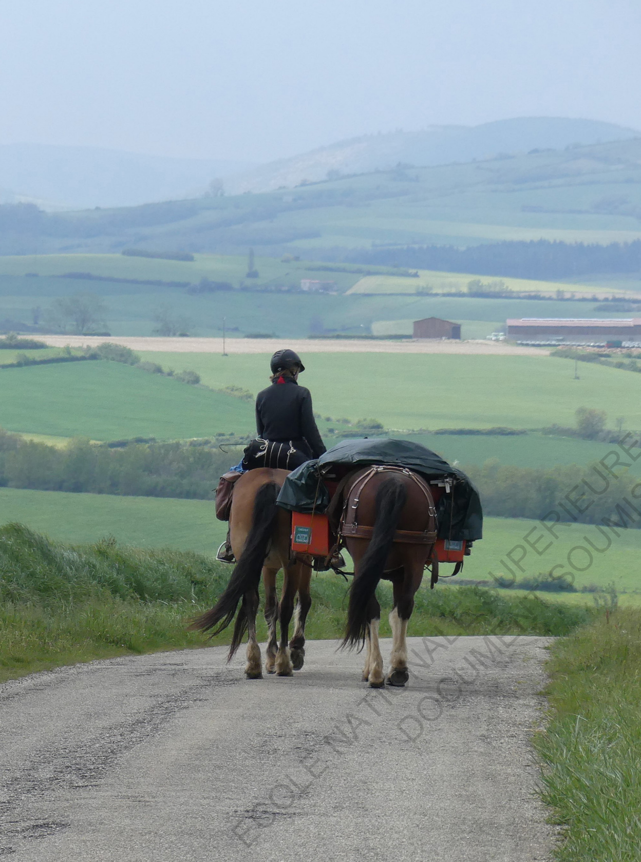
Le temps du voyage, photographie par Alexandrine.