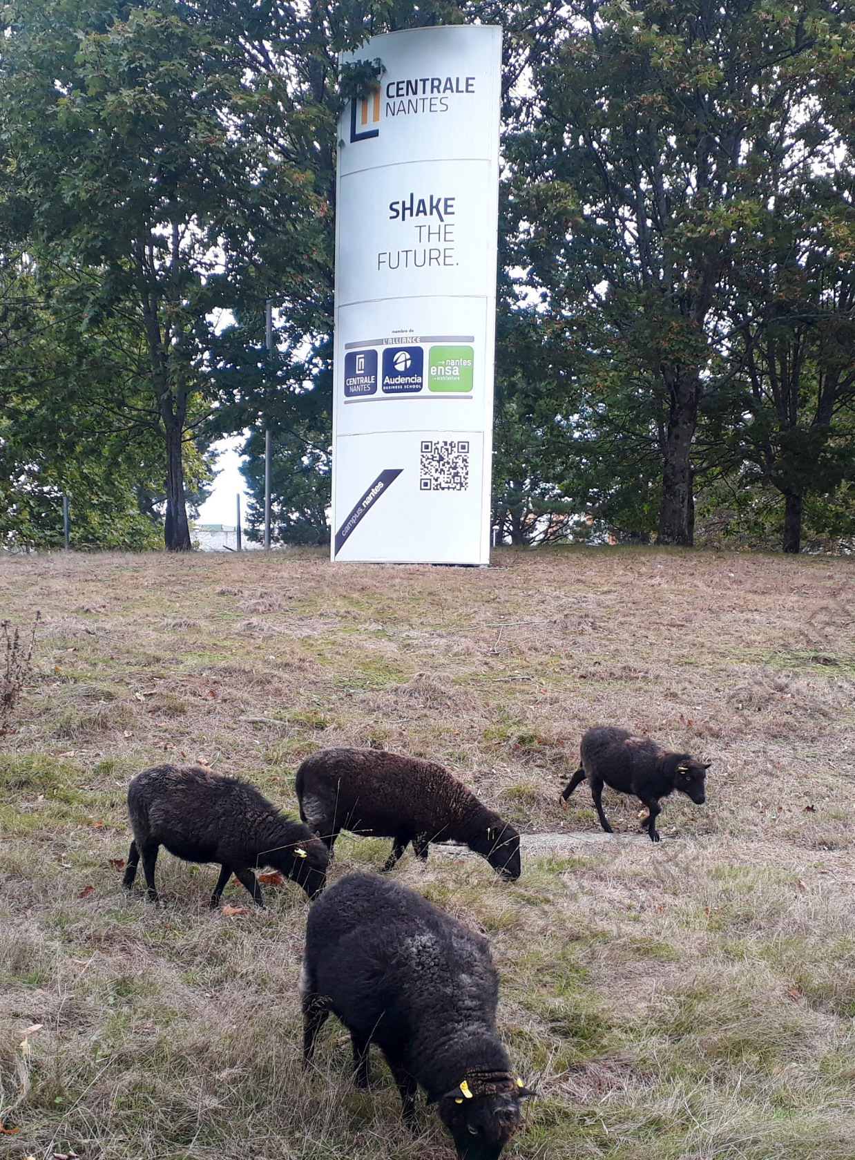
Breizh Moutondeurs à Centrale Nantes.