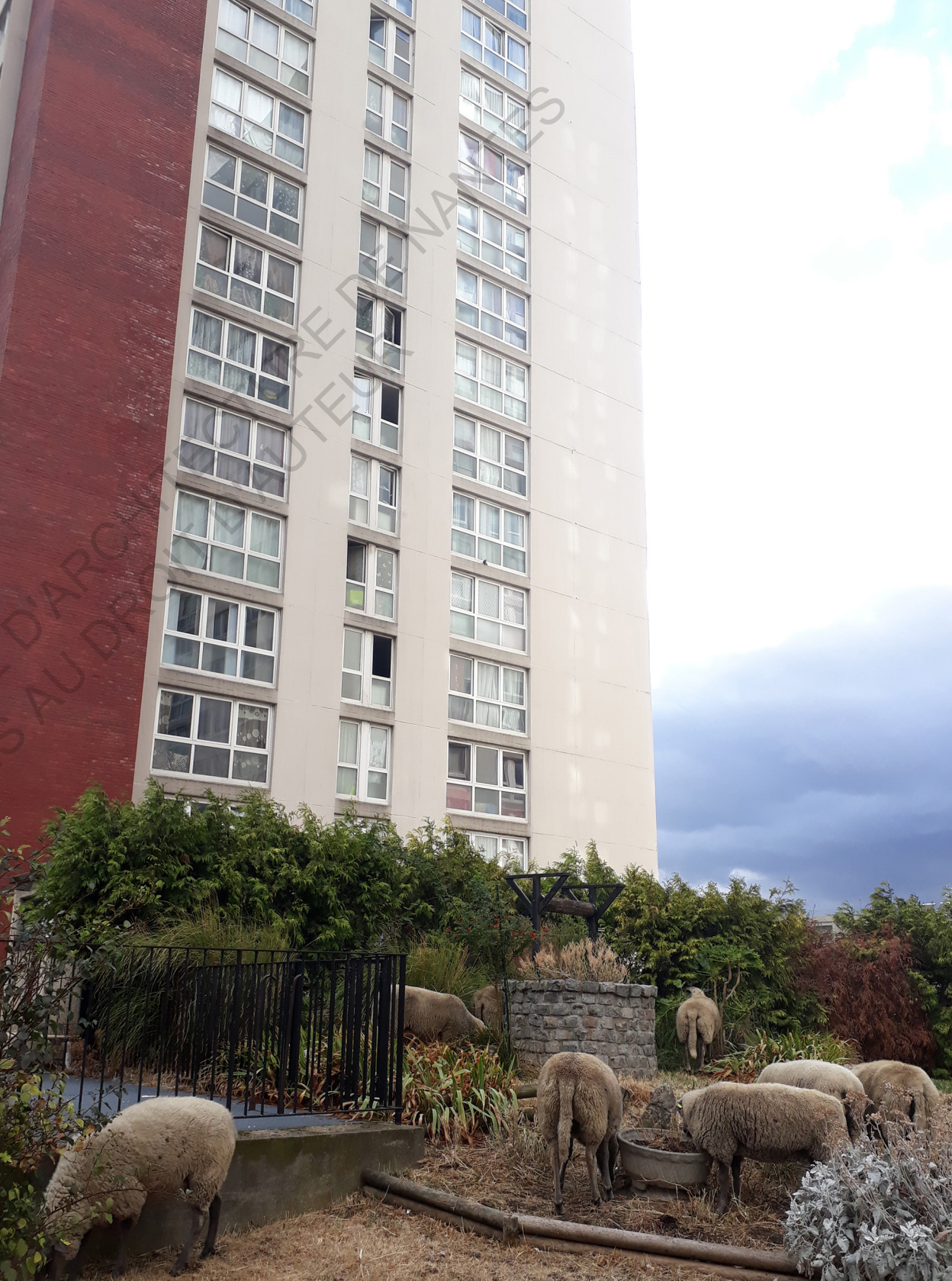
Bergers Urbains à Aubervilliers.