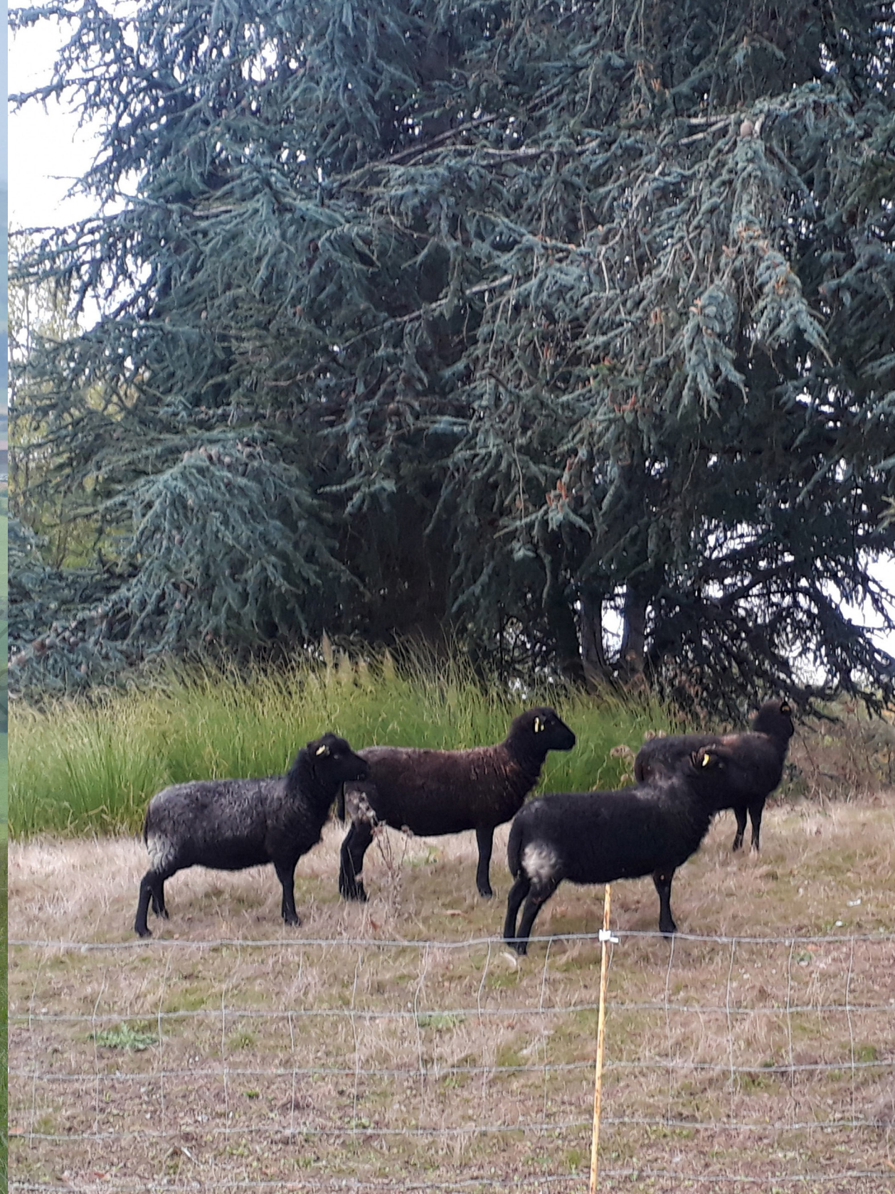
Breizh Moutondeurs à Centrale Nantes.