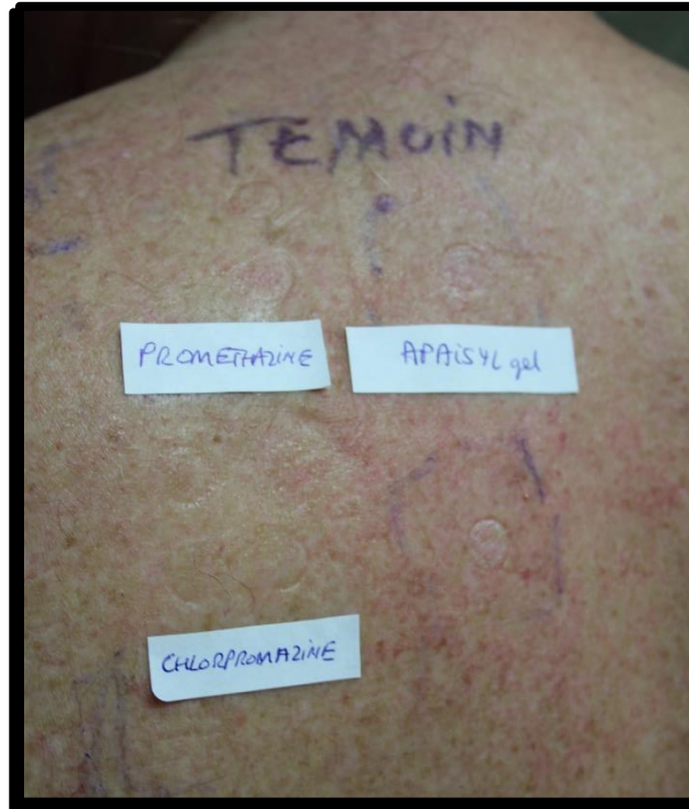
Photo 2. Phototests results in patient 1.