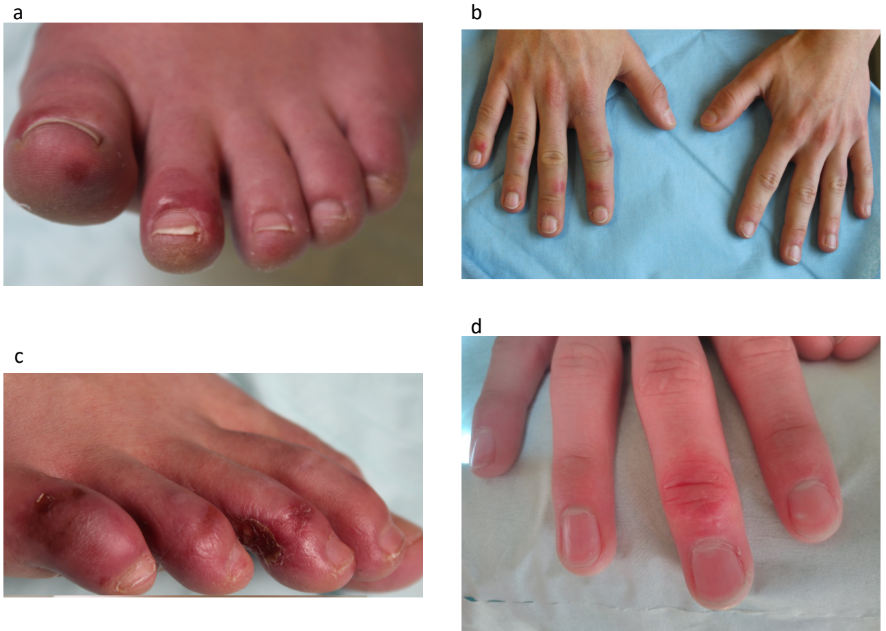
Figure 1 : présentation clinique des acrosyndromes

a : atteinte plantaire la plus fréquente faite de papules inflammatoires distales.