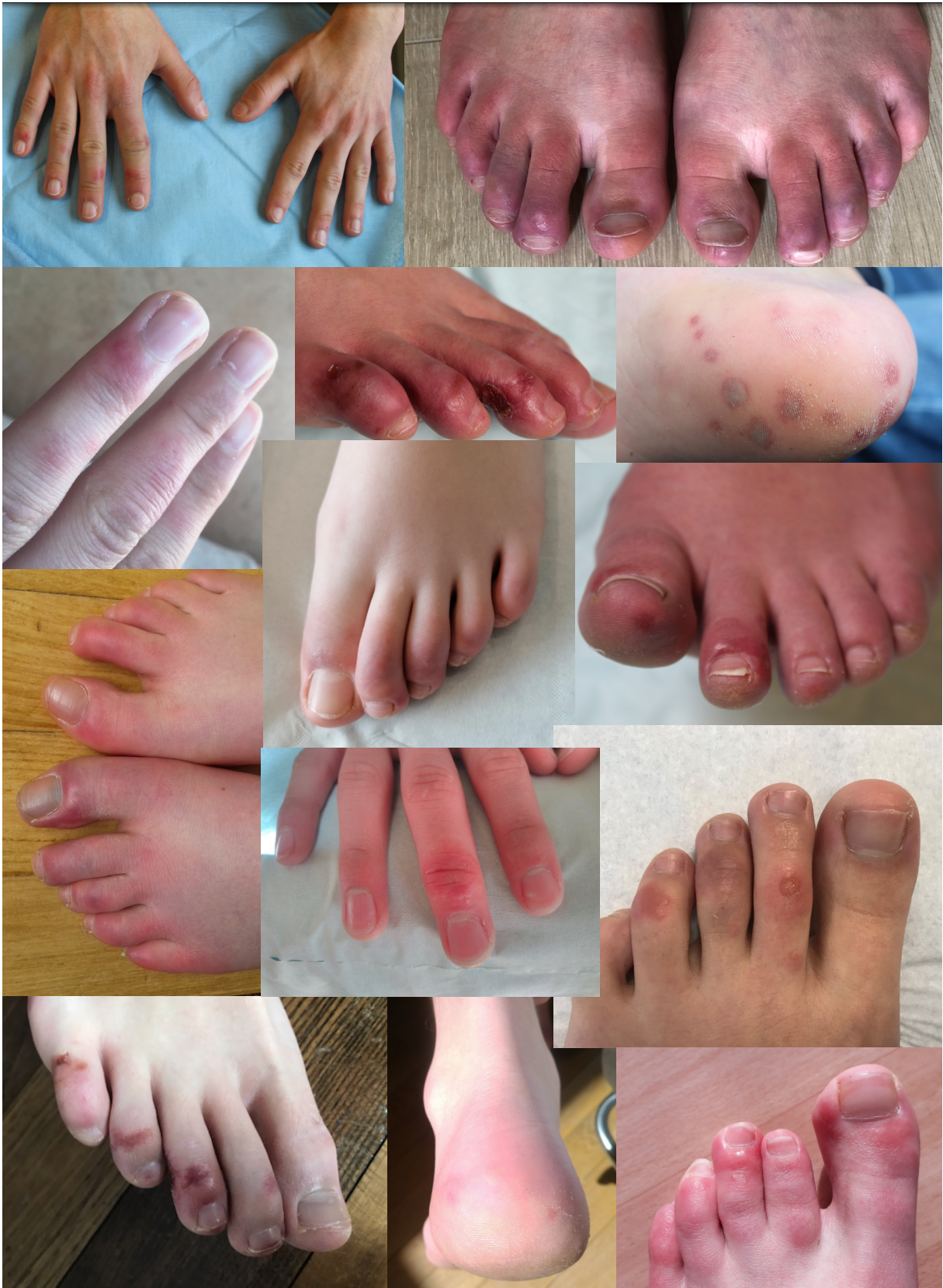
Figure S1 : Planche photographique