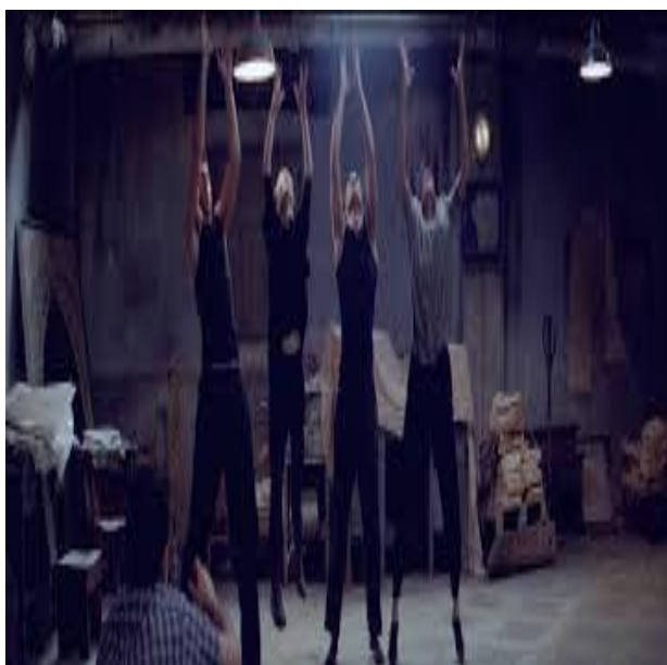
Salle de prière d'une école (Iran)

Dans la dépêche AFP du 27 novembre 2009 annonçant la fuite à Paris d'un danseur et opposant iranien, on ne savait trop ce qui était le plus extraordinaire : avoir réussi à fuir ou être danseur au pays des ayatollahs.