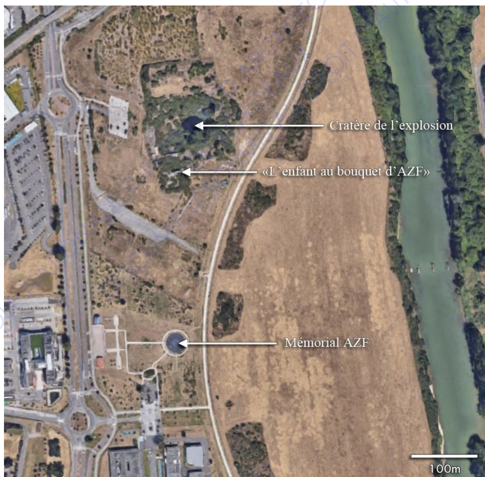
Localisation des différents éléments Base : vue aérienne Google Maps

L'événement crée une nouvelle identité au lieu qui va le faire basculer d'un paysage commun à un lieu de mémoire. La parcelle d'AZF va complètement changer d'usage suite à la catastrophe passant de l'usine chimique à un espace dédié à la santé et à la mémoire. En effet, comme nous l'avons vu, la place de l'ancienne usine abrite aujourd'hui un centre de cancérologie (l'oncopole), des nouveaux cheminements, mobiliers propices aux balades et devient également un paysage support d'œuvres de mémoire sous différentes formes. Comme l'étude du procès le montre, suite à l'explosion de l'usine AZF, l'entreprise Total se voit pointée du doigt comme responsable de la catastrophe. De ce fait, l'entreprise va décider de financer le site du mémorial, alors que les nombreux hectares restants sont eux donnés à la ville. Ainsi, dans ce paysage on va pouvoir rencontrer différentes œuvres/artefact de commémoration. Parmi ces artefacts, les deux principaux sont le Mémorial AZF et « L'enfant au bouquet d'AZF ».