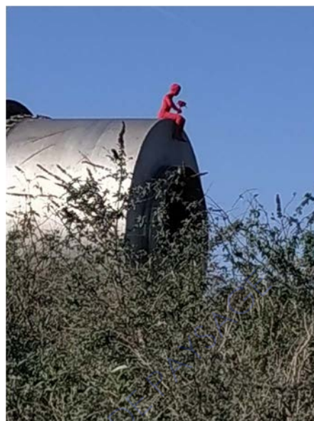
L'enfant au bouquet d'AZF

Tout d'abord, le mémorial AZF qui a été réalisé par l'artiste toulousain Gilles Conan en 2012. C'est une sculpture circulaire composée d'environ 400 tubes d'acier formant un tout de 13 mètres de diamètre. Les tubes sont de hauteurs différentes (de 50cm à 4m), décroissant de l'extérieur vers l'intérieur. En vue aérienne, la sculpture forme un cratère, évoquant ainsi le cratère de l'explosion, situé à quelques centaines de mètres. L'espacement entre ces tubes (60cm) permet au visiteur de pénétrer et s'immerger dans l'œuvre. Ce mémorial a été inauguré à l'occasion du 11 e anniversaire de l'explosion et s'associe à la stèle récemment placée, où sont inscrits les 31 noms des personnes décédées dans la catastrophe. Lors de cette inauguration, les personnes présentes vont pendant un moment observer le mémorial donnant lieu à de nombreuses réactions. Des réactions pour la plupart perplexes, en effet il semblerait que la plupart ont du mal à saisir le sens. Cette incompréhension peut sembler légitime car il n'y a aucune indication sur place expliquant le sens que l'artiste a voulu donner au travers de cette œuvre.