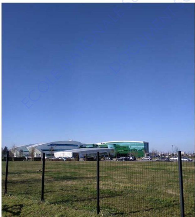
Centre de recherche Pierre Fabre (oncopole)