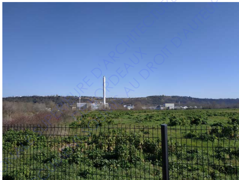
Vue sur l'usine Herakles depuis le cheminement sur le site AZF

Ainsi, la présence de l'usine Herakles dans ce paysage et ce qu'elle incarne, participent à la constitution d'une mémoire régie par la peur et l'incertitude.