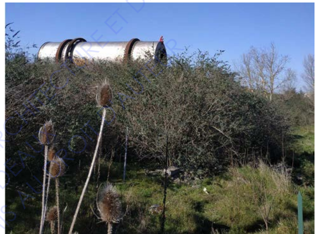
L'enfant au bouquet d'azf