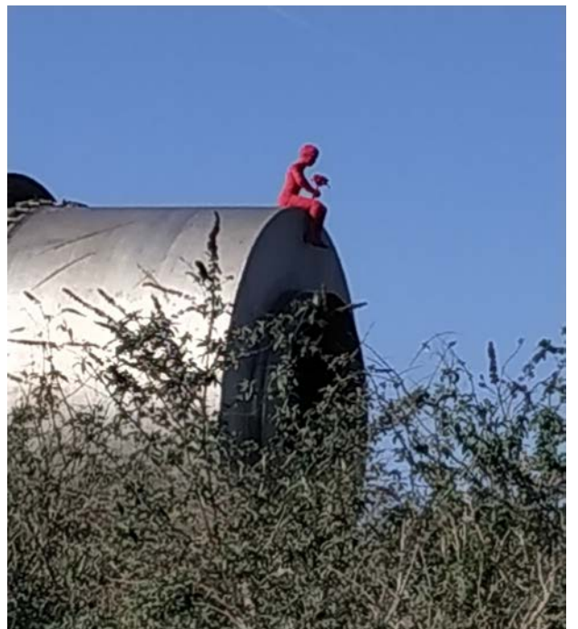
L'enfant au bouquet d'azf (zoom)