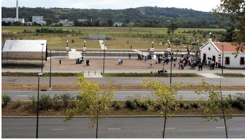
Les bâtisses se faisant face

Ainsi, on a pu voir que longtemps la catastrophe s'est inscrite dans de multiples lieux à Toulouse, mais tardivement dans son espace « originel », l'endroit de l'explosion, symbolisé aujourd'hui par le cratère. Le fait d'investir différents lieux selon les groupes a contribué à établir ce climat de tensions et d'instabilité. Chaque groupe veut inscrire une lecture de l'événement qui lui est propre et le paysage donne à voir ces « concurrences mémorielles » (Demoures, 2015). Les années défilent, les commémorations aussi et le paysage mute sous l'influence de cette mémoire. Certains conflits s'apaisent alors que de nouveaux émergent. Vingt ans après, la question mémorielle est toujours en tension où les espaces vont mettre en scène la mémoire de ces groupes. Sur un même paysage, différentes mémoires vont se superposer dans le temps, un terrain difficilement lisible et donnant lieu à un paysage palimpseste.