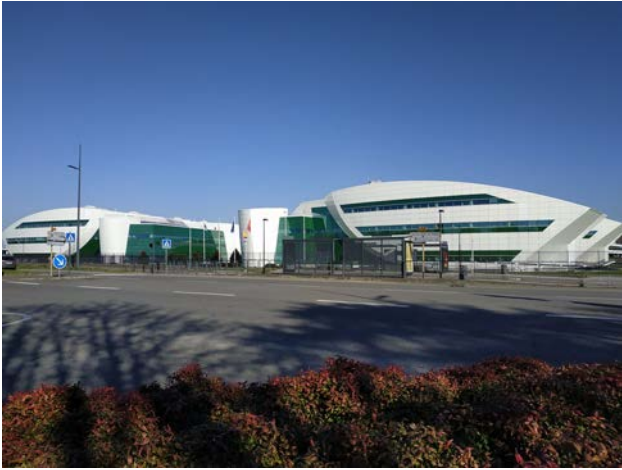
Centre de recherche Pierre Fabre (oncopole)