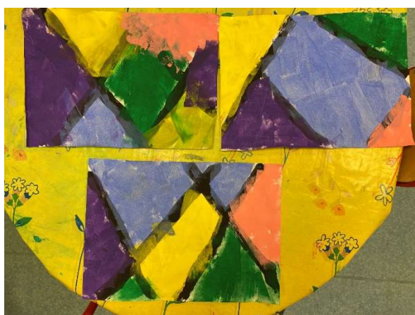
Production de lignes obliques à l'aide de pinceaux en P3 - MS