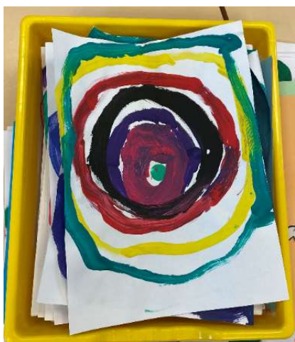
Production de cercles à l'aide de pinceaux en P3 - MS

Voici un exemple de productions plastiques réalisées en PS et en MS sur différents graphismes et sur des réalisations de bonhommes :