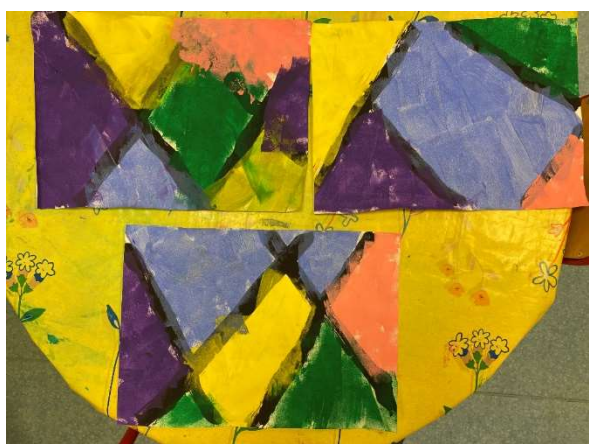
Production de lignes obliques à l'aide de pinceaux en P3 - MS