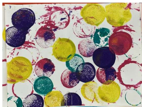
Production de cercle à l'aide de tampons en P2 – PS