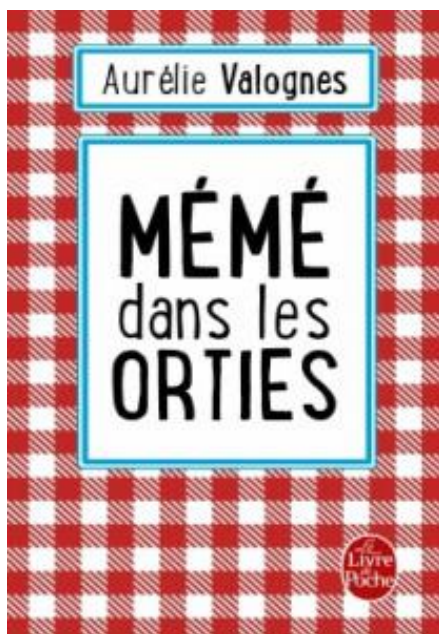
Illustration 1: Couverture Mémé dans les orties , Aurélie Valognes

Le choix de l'expression « Mémé dans les orties » pour le titre suscite en effet le rire chez le lecteur pouvant penser que l'histoire de ce roman, par l'emploi du nom « mémé », va se focaliser sur une dame âgée qui rencontrera peut-être des situations difficiles et devra s'en