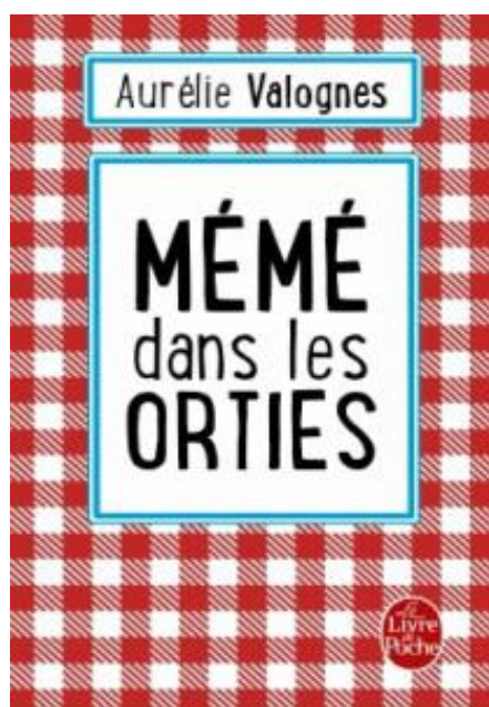
Illustration 1: Couverture Mémé dans les orties , Aurélie Valognes

dépêtrer, d'où « les orties ». C'est pourtant ici d'un vieil homme dont il va s'agir. L'expression d'origine, « faut pas pousser mémé dans les orties » signifiant qu'il « ne faut pas exagérer », peut en effet se rapporter au caractère bougon et difficile du personnage principal Ferdinand qui se plaint très souvent et refoule ses sentiments au début du roman. Il y a également deux échos au titre dans le récit : l'expression est employée au premier degré à la page 104 où Ferdinand pense « non, faut pas pousser mémé dans les orties... ») ainsi qu'à la page 197, lorsque le vieil homme raconte à sa jeune voisine Juliette avoir littéralement mis des orties dans les bottes de son ex-femme pour se venger de son infidélité. De plus, le titre du chapitre 25 (p.139) porte