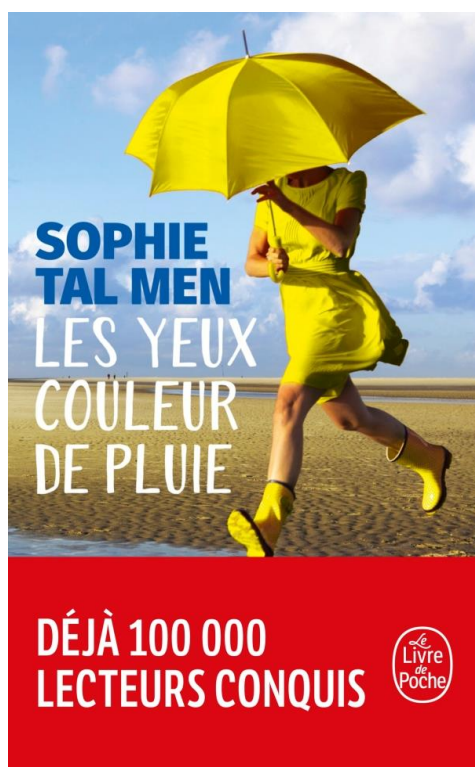
Illustration 3: Les Yeux couleur de pluie , Sophie Tal Men

La photo de couverture des Yeux couleur de pluie renvoie au paysage breton avec un sable encore humide indiquant une marée basse et/ou une récente averse, le ciel semblant être en train de se dégager. Le lieu choisi correspond au cadre dans lequel aura lieu l'histoire de ce roman étant donné que son héroïne devient interne à Brest. Ce que l'on remarque en premier lieu est la femme sautant dans les flaques, le visage masqué par son parapluie. Étant au premier plan, cette femme est en effet entièrement parée d'un jaune vif de manière à attirer l'œil. Cette couleur peut en réalité renvoyer au ciré jaune que l'héroïne s'achètera au début du livre et portera à plusieurs reprises au cours de l'histoire. En plein saut, la femme photographiée pourrait représenter « la légèreté du roman 45 » ou être un reflet du désir d'évasion par la