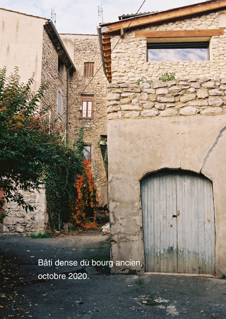
Bâti dense du bourg ancien, octobre 2020.