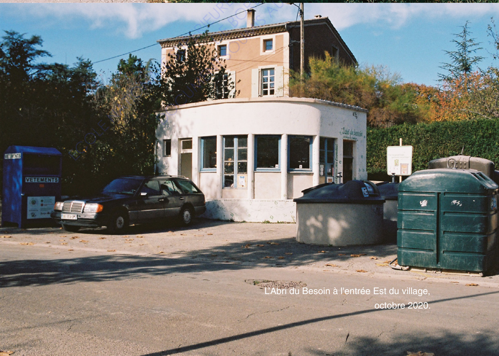
L'Abri du Besoin à l'entrée Est du village, octobre 2020.