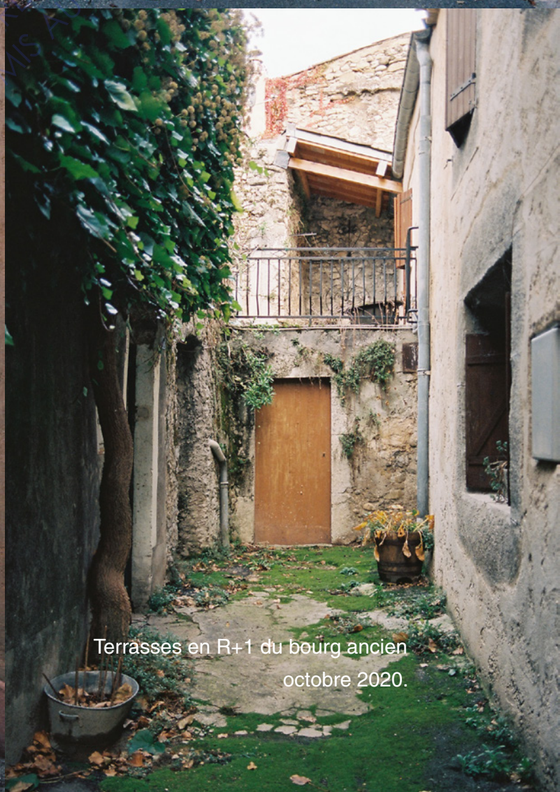
Terrasses en R+1 du bourg ancien octobre 2020.