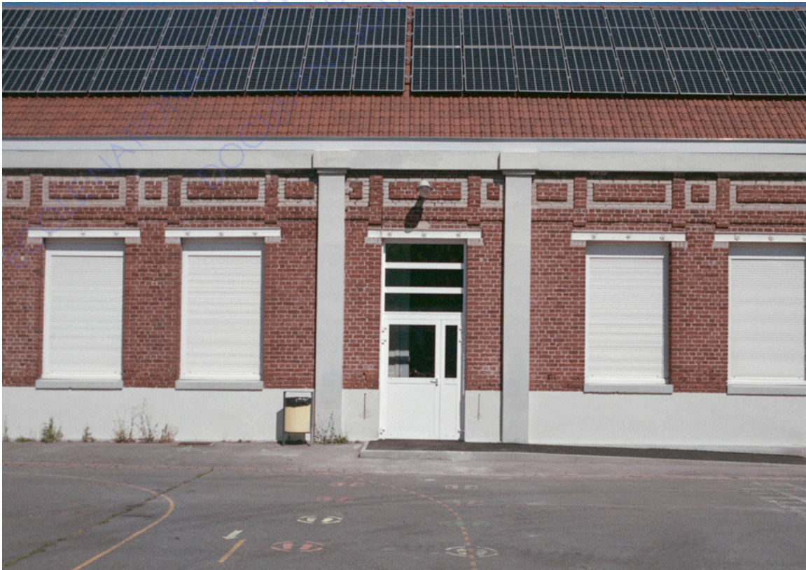
Couverture photovoltaïque de l'école Basly, juillet 2020.