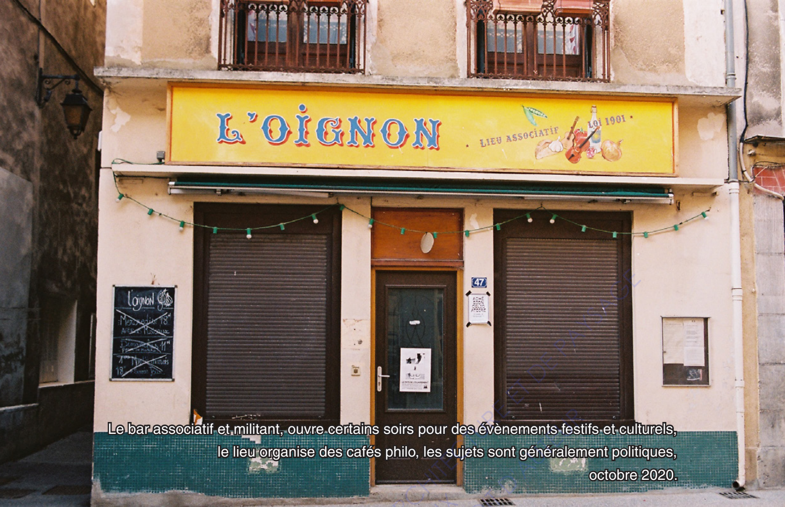
Le bar associatif et militant, ouvre certains soirs pour des événements festifs et culturels, le lieu organise des cafés philo, les sujets sont généralement politiques, octobre 2020.