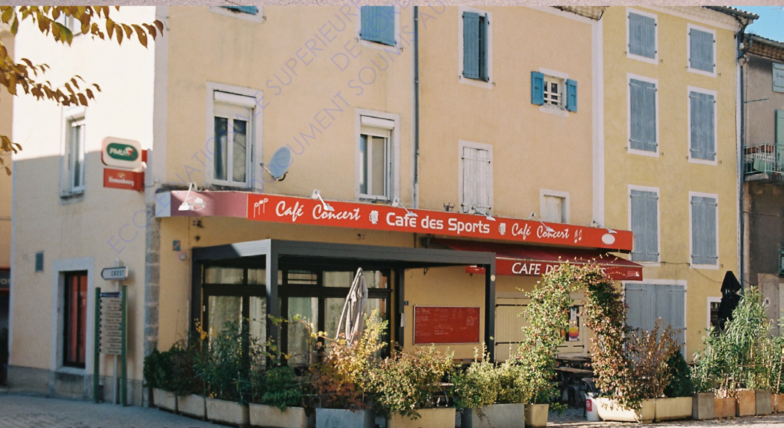
L'unique bar du village ouvre tous les jours et se situe au croisement de la Grande Rue et de la rue Raoul Lambert, qui traverse la rivière et mène à l'école et à la mairie, octobre 2020.