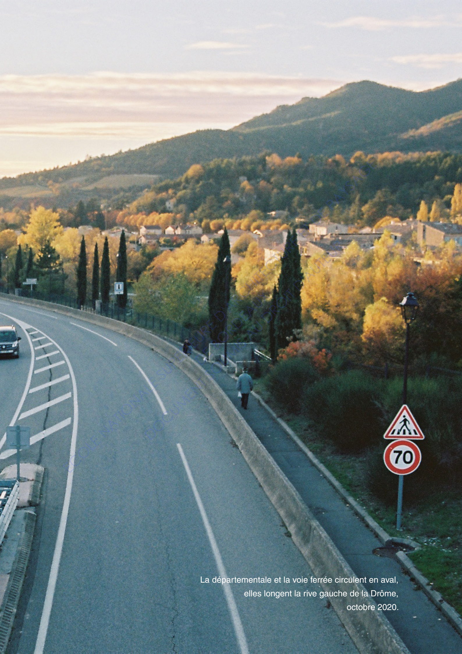
La départementale et la voie ferrée circulent en aval, elles longent la rive gauche de la Drôme, octobre 2020.