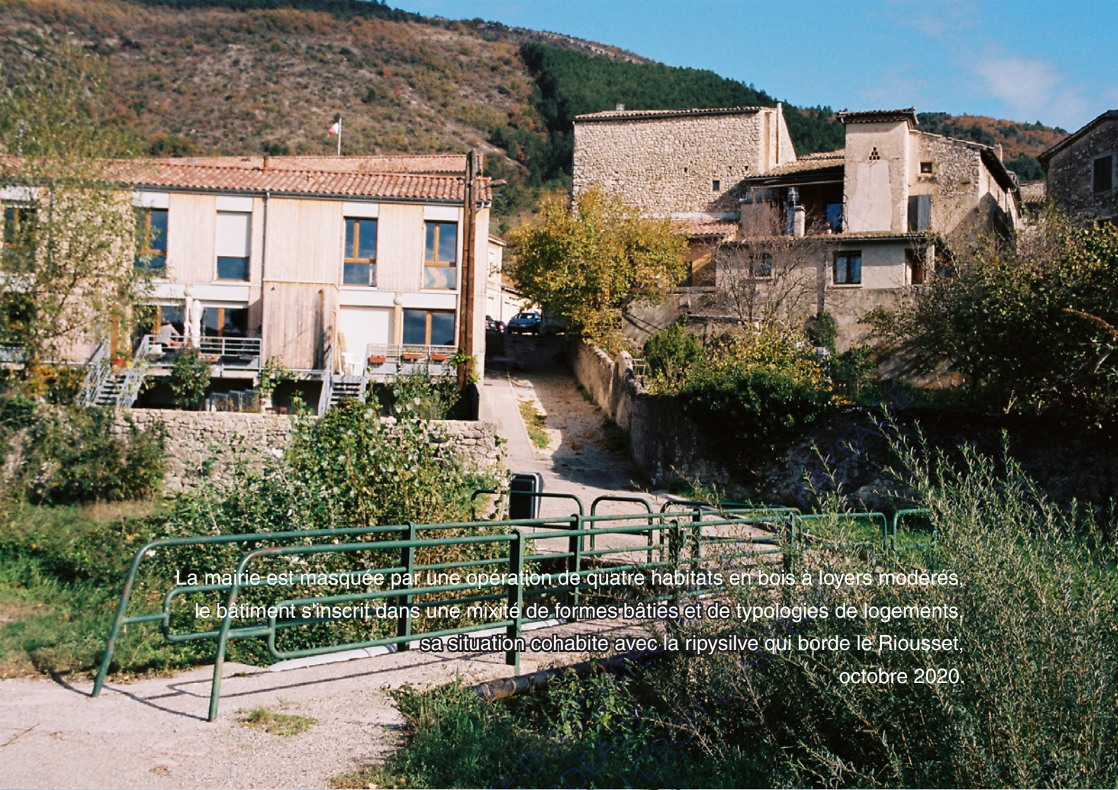
La mairie est masquée par une opération de quatre habitats en bois à loyers modérés, le bâtiment s'inscrit dans une mixité de formes bâties et de typologies de logements, sa situation cohabite avec la ripisylve qui borde le Rioussel, octobre 2020.