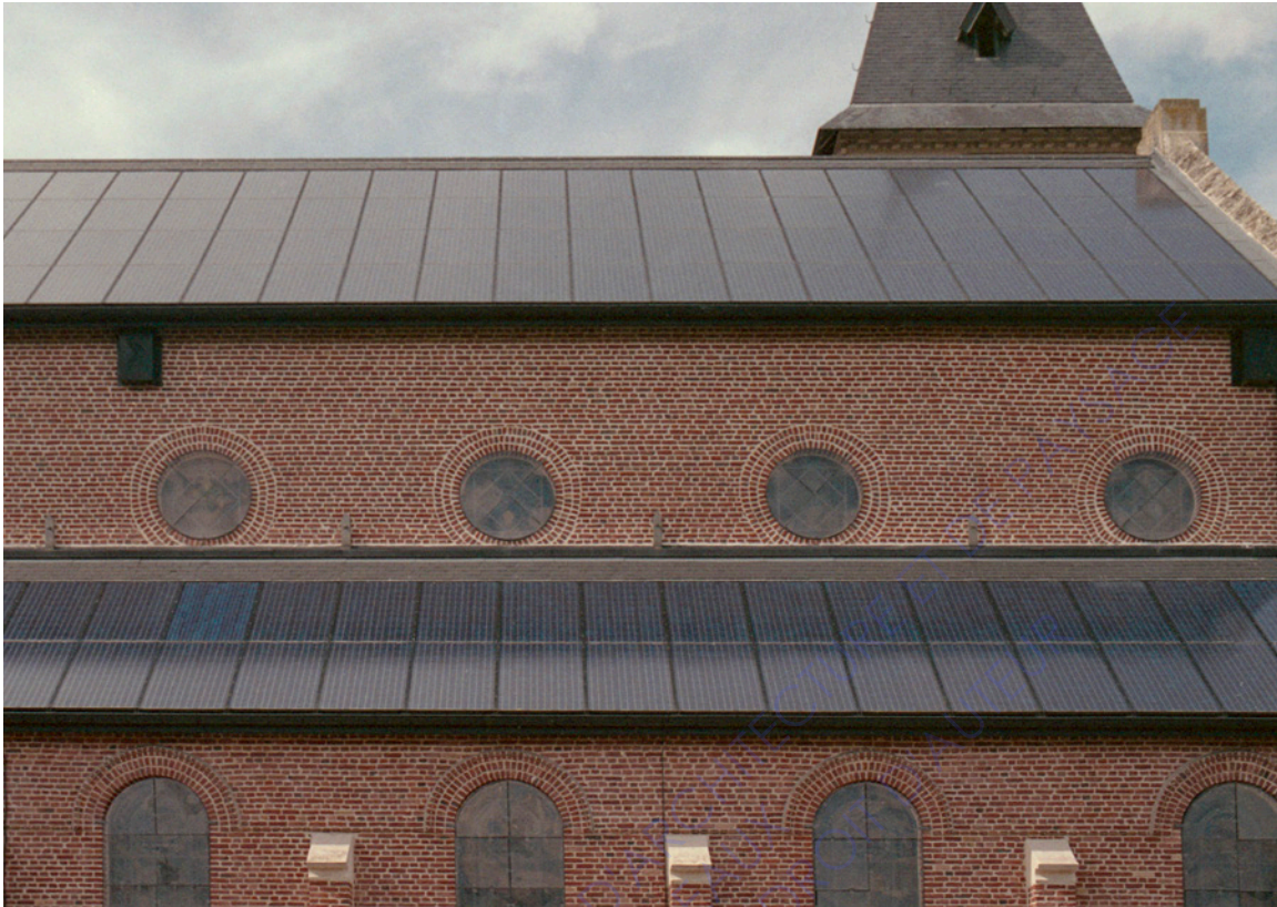
Couverture photovoltaïque de la nef de l'église Saint Vaast, juillet 2020.