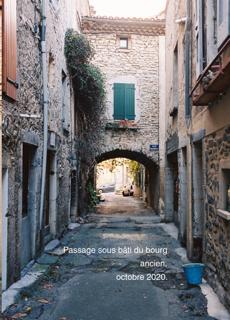
Passage sous bâti du bourg ancien, octobre 2020.