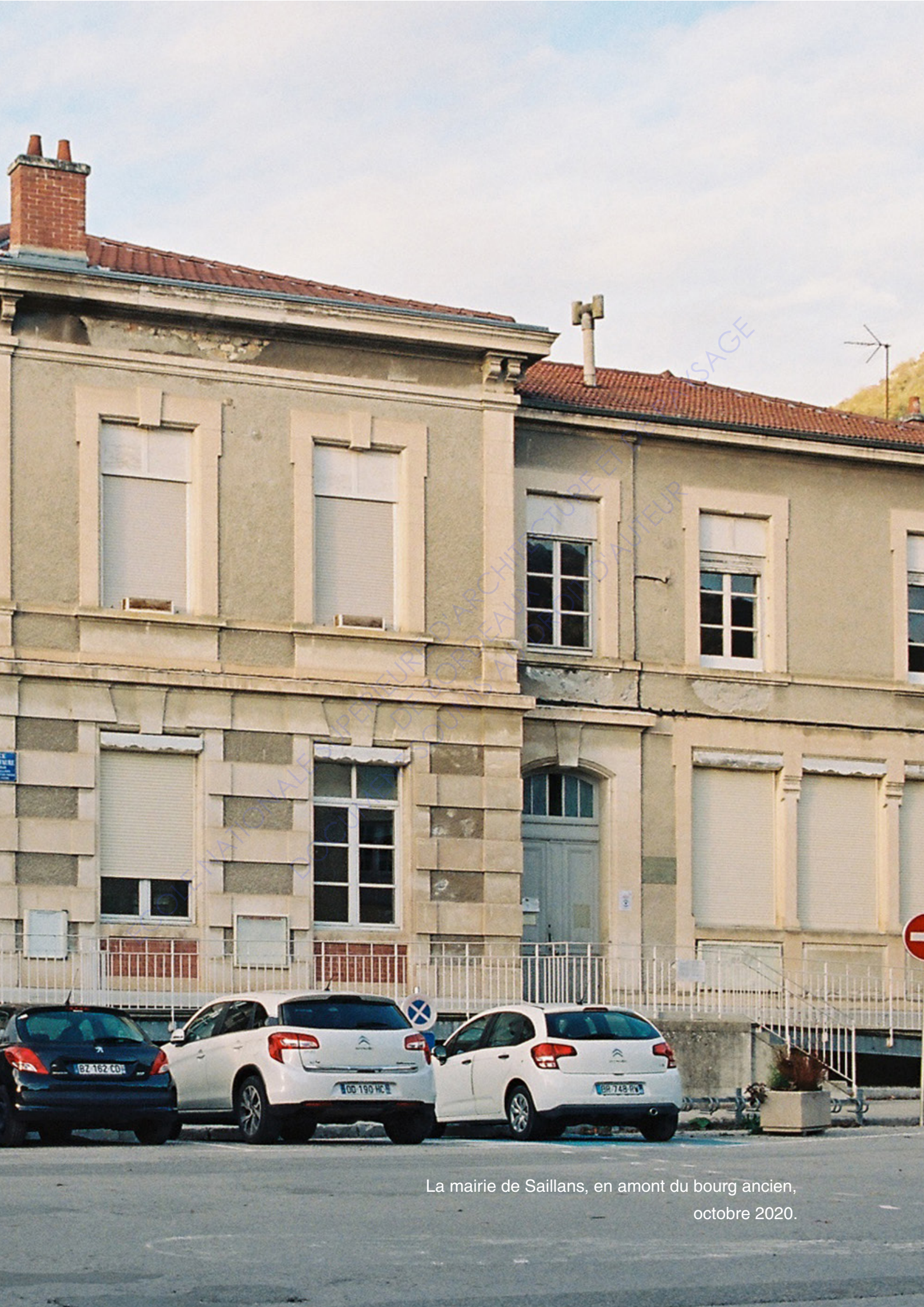
La mairie de Saillans, en amont du bourg ancien, octobre 2020.