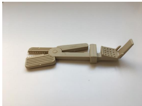
Pince porte-films HAGER & WERKEN Emmenix.

Le développement des radiographies s'effectuait grâce au Scanner d'écrans à mémoire VistaScan Mini Plus DÜRR DENTAL en provenance de Gechingen (Allemagne), et le logiciel DBSWIN DÜRR DENTAL permettait leur numérisation et leur enregistrement.