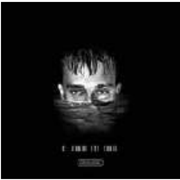
VALD - Ce monde est cruel - 2019