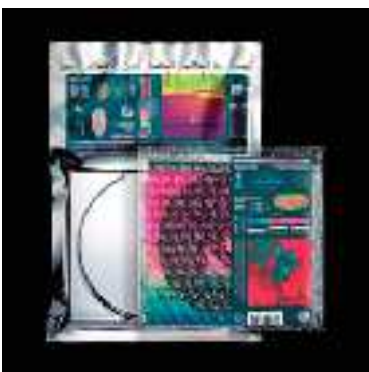
NEKFEU - Les étoiles Vagabondes - 2019

Corpus comparatif (albums de rappeurs français sorties au même moment que ceux des PNL, en 2019)