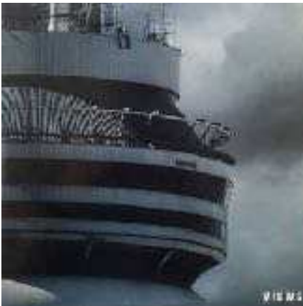
Views, Drake - 2016