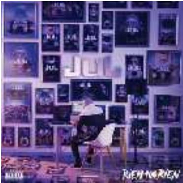
JUL - Rien 100 rien - 2019