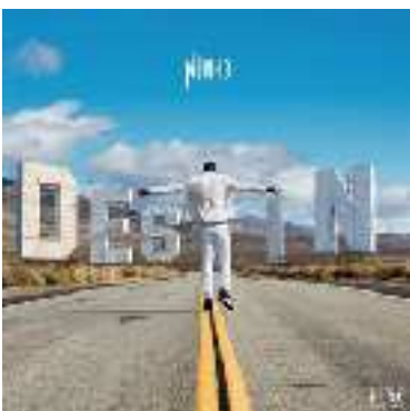
NINHO - Destin - 2019