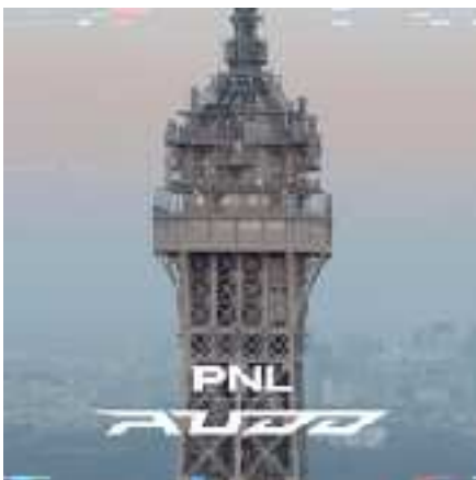
Au DD, PNL - 2019