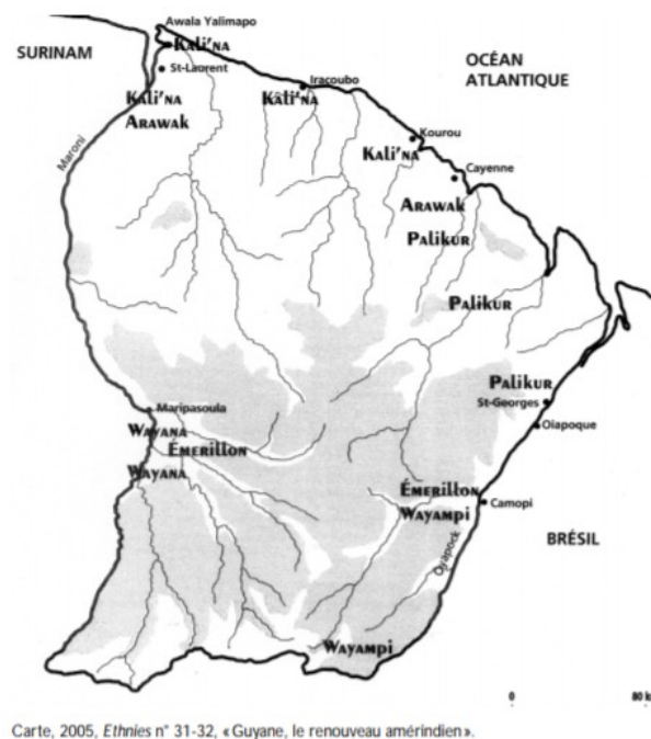
Figure 1 : Carte des lieux de vie principaux des différentes ethnies amérindiennes de Guyane en 2005 (Ethnies n°32-32, 2005).

Ces populations côtoient à l'Ouest les Noirs Marrons appelés « Bushinengue », essentiellement Aluku, descendants d'esclaves africains échappés des plantations hollandaises (aujourd'hui le Surinam) venus se réfugier sur le Marwini, affluent du Maroni, au cours du 19 ème siècle.