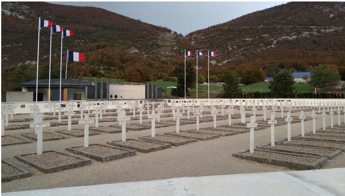
Photo des tombes de la nécropole avec le mémorial en arrière-plan.