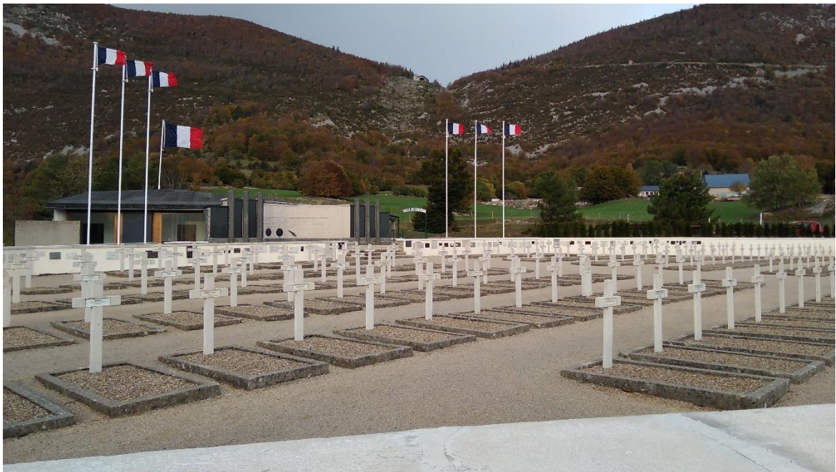
Photo des tombes de la nécropole avec le mémorial en arrière-plan.