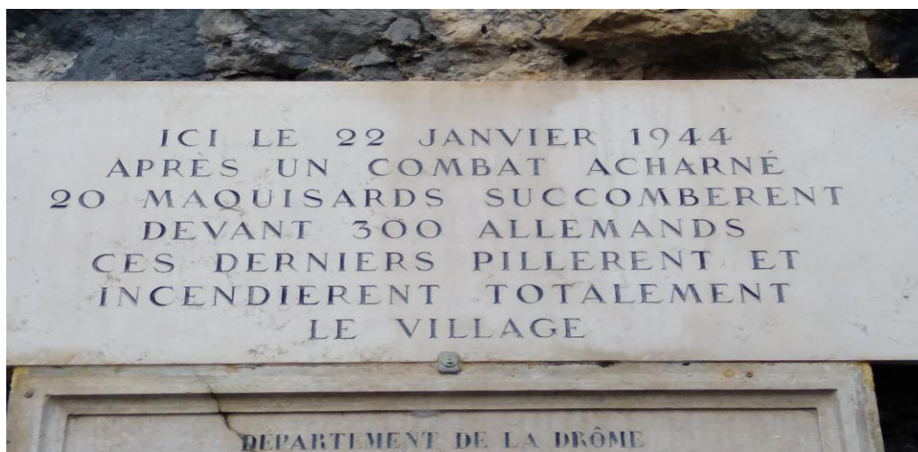
Photo de la plaque commémorative du hameau des Barraques-en-Vercors 4 .

L'une des lettres découverte dans les archives de La Picirella dénonce ce qu'il nomme des "contre-vérités". Il souhaite alors procéder à des rectifications 3 .