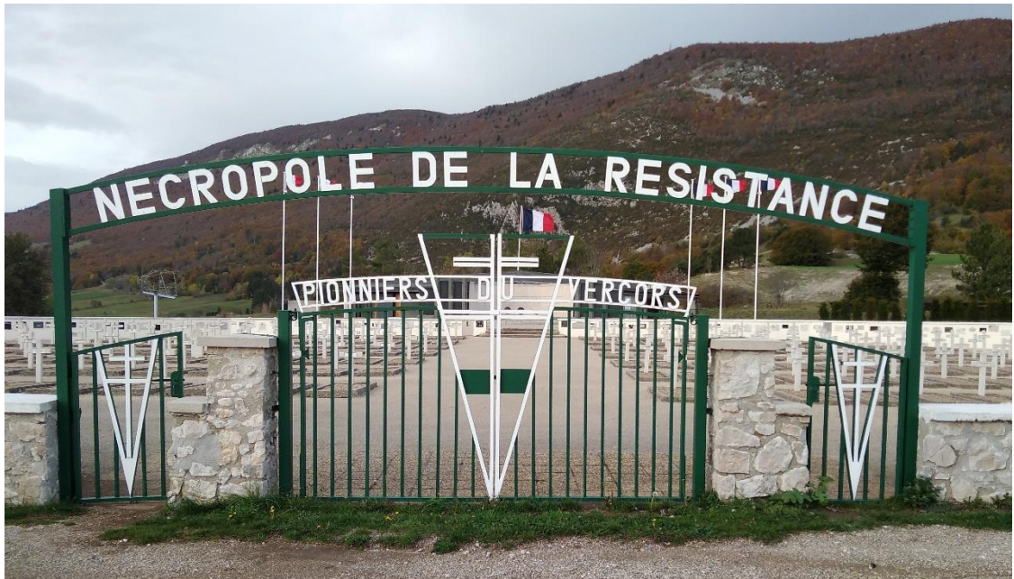
Devanture de la nécropole de Vassieux, 2019.