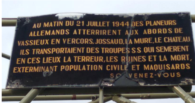
La plaque apposée au planeur, à côté de la nécropole de Vassieux-en-Vercors 25 .